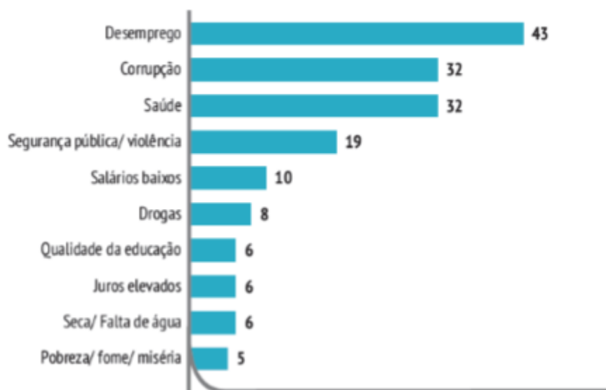
Tablica 3. IBOPE -ovo istraživanje javnog mnijenja u Brazilu (2016.) o percepciji najvažnijeg problema u državi

* Izvor: IBOPE -ovo istraživanje javnog mnijenja 2016 (Melo, 2017: 30)