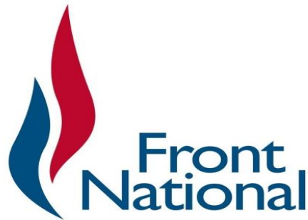
Slika 1. Logo Nacionalne fronte Francuske