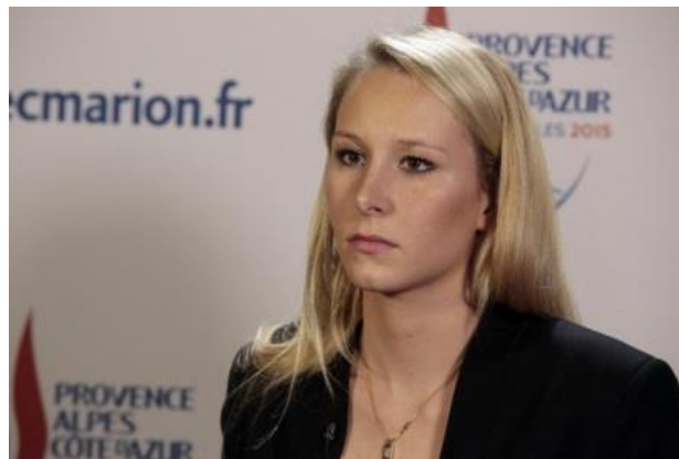
Slika 4. Marion Jeanne Caroline Maréchal-Le Pen