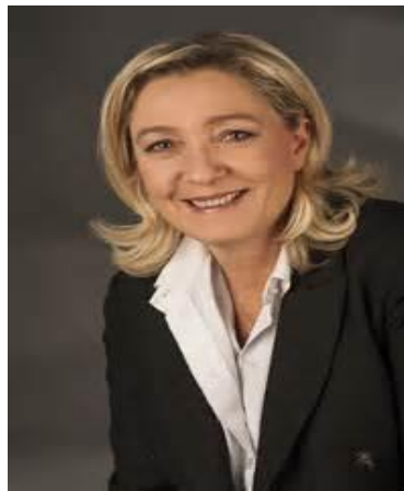
Slika 3. Marine Le Pen

Panthéon-Assas, poznatijem kao Drugo sveučilište Pariza 1991. godine te je ostala ondje kako bi dobila diplomu za kazneno pravo. Godine 1992. počinje obavljati praksu, te radi u pariškom odvjetništvu do 1998. godine nakon čega se priključuje administraciji Nacionalne fronte, gdje obnaša funkciju direktorice pravnih poslova stranke sve do 2003. godine, kada postaje potpredsjednica. Sljedeće godine uspješno se natječe za mandat u Europskom parlamentu, gdje se pridružuje svome ocu. Tijekom sljedećih godina, politički se izgrađuje unutar stranke, te upravlja očevom predsjedničkom kampanjom 2007. godine.