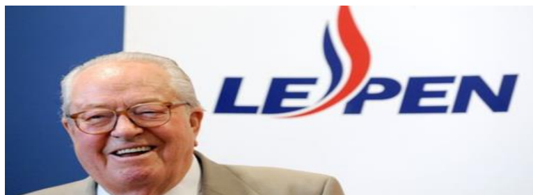
Slika 2. Jean-Marie Le Pen