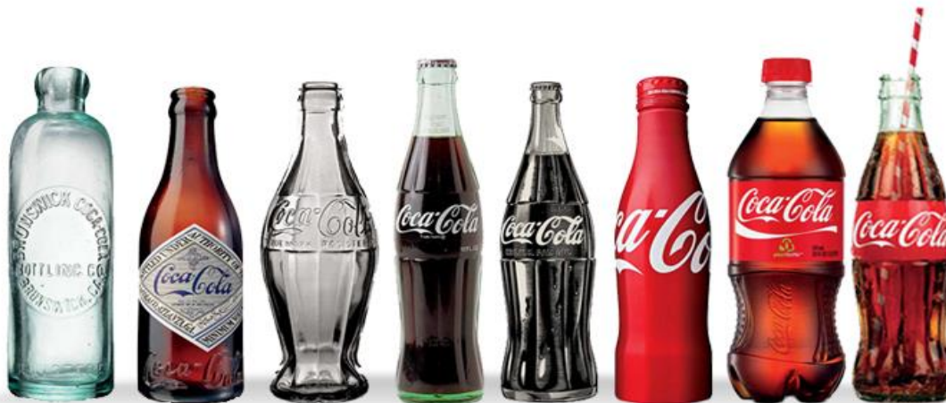
Slika 3: evolucija Coca-Cola boce

Tridesetak godina kasnije, Coca-Cola odlučuje izmijeniti etiketu dodajući bijelu boju uskim bocama ( www.timetoast.com ). Ono što je bitno napomenuti jest da je 1961. godine, boca Coca-Cola prepoznata kao zaštitni znak ( www.coca-colacompany.com ). Krajem prošlog stoljeća Kompanija počinje s proizvodnjom plastičnih boca čime se ponovno ističu od konkurencije. Zadnja modifikacija dizajna bila je 2009. godine kada je Coca-Cola stvorila bocu pod nazivom "Plant" jer se može reciklirati i sastoji se od 30% obnovljivog biljnog materijala ( www.timetoast.com ).