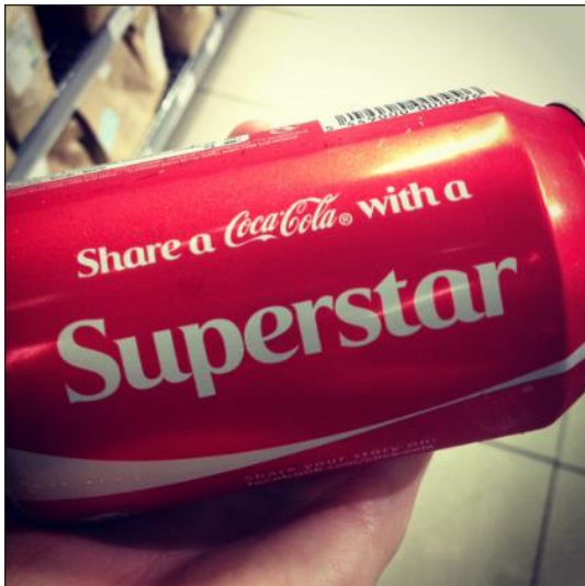
Slika 4: #ShareaCoke

navedeno je kako je jedan od ciljeva oglašivača stimulacija pažnje na oglašen proizvod i