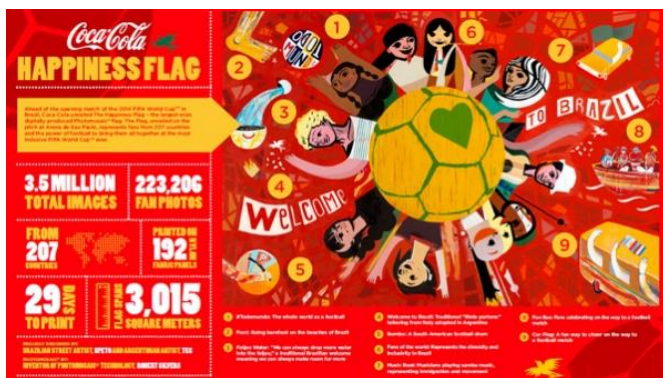
Slika 8: Zastava sreće

Još jedan značajan element sponzorstva 2014. godine je službena glazbena himna “ The World Is Ours ” s vokalima Davida Correyja i zvukovima brazilskog uličnog sastava Monobloco. “ The Happiness Flag ” odnosno Zastava sreće je najveći fotomozaik ikad stvoren, a sastoji se od: