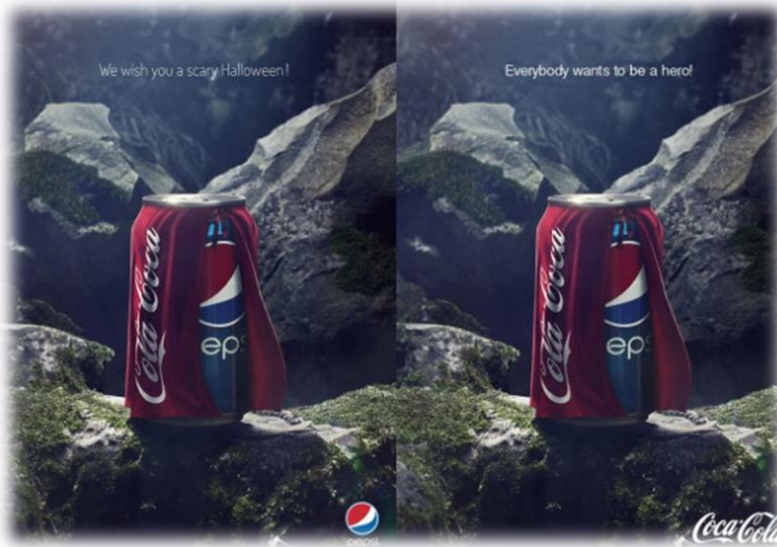
Slika 5: Pepsi Halloween reklama

Sveprisutno je već spomenuto komparativno oglašavanje koje dijelimo na izravno i neizravno. Izravno komparativno oglašavanje koristi Pepsi koja vrlo agresivno napada svoju konkurenciju Coca-Colu (Šegvić,2010). Pepsi je 2013. godine emitirala reklamu za vrijeme “Noći vještica” u kojoj je limenka Pepsi zamaskirana u plašt Coca-Cole. Ovim potezom, Pepsi je obznanila tko je njen najveći konkurent, a to je Coca-Cola.