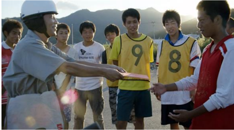
Slika 7: Pozivnica za FIFA World Cup

Uz Olimpijske Igre, Coca-Cola je ponosni sponzor FIFA World Cup, a to partnerstvo traje još od 1978. godine. Kompanija je oglašavala stadione na svakom Svjetskom prvenstvu od 1950. godine, a FIFA i Kompanija svoje partnerstvo su proširili na razdoblje do 2030. godine.