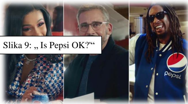
Slika 9: „Is Pepsi OK?“

Super Bowl je događaj, iznimno popularan u Americi, gdje ogroman broj ljudi prati utakmicu uživo i ispred malih ekrana, stoga je ovo prava prilika za Pepsi da bi "(...) zgrabila pozornost konzumenata. (...) To je dan kada se ljudi okupljaju zajedno i uživaju u grickalicama i piću kako bi upotpunili doživljaj." ( www.adweek.com ). Ove godine se održavao u Atlanti, rodnom kraju Coca-Cole, ali to nije zaustavilo PepsiCo od kreiranja zarazne reklame. Reklama se bazira