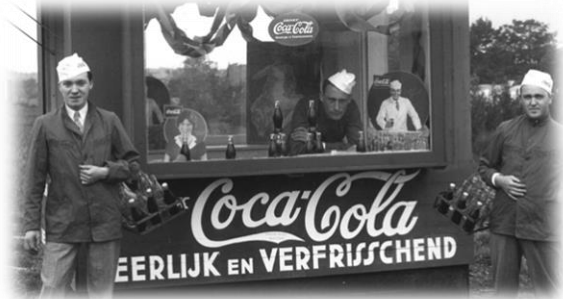
Slika 6: Kiosk u Amsterdamu 1928. godine

Pozitivne strane ovakve vrste promocije vlastitog poduzeća i proizvoda uspješno je iskoristila Coca-Cola. Davne 1928. godine Kompanija je prvi put sponzorirala Olimpijske igre u Amsterdamu. Ovaj događaj imao je veliki značaj za tvrtku jer je prvi put predstavila svoj proizvod Nizozemskim potrošačima. Danas je poznato da Coca-Cola predstavlja