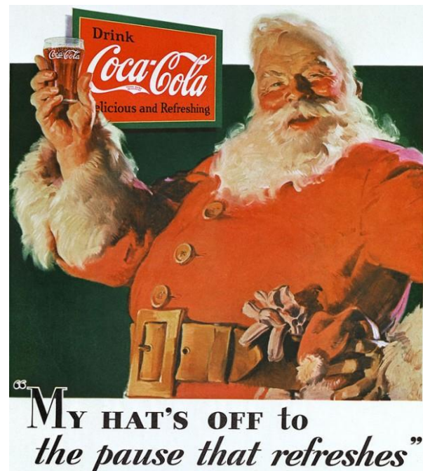
Slika 2: Božićna reklama 1931.

jednostavno uživao u piću skupljajući igračke i spuštajući se niz dimnjak. Jedne godine, Sundblom je u reklami prikazao zahvalnog Djeda Božićnjaka koji je otkrio bocu Coca-Cole na