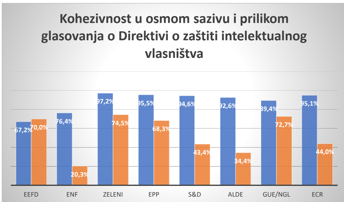
Graf 5 Usporedba kohezije u osmom sazivu sa kohezijom prilikom glasovanja o Direktivi o zaštiti intelektualnog vlasništva

70%, dok kod ENF-a iznosi svega 20, ALDE-a 34 te Socijalista 43 posto. Ako iz ovih rezultata izračunamo prosjek kohezivnosti samih grupacija, rezultati nam pokazuju kako je prosječna kohezivnost iznosila 53,5 posto. U Grafu 1 grafički je napravljena usporedba kohezivnosti političkih grupacija u osmom sazivu sa kohezijom grupacija kod ovog specifičnog glasovanja. Jasno je vidljiv pad kohezije svih europskih grupacija osim EEFD-a gdje je kohezija kod glasovanja narasla za nešto manje od tri postotna boda. Na temelju ovih rezultata dalo bi se zaključiti kako je uloga političke grupacije bila mala, te nije bila odlučujući faktor prilikom odluke zastupnika o glasovanju na plenarnoj sjednici (term8.votewatch.eu, 2020).