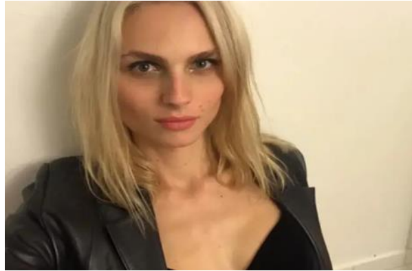
Slika 4. Transrodni model Andreja Pejić

Javnost najčešće događaje, ljude i proizvode povezuje sa slikama. Upravo zbog toga, način serviranja fotografija može dovesti do jačanja stereotipa u društvu (Kaić, 2017: 23). Portal 24sata.hr najčešće izvještava o transrodnim ženama kada su one modeli, porno glumice, sponzoruje, youtuberice i slično, te u tom slučaju, stavljaju naglasak na attribute njihove ljepote putem fotografija. S obzirom na to da mediji danas najviše zarađuju plasirajući sadržaje vizualnog tipa, nije ni čudno da se prilikom izvještavanja o ženama stavlja naglasak na njihov fizički izgled (Klimpak, Lubina, 2014: 223). Sukladno time šalju javnosti krivu sliku – da žene moraju biti lijepe, neovisno o tome da li su transrodne ili ne.