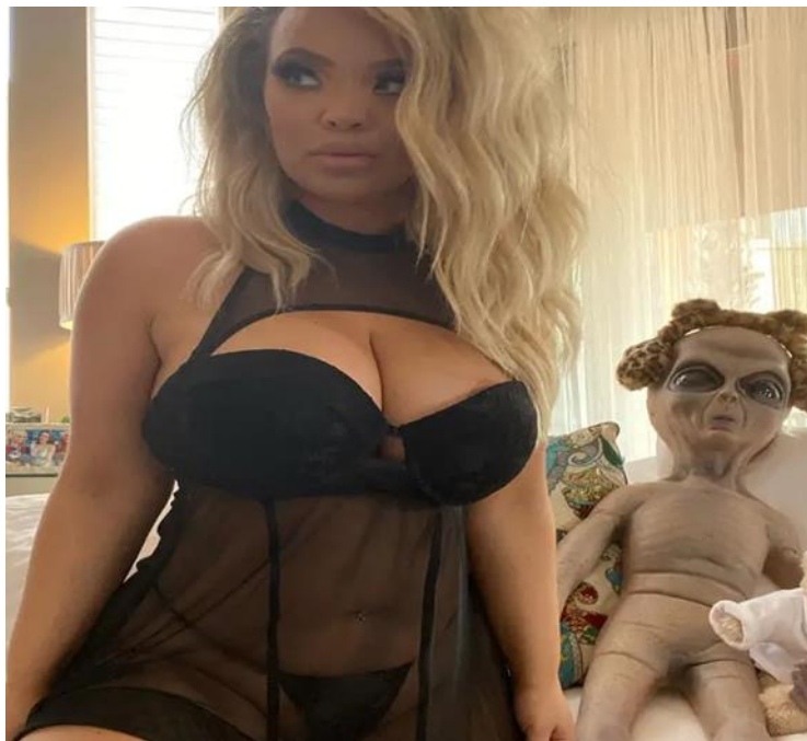
Slika 6. Transrodna Youtuberica Trisha Paytas

Osim sukoba, pornografizirani su i još neki od članaka putem slika. Teme su raznovrsne, ali su popraćene slikama polugolih žena. Takav jedan primjer možemo uočiti na slici 6.