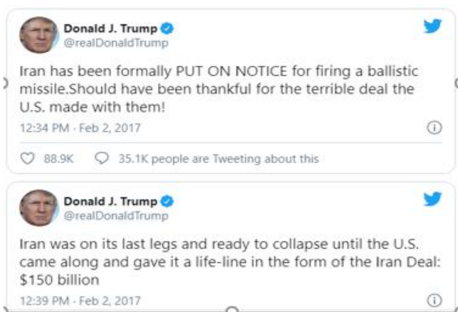
Slika 2. Tweetovi predsjednika Donalda Trampa

Ministar vanjskih poslova Irana Javad Zarif nije ostao dužan Trumpu, optuživši SAD kako se ne drži odredbi sporazuma, te kako podržava militantne ekstremiste poput Al'Quaide u Siriji.