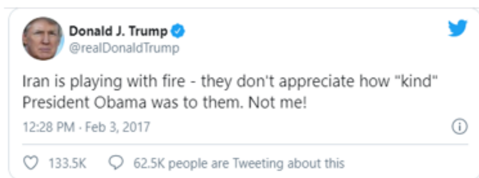
Slika 1. Tweet predsjednika Donalda Trumpa upućen Iranu

Pobjeda Donalda Trumpa na predsjedničkim izborima 2016. godine dovela je do dramatičnog zaokreta u američkoj vanjskoj politici. Iranski nuklearni sporazum ispregovaran između Irana i šest svjetskih sila Trump je nazvao „najgorim dogovorom ikad ispregovaranim“ 21 . Od dolaska na vlast 2017. godine Trumpova administracija zauzela je prema Iranu agresivniji stav od svojih prethodnika. Tek dva tjedna nakon preuzimanja dužnosti, Trumpov savjetnik za nacionalnu sigurnost, Michael Flynn izjavio je da se „Obamina administracija pokazala neuspješnom u adekvatnom dogovaranju na iranske maliciozne radnje poput trgovanja oružjem i terorizma. Od danas, službeno upozoravamo Iran“ 22 . Uslijedio je i niz neprijateljski raspoloženih tweetova Donalda Trumpa upućenih Iranu.