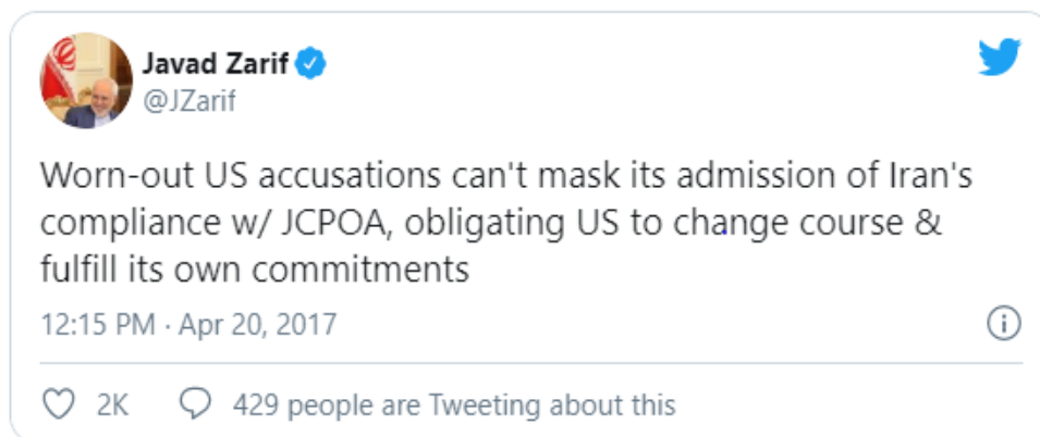
Slika 3. Tweet iranskog ministra vanjskih poslova Javada Zarifa

Ministar vanjskih poslova Irana Javad Zarif nije ostao dužan Trumpu, optuživši SAD kako se ne drži odredbi sporazuma, te kako podržava militantne ekstremiste poput Al'Quaide u Siriji.