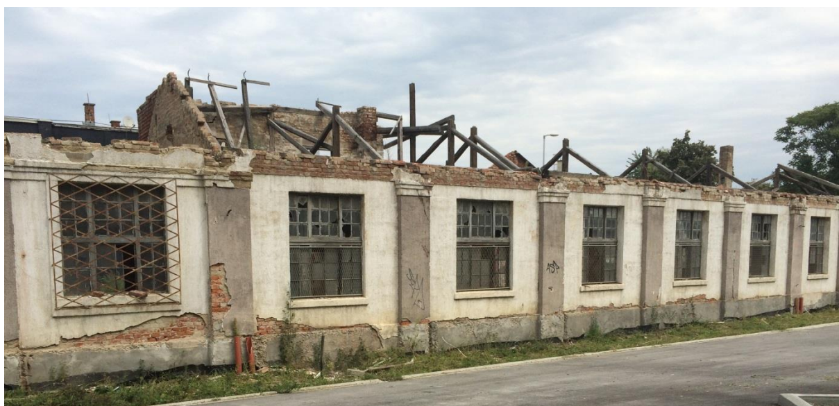
Slika 6: fotografija prikazuje ostatke industrijske arhitekture na sjeveroistočnoj strani Radničke ceste

uglavnom su prepušteni sami sebi i propadaju, pa je tako u 2009. godini udruga Queer Zagreb pokušala podići svijest o tom problemu organizirajući tulum u tvorničkim prostorima. Cilj tih tulum bio je „upozoriti na to da ne postoji strategija ulaganja u te prostore, kao što je to u većini gradova Europe koji drže do svoje industrijske arhitekture“ 8 . „Usporedbom namjene zemljišta u Generalnom urbanističkom planu Grada Zagreba iz 1971. s onim iz 2009. godine jasno se vide promjene do kojih je došlo“ tvrdi Benaković (2012: 43) i nastavlja kako je sekundarni sektor ovog područja porušen kako bi se ustupio prostor ekonomski isplativijem i ekološki prihvatljivijem tercijarnom i kvartalnom sektoru. Dakle, sjajne i visoke zgrade na jugozapadnoj strani Radničke ceste niknule su nakon što su investitori porušili ostatke industrijskih pogona koji su im prethodili. Prema Generalnom urbanističkom planu Grada Zagreba i njegovim dopunama i prijedlozima, možemo zaključiti da ista sudbina čeka i sjeveroistočnu stranu.