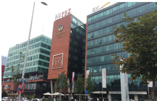
Slika 4: poslovno-trgovački centar Green Gold snimljen s radničke ceste

Na Radničkoj cesti uglavnom prevladavaju poslovne zgrade i poslovni kompleksi. Najdominantnije građevine, one koje je jednostavno nemoguće ne zamijetiti u šetnji Radničkom, svakako su poslovno-trgovački kompleks Green Gold i monumentalno sjedište Privredne banke Zagreb. U brojnim poslovnim zgradama smjestile su se uprave nekih od najvećih tvrtki koje posluju u Hrvatskoj – svoje mjesto pronašli su Allianz, Generali i Basler osiguranje, Privredna banka Zagreb, Raiffeisen banka, Erste banka, Podravska i Kreditna banka, popularni Nanobit, građevinske tvrtke Tehnika i VMD te brojni odvjetnički uredi. Ovdje se nalazi i luksuzni hotel Hilton (s adresom Ulica grada Vukovara, ali može mu se pristupiti i s Radničke).