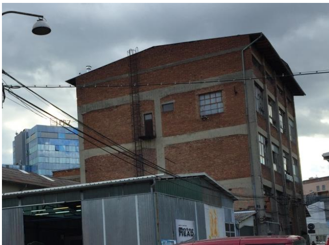
Slika 10: fotografija prikazuje kontrast između oronule zgrade bivše tvornice Katran (unutar koje djeluje klub) i imponantnim PBZ centrom s druge strane Radničke ceste

Noćni klub Katran tako možemo čitati kao kontrast moćnim financijskim institucijama i drugim tvrtkama, ali i vladajućoj strukturi Grada Zagreba, koji izgradnjom uredskih prostora, a popratno i luksuznih objekata za stanovanje i provođenje slobodnog vremena pokušavaju istjerati radničko stanovništvo s područja koje okružuje Radničku cestu kako bi u potpunosti uspjeli razviti zagrebački City . Ovaj oblik otpora šalje zagrebačkoj javnosti jasnu poruku o tome kako se ovaj dio grada može reurbanizirati i na drugačiji način, ne samo potpunim razrušavanjem industrijskog nasljeđa. Urbana noćna scena grada dobila je zanimljiv dodatak, a propala tvornica počela proizvoditi zabavu i kulturu.