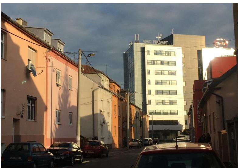
SLIKA 8 i SLIKA 9: moderne zgrade naslanjaju se na starije obiteljske kuće vidno lošije kvalitete

Ovakvom izgradnjom zanemaruje se bogato industrijsko nasljeđe i kulturni potencijal ovoga područja koje se pokušava pretvoriti u središnju poslovnu zonu po uzoru na globalne gradove. Urbana regeneracija, to jest „strukturna i funkcionalna izmjena koju određenih dijelova grada koju financiraju privatni (korporativni), a nekada i državni akteri“ (Čaldarović i Šarinić, 2009: 369) proces je koji možemo locirati na ovom području čim uočimo kontrast između oronulih ostataka industrijskih postrojenja i novoizgrađenih modernih objekata. Ovakvi projekti urbane regeneracije koji uglavnom zanemaruju zatečeno stanje stvari „privlače mnogo pažnje i velike investicije, ali takav njihov razvoj uzrokuje gentrifikaciju“ (Cizler, 2012:224).