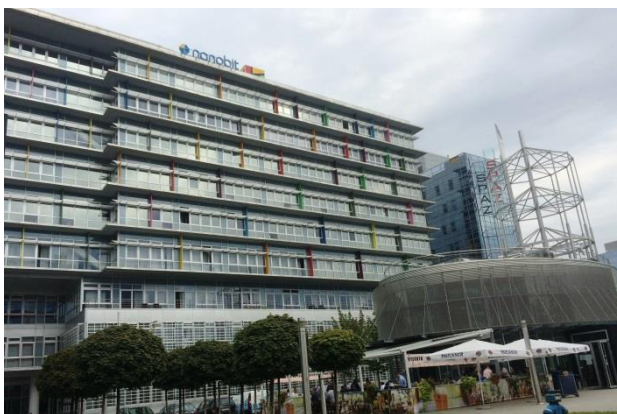
Slika 5: poslovni kompleks Centar 2000 u kojem je sjedište tvrtke Nanobit

Iako je jugozapadna strana Radničke ceste uglavnom popunjena modernim poslovnim centrima i stambenim zgradama, na sjeveroistočnoj strani ceste nalaze se oronuli ostatci industrijskih pogona od kojih su neki arhitektonski i kulturalno dragocjeni pa tako „određeni industrijski objekti, zgrade starih tvornica, predstavljaju vrijedne uzorke industrijskog nasljeđa“ (Slavuj i dr., 2009: 79). Ti vrijedni uzorci industrijskog nasljeđa na Radničkoj cesti