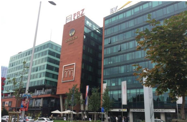
Slika 4: poslovno-trgovački centar Green Gold snimljen s radničke ceste

Na Radničkoj cesti uglavnom prevladavaju poslovne zgrade i poslovni kompleksi. Najdominantnije građevine, one koje je jednostavno nemoguće ne zamijetiti u šetnji Radničkom, svakako su poslovno-trgovački kompleks Green Gold i monumentalno sjedište Privredne banke Zagreb. U brojnim poslovnim zgradama smjestile su se uprave nekih od najvećih tvrtki koje posluju u Hrvatskoj – svoje mjesto pronašli su Allianz, Generali i Basler osiguranje, Privredna banka Zagreb, Raiffeisen banka, Erste banka, Podravska i Kreditna banka, popularni Nanobit, građevinske tvrtke Tehnika i VMD te brojni odvjetnički uredi. Ovdje se nalazi i luksuzni hotel Hilton (s adresom Ulica grada Vukovara, ali može mu se pristupiti i s Radničke).