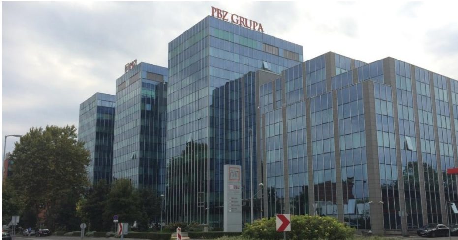
Slika 7: monumentalna poslovna zgrada – sjedište Privredne banke Zagreb

Financijska industrija dominira obnovljenom jugozapadnom stranom Radničke ceste, ovdje su se smjestile sve vodeće banke koje posluju u Hrvatskoj. Ako nemaju ovdje svoje središte imaju barem poslovnicu.