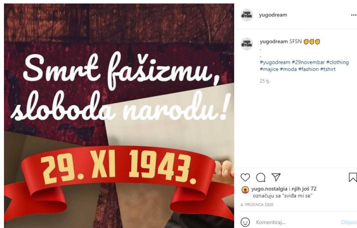
Slika 9.: SFSN

nosi parolu, na primjer, smrt fašizmu, sloboda narodu, odašiljati poruku i ideologiju koju zastupa, no same objave brenda i njihova promidžba na Instagramu nemaju edukativni element ili priču kao što je slučaj kod brenda Manonija.