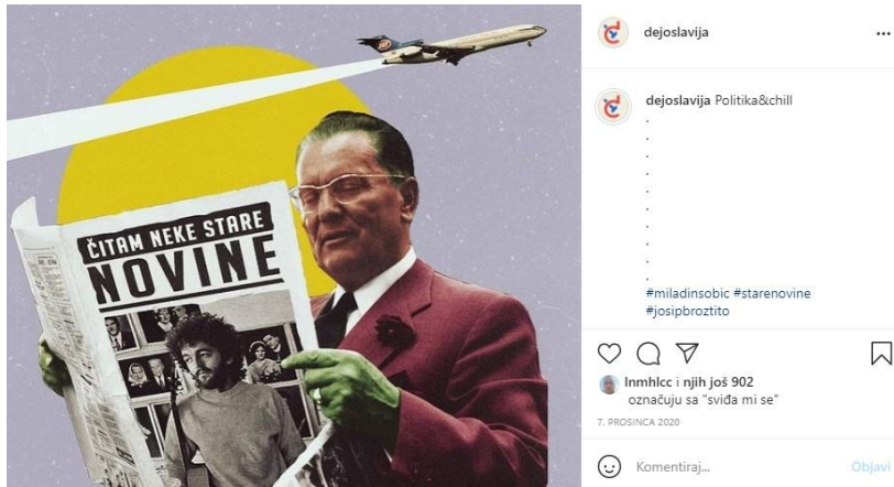
Slika 3: Čitam neke stare novine

Slika iznad prikazuje fotokolaž Josipa Broza Tita koji čita novine s naslovom istoimene pjesme popularnog („u ono doba“) kantautora Miladina Šobića čija je slava ponovno zaživjela u sadašnjem trenutku, nekoliko desetaka godina nakon. Na taj način autor se poigrava s likom Tita i ulogom popularne kulture, konkretno glazbe koja je i dan danas jedan od najpopularnijih oblika jugonostalgije na području ex-Yu država. Naziv fotografije – „Politika&Chill“ igra je s popularnim konceptom „Netflix&Chill“, a koji se odnosi na suvremeni način opuštanja i provođenja slobodnog vremena uz streaming platformu Netflix. Ovakvo aludiranje na popularnu kulturu ukazuje nam kako je implicirana publika profila dejoslavija i Gen Z koja odrasta uz Netflix. Ipak, ne smijemo smetnuti s uma kako je u Hrvatskoj i Gen X digitalna medijska generacija koja ima iskustvo života u Jugoslaviji i osobno sjećanje na nju. Ovaj primjer može poslužiti i kao svojevrsna kritika „Netflix&Chill“ načina provođenja vremena i konzumiranja Netflixova sadržaja, s obzirom na to da je upravo spomenuta platforma često kritizirana u javnosti zbog načina na koji se prikupljaju podaci korisnika u svrhu usavršavanja njegova algoritma za preporuke sličnog sadržaja.