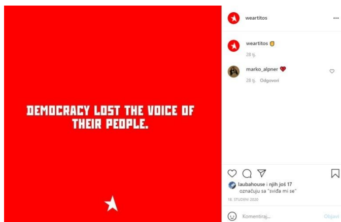
Slika 7.: Wear Titos

brend posvećen „zakletvom radničkoj naciji“. S obzirom na opis, mogli bismo tek pretpostaviti kako je implicirana publika, ne Gen Z, već Gen X iliti posljednja generacija pionira koju Popović istražuje, a odnosi se na generaciju koja je živjela u bivšoj Jugoslaviji i ima osobno sjećanje na nju. Na dan 03. lipnja 2021. godine njihov Instagram profil prati 1 103 korisnika, a sveukupno je 360 objava. Zaštitni znak brenda je crvena petokraka kojoj nedostaje druga polovica, koja iz perspektive kritičke analize diskursa simbolizira Jugoslaviju koje više nema, ali je svejedno, polovično, i dalje živa. Na Instagram „feedu“, odnosno sadržaju profila izmjenjuju se, ironično, poruke antikapitalizma i proizvodi koje brend prodaje, uglavnom majice za žene i muškarce. Za vrijeme istraživanja brend nije ni na koji način obilježio Dan Republike, ali je ranije podijeljena objava sadržaja: „Democracy lost the voice of their people.“ 11