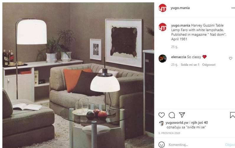
Slika 10.: Jugoslavenski interijer

bismo zaključiti kako je riječ o, potencijalno, korisnici koja se nalazi izvan prostora bivše Jugoslavije jer komentira na engleskom jeziku, a u opisu osobnog profila, koji je također javan, stoji kako je vlasnica nekolicine korisničkih računa posvećenih slavenskoj kulturi i nasljeđu, pogotovo arhitekture. Iz priloženog se da zaključiti kako su jugoslavenski proizvodi popularni, ne samo na području bivše Jugoslavije, nego i u svijetu, koji se vraća ovim proizvodima jer su prezentirani kao izrazito kvalitetni ili pak da odišu duhom „onoga vremena“. Na ovome primjeru možemo pretpostaviti kako je implicirana publika i Gen Z koja je oduševljena slikovnim zapisima tadašnje Jugoslavije ili pak Gen X i Gen Y koje imaju veću kupovnu moć da promovirane predmete zaista kupe.