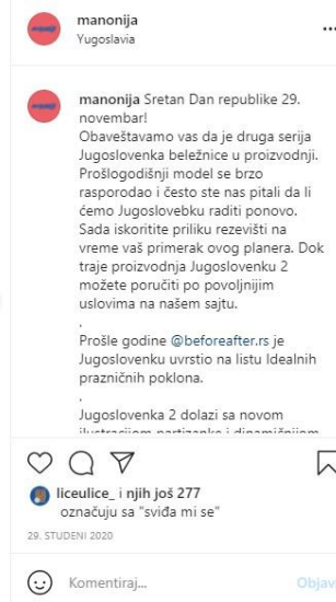
Slika 4.: Manonija - Jugoslovenka