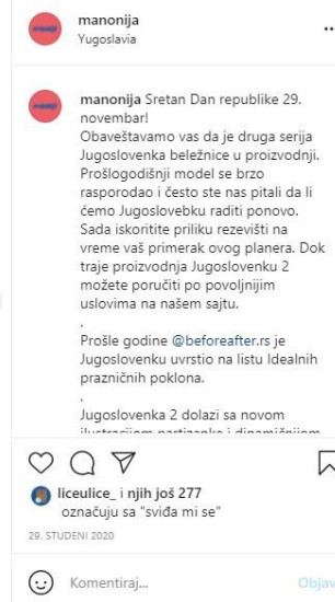
Slika 4.: Manonija - Jugoslovenka, izvor: Instagram