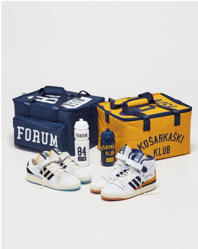
Slika 14.: Cijeli paket Adidas x Jugoplastika visokih i niskih tenisica.

„tvrtka Jugoplastika, koja danas više ne postoji, svojedobno proizvela 4.5 milijuna sportskih torbi za Adidas“ (Večernji.hr, 2020).