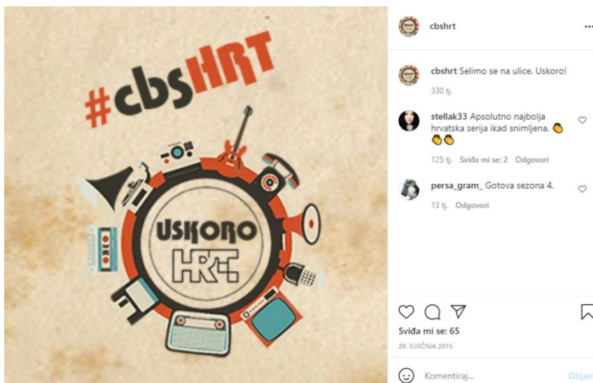
Slika 11.: Prva objavljena fotografija na Instagram profilu cbsHRT