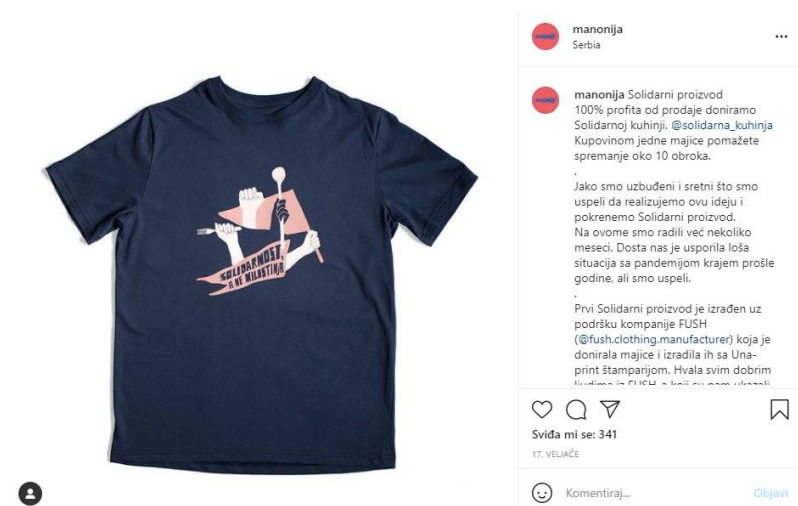
Slika 6.: Solidarnost, a ne milostinja.

Valja se osvrnuti i na novije proizvode koji su nastali nakon istraživanjem određenog vremenskog intervala, poput „hoodice“ koju krasi tri partizanke, a ispod su izvezeni stihovi Branka Miljkovića, jugoslavenskog književnika: „san je davna i zaboravljena istina koju više niko ne ume da proveriti“. Nitko, dakle, ne može više provjeriti san o Jugoslaviji, on je „davna i zaboravljena istina“, što se uklapa u prvi od dva pristupa proučavanja nostalgije koji Petrov (2007) ističe. Riječ je o percepciji nostalgije koja je nazadna i pasivna i samim time podložna komercijalizaciji. Ako više nitko ne može provjeriti tu istinu i san o Jugoslaviji, ona zaista postaje idealna ideja za monetizaciju. Također, brend svoju političku angažiranost ističe i serijom majica na kojima piše: „Solidarnost, a ne milostinja“, a nastala je na način da sav prihod od prodanih majica ide srpskom nezavisnom kolektivu Solidarna kuhinja koji: „obezbeđuje kuvane obroke i druge namirnice ugroženim sugrađanima“ (Solidarna kuhinja, 2020).