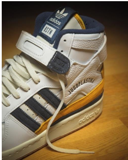
Slika 13.: Adidas x Jugoplastika tenisice, visoki model.

„Adidas je u suradnji s njemačkim BSTN Storeom izbacio niske i visoke tenisice u limitiranom izdanju. Odlučili su odati počast Jugoplastici kao nositelju kvalitete Europske košarke krajem osamdesetih i početkom devedesetih godina kada su Splićani bili tri puta prvaci Europe. Kako kažu u svojoj objavi ova kolekcija slavi nepogrešivu košarkašku kulturu Balkana“ (Journal.hr, pristupljeno 16.05.2021)