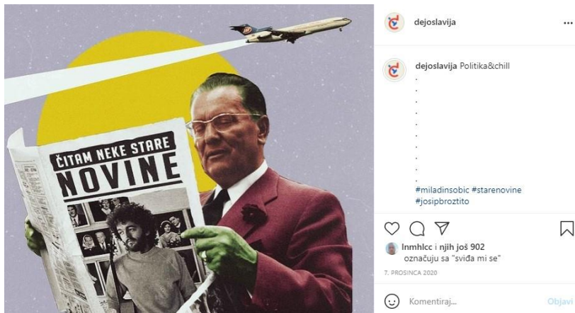
Slika 3: Čitam neke stare novine, izvor: dejoslavija, Instagram

Slika iznad prikazuje fotokolaž Josipa Broza Tita koji čita novine s naslovom istoimene pjesme popularnog („u ono doba“) kantautora Miladina Šobića čija je slava ponovno zaživjela u sadašnjem trenutku, nekoliko desetaka godina nakon. Na taj način autor se poigrava s likom Tita i ulogom popularne kulture, konkretno glazbe koja je i dan danas jedan od najpopularnijih oblika jugonostalgije na području ex-Yu država. Naziv fotografije – „Politika&Chill“ igra je s popularnim konceptom „Netflix&Chill“, a koji se odnosi na suvremeni način opuštanja i provođenja slobodnog vremena uz streaming platformu Netflix. Ovakvo aludiranje na popularnu kulturu ukazuje nam kako je implicirana publika profila dejoslavija i Gen Z koja odrasta uz Netflix. Ipak, ne smijemo smetnuti s uma kako je u Hrvatskoj i Gen X digitalna medijska generacija koja ima iskustvo života u Jugoslaviji i osobno sjećanje na nju. Ovaj primjer može poslužiti i kao svojevrsna kritika „Netflix&Chill“ načina provođenja vremena i konzumiranja Netflixova sadržaja, s obzirom na to da je upravo spomenuta platforma često kritizirana u javnosti zbog načina na koji se prikupljaju podaci korisnika u svrhu usavršavanja njegova algoritma za preporuke sličnog sadržaja.