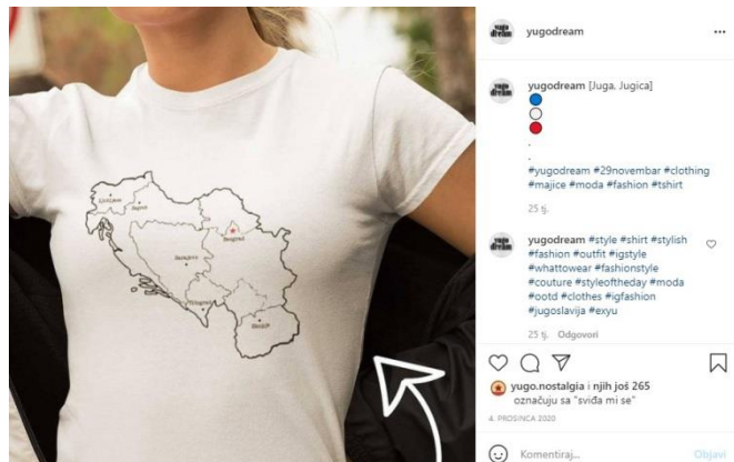
Slika 8.: Glavni gradovi republika SFRJ, izvor: Yugo Dream, Instagram

Ni Yugo Dream ne obilježava Dan Republike, ali zato ima seriju majica koja se naziva po istoimenom prazniku bivše Jugoslavije. Tako korisnici Instagrama mogu naručiti majicu s mapom bivše Jugoslavije i glavnih gradova republika koje su tvorile bivšu Jugoslaviju.