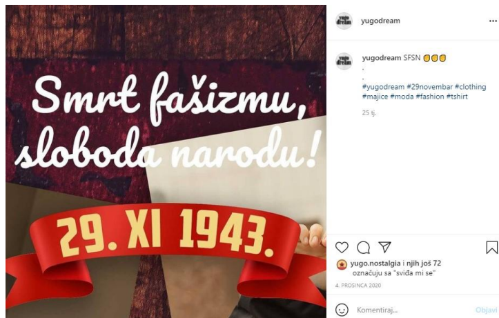
Slika 9.: SFSN

nosi parolu, na primjer, smrt fašizmu, sloboda narodu, odašiljati poruku i ideologiju koju zastupa, no same objave brenda i njihova promidžba na Instagramu nemaju edukativni element ili priču kao što je slučaj kod brenda Manonija.