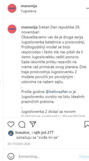
Slika 4.: Manonija - Jugoslovenka