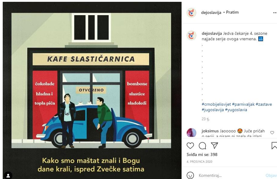
Slika 2: Scena iz serije Crno-bijeli svijet.

Slika iznad predstavlja najavu četvrte i posljednje sezone hrvatske humoristične serije Crno-bijeli svijet (CBS) koja je stekla veliku popularnost na području Hrvatske, no nije poznato je li zaživjela i u ostalim državama, nekadašnjim republikama bivše Jugoslavije. Možemo samo na tragu komentara korisnice „joksimus“ i njezinom komentaru: „Jaooooo. Juče pričah o seriji, a nisam ni znala da izlazi još“ zaključiti kako ju je pratila i srpska publika na temelju korištenih jezičnih izraza koji nam govore kako je, vjerojatno, riječ o srpskoj korisnici. O navedenoj seriji pišem u posebnom poglavlju kasnije u radu.