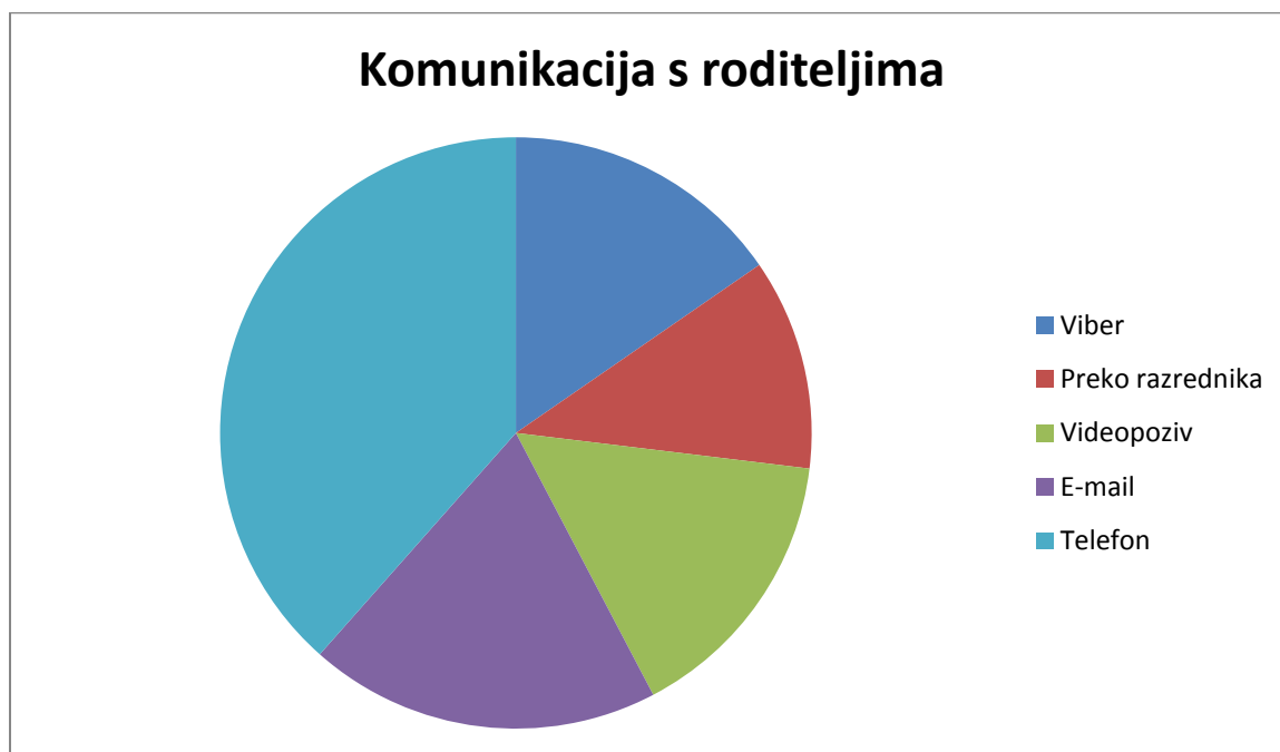
Graf 3: Komunikacija s roditeljima

pismenosti ili nepismenosti pojedinaca pa onda to bude svašta“ . Tri pristupnika intervju nisu razrednici pa su istaknuli kako su se oni s roditeljima učenika čuli preko razrednika. Graf 3 prikazuje najčešće oblike kontakata roditelja s nastavnicima.