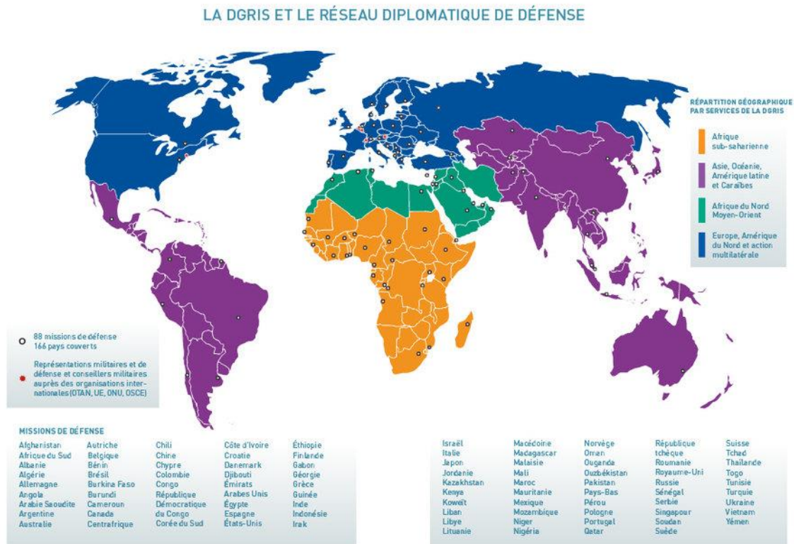
Slika 2: Vizualni prikaz misija izaslanika obrane Francuske Republike

organizacijama i institucijama uključenim u područje obrane: Organizacija Sjevernoatlantskog saveza (NATO), Europska unija (EU), Ujedinjeni narodi (UN), Organizacija za Sigurnost i suradnja u Europi (OESS), Konferencija o razoružanju, Organizacija Ugovora o sveobuhvatnoj zabrani nuklearnih pokusa (CTBTO) (In.ambafrance.org, 2022).