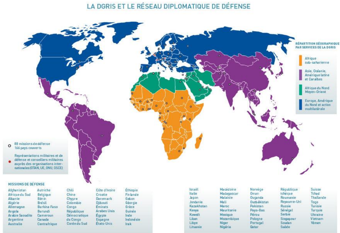
Slika 2: Vizualni prikaz misija izaslanika obrane Francuske Republike

organizacijama i institucijama uključenim u područje obrane: Organizacija Sjevernoatlantskog saveza (NATO), Europska unija (EU), Ujedinjeni narodi (UN), Organizacija za Sigurnost i suradnja u Europi (OESS), Konferencija o razoružanju, Organizacija Ugovora o sveobuhvatnoj zabrani nuklearnih pokusa (CTBTO) (In.ambafrance.org, 2022).