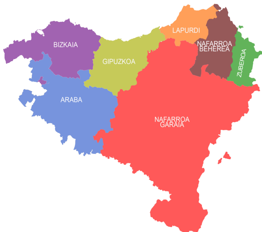
Slika 1: Euskal Herria; kompletna Pokrajina Baskija