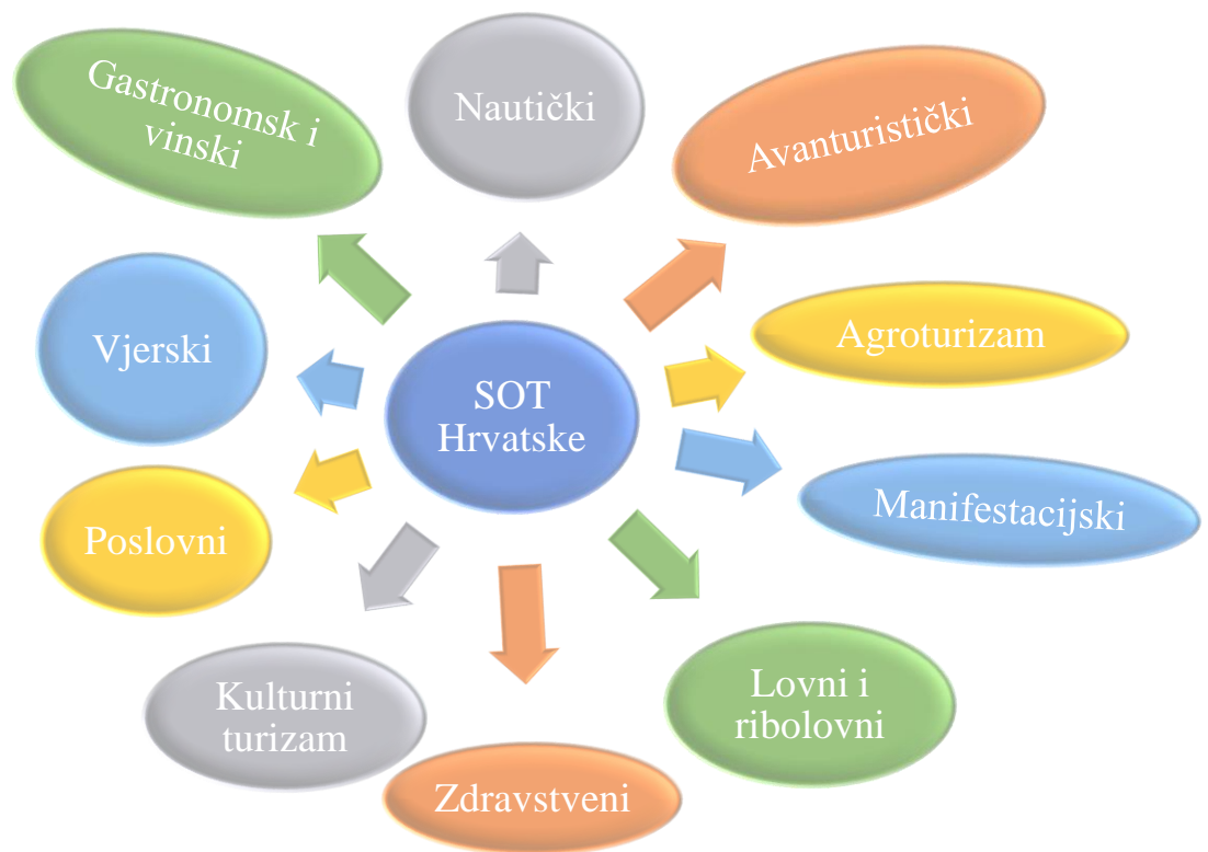
Slika 1. Neki od najvažnijih selektivnih oblika turizma u Republici Hrvatskoj