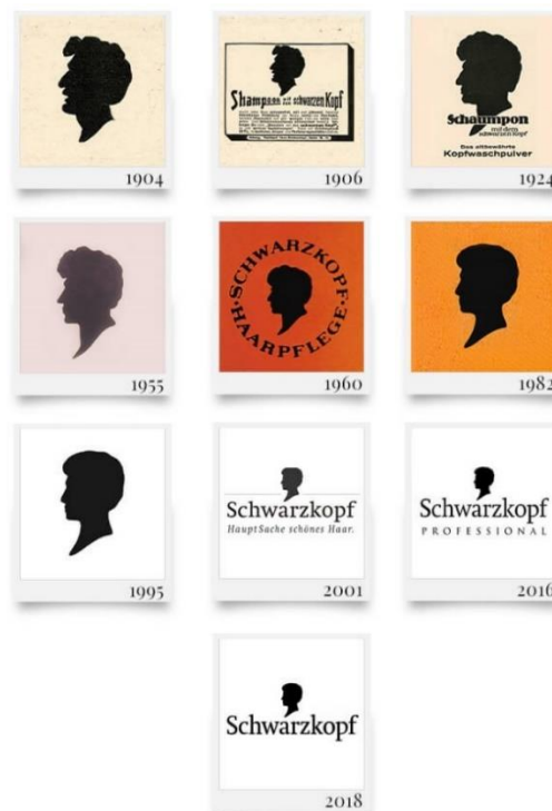
Slika 3: Razvoj logotipa brenda Schwarzkopf

Izvor: Schwarzkopf.com - https://www.schwarzkopf.com/en/home/about.html