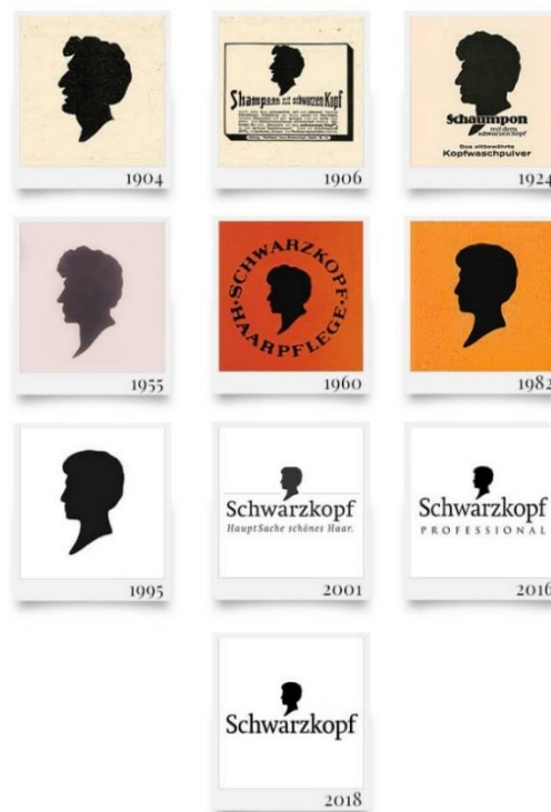
Slika 3: Razvoj logotipa brenda Schwarzkopf