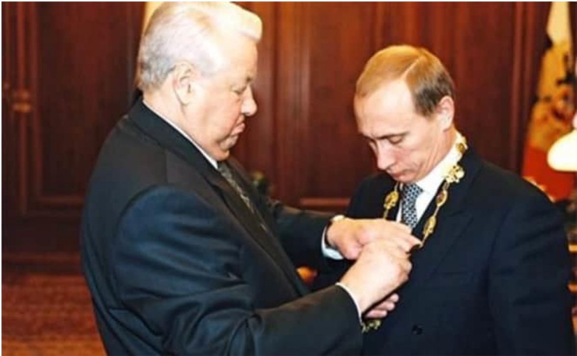
Slika 1. Boris Jeljcin i Vladimir Putin