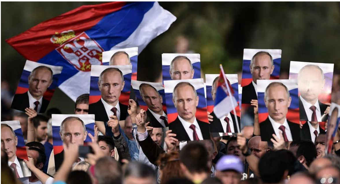
Slika 4. Podrška Putinu u Srbiji