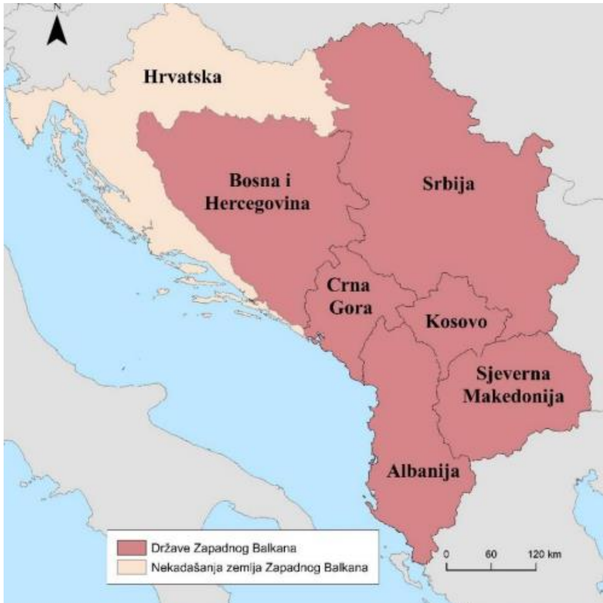
Slika 3. Područje Zapadnog Balkana