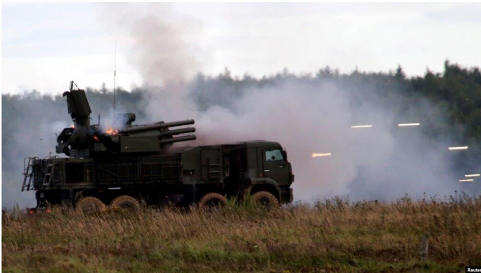
Slika 6. Vježba PZO sustav Pancir S1 u svrhu prodaje Srbiji na prijedlog Putina