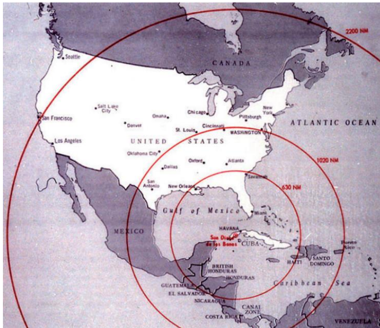
Slika 3: Domet sovjetskih projektila postavljenih na Kubi

Pozitivna činjenica za cijeli svijet bila je što su raketna postrojenja otkrivena dovoljno rano da SAD može ispregovarati njihovo uklanjanje bez upotrebe sile (Weaver, 2014).