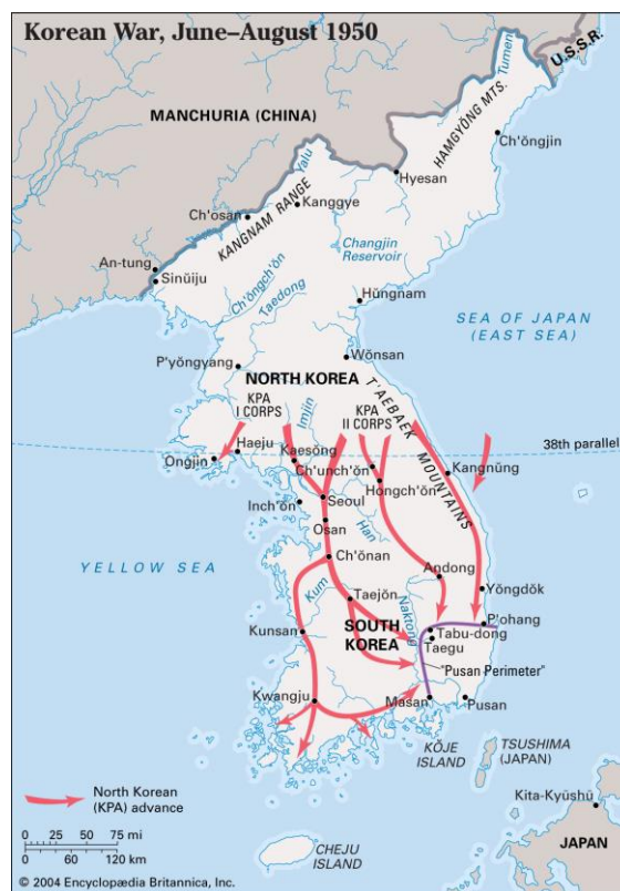
Slika 2: Kretanje sjevernokorejskih snaga prema Južnoj Koreji

Već 1952. godine SAD su otišle korak dalje i testirale novu hidrogenu bombu na Maršalovim otocima pored Havaja. Odgovor SSSR-a se čekao osam godina te je 1960. Sovjetski Savez objavio da je konstruirao najveće nuklearno oružje ikad - hidrogenu bombu, koju su i testirali godinu kasnije. Jedan od sukoba koji su obilježili hladnoratovsko razdoblje bio je Korejski rat koji je trajao od 1950. do 1953. godine, a ujedno je bio i prvi vojni sukob u Hladnom ratu. Unatoč tome što se odvijao na relaciji Sjeverna Koreja i komunistički režim - Južna Koreja i kapitalističko društvo, ubrzo je postalo jasno da je ovaj sukob zapravo između SSSR-a i Kine na strani Sjeverne i SAD-a i saveznika na strani Južne Koreje, a svemu je kumovala i Trumanova doktrina: nakon što su sjevernokorejski vojnici ušli u prostor Južne Koreje s namjerom ujedinjenja dviju Koreja i širenja komunizma, aktivirala se Amerika koja se doktrinom obvezala da će se aktivno boriti protiv širenja komunizma bilo gdje u svijetu.