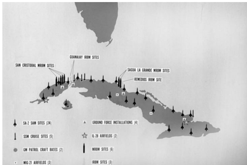
Slika 4: Pozicije sovjetskih projektila na Kubi

Naposljetku je odlučeno kako je druga opcija bolji izbor, kako za SAD, tako i za globalnu sigurnost. Ipak je postojala svijest o tome da SAD nije jedini koji posjeduje nuklearno naoružanje i o potencijalnoj katastrofi svjetskih razmjera koju bi mogla pokrenuti prva opcija američkog odgovora na krizu. Tako je odluka pala na pomorsku blokadu (poznatu i kao “karantena”) Kube u kombinaciji s diplomatskim pregovorima i prijetnjom vojnom akcijom. Kako bi se osigurala legalnost ovog američkog poteza, osim izmjene termina “blokada” u “karantena 6 ”, Kennedy i njegovi dužnosnici su se pobrinuli da imaju pokriće za legalnost svog poteza u člancima šest 7 i osam 8 Rio pakta te potporu i suglasnost Organizacije američkih država (OAS) (Weaver, 2014).