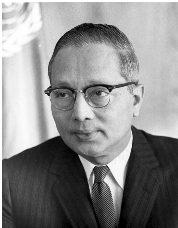
Slika 5: U Thant: Glavni tajnik Ujedinjenih Naroda od 1961. do 1972. godine

Postoje hipoteze o tome da je kroz Kubansku krizu Sovjetski Savez postigao veliku većinu, ako ne i sve svoje stvarne ciljeve: micanje Kube iz interesne sfere SAD-a i uklanjanje projektila iz Turske i Italije što je bio velik strateški gubitak za NATO savez, dok upotreba raketa nikada zapravo niti nije bila u planu (Horelick, 1963). Bile one istinite ili ne, svijet je za dlaku izbjegao Treći svjetski rat, a vojna diplomacija je u tome bila jedan od glavnih alata. Zaključno, neki od vojno-diplomatskih poteza tadašnjih kreatora politika koji su utabali put pozitivnom ishodu bile su obavještajne akcije koje su obilježile kako Kubansku krizu, tako i čitav Hladni rat, multilateralni i bilateralni pregovori visokih vojnih dužnosnika i političara, prikrivene akcije koje su se ogledale u ideološkim propagandama obiju strana te potpisivanje sporazuma koji su obilježili završetak sukoba, što je detaljnije obrađeno u poglavlju „Uloga vojne diplomacije u rješavanju Kubanske raketne krize“.