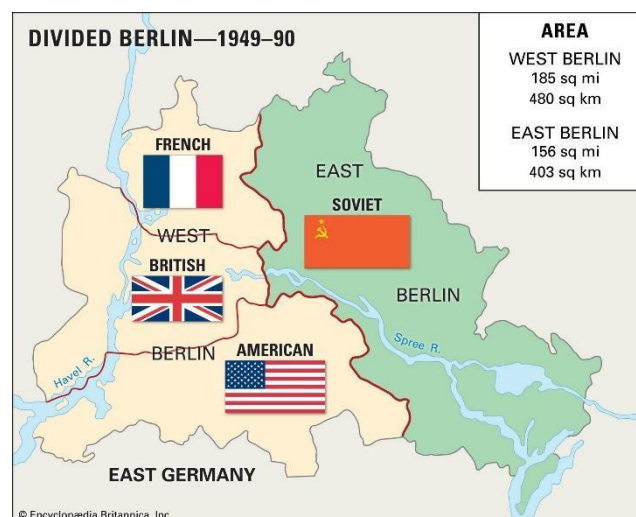
Slika 1: Podjela Berlina

Temelji Hladnog rata postavljeni su kroz događaje kojima je Drugi svjetski rat završio, a koji su dali nagovijestiti da će Hladni rat biti utrka u nuklearnom naoružanju dviju supersila. Bio je to trenutak bacanja nuklearnih bombi Little Boy i Fat Man SAD-a na japanske gradove Hiroshimu i Nagasaki 1945. godine u kombinaciji s ruskom objavom rata Japanu i općenitom razilaženju u viđenju poslijeratnog svijeta SAD-a i SSSR-a. Svijet nije slutio da će, tek što je Drugi svjetski rat završio, nastupiti novi veliki sukob, između istočnog i zapadnog bloka, od čijih će posljedica strepiti čitava međunarodna zajednica. Tri godine kasnije, u lipnju 1948. godine, u Berlinu podijeljenom na istočni i zapadni nastupila je blokada, a zatim i organizacija Berlinskog “zračnog mosta” - događaji koji su produbili napetosti između dvaju blokova i predstavljaju prvu veliku hladnoratovsku krizu. Pojam sovjetske blokade Berlina odnosio se na blokiranje svih kopnenih i vodenih puteva prema zapadnom Berlinu i uvođenje nove valute, čime je Staljin namjeravao onemogućiti stvaranje neovisne Zapadne Njemačke pod okriljem zapadnih sila te stvoriti sliku o SSSR-u kao dostojnom i neustrašivom protivniku. “Zračni most” bio je odgovor zapadnih saveznika, odnosno organizacija dostave prehrambenih i drugih potrepština u zapadni Berlin zračnim putem koja se odvijala sve do rujna 1949. godine. Podjela Berlina kulminirala je 1961. godine izgradnjom Berlinskog zida (Holloway, D. U: Leffler, Painter, 2005).