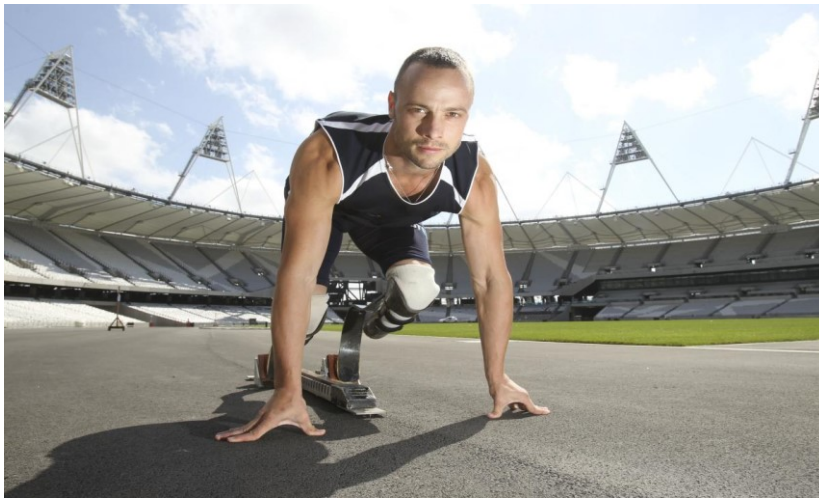
Slika 7: Oscar Pistorius