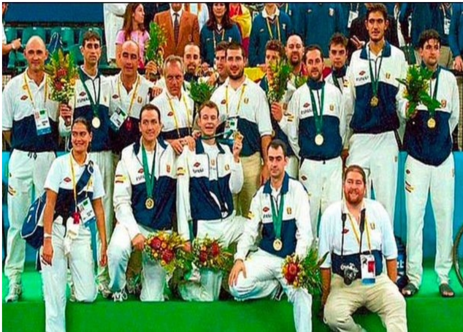
Slika 6: Španjolski košarkaški tim s intelektualnim poteškoćama