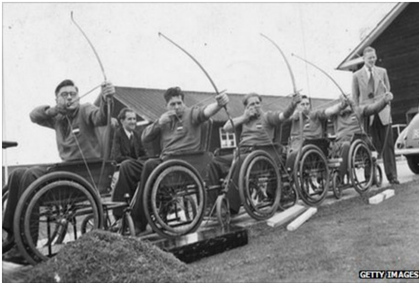
Slika 1: Nizozemski tim na Igrama Stoke Mandeville