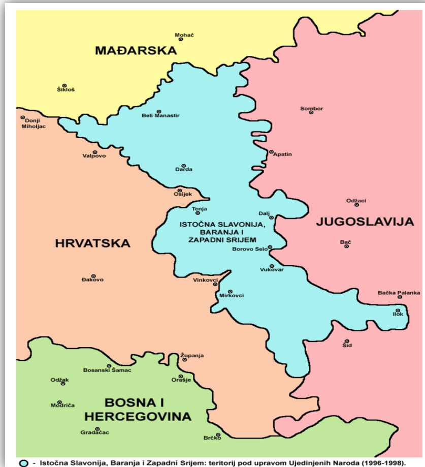
Slika 3: Područje hrvatskog Podunavlja (istočna Slavonija, Baranja i zapadni Srijem)