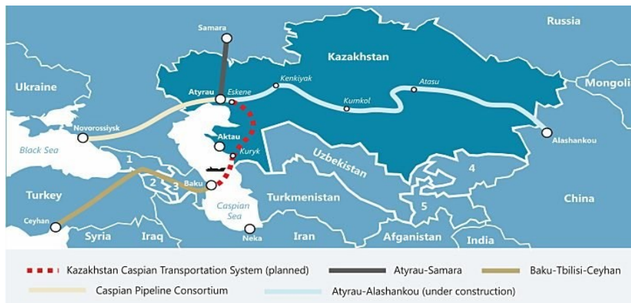
Slika 4. Geografski položaj naftovoda Tengiz, Kashagan i Karachaganak