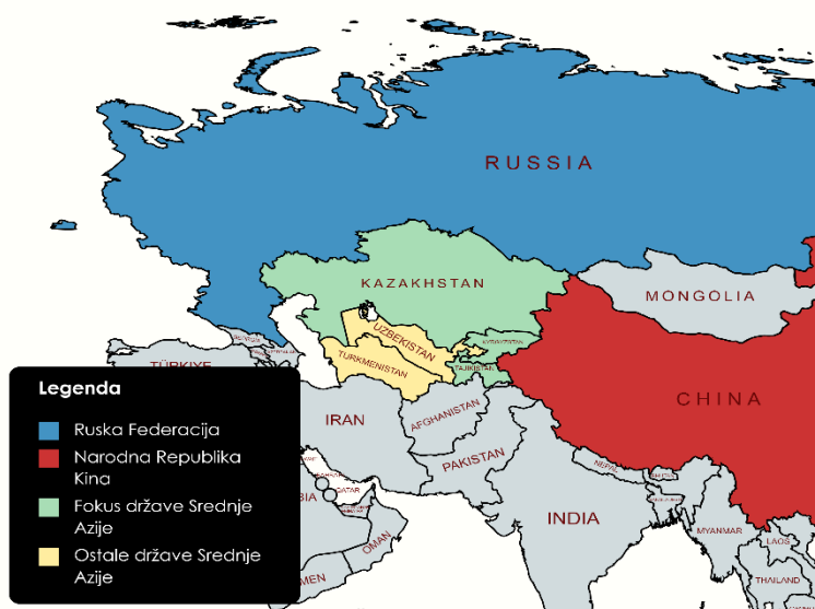
Slika 1. Regija Srednje Azije i utjecajno susjedstvo