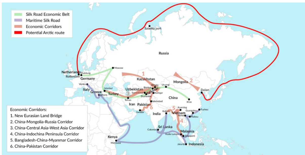
Slika 5. Ekonomsko-tranzicijski koridori Inicijative pojasa i puta (BRI)

će iskrčan prije Duisburga ili u Duisburgu. Kraći transport robe ubrzao bi priljev profita kazahstanskog izvoza koji nužno ne uključuje prirodne resurse. Koridori „Kina-Srednja Azija-Zapadna Azija“ (CCWAEC) i planirani arktički pravac mogli bi imati znatne implikacije u budućnosti kinesko-ruskih odnosa. Naime prvi koridor „Kina-Srednja Azija-Zapadna Azija“ (slika 5.) zaobilazi teritorij RF-a u potpunosti (Harutyunyan, 2022: 11). CCWAEC željezničkom rutom povezuje sve države Srednje Azije s Turskom na Mediteranu i s državama arapskog poluotoka. Drugi pravac ne zaobilazi RF ali prolazi kroz slabo dostupna ruska istočna i sjeverna područja zaobilazeći najnaseljeniji zapadni europski dio RF-a. Iz navedenoga bi se moglo odrediti kako Kina postepeno nastoji privući Kazahstan bliže sebi i kako RF ne predstavlja jednu od bitnijih sastavnica BRI inicijative. Međutim, kineska vizija Kazahstana kao nezaobilaznog partnera puno je veća od navedenog.