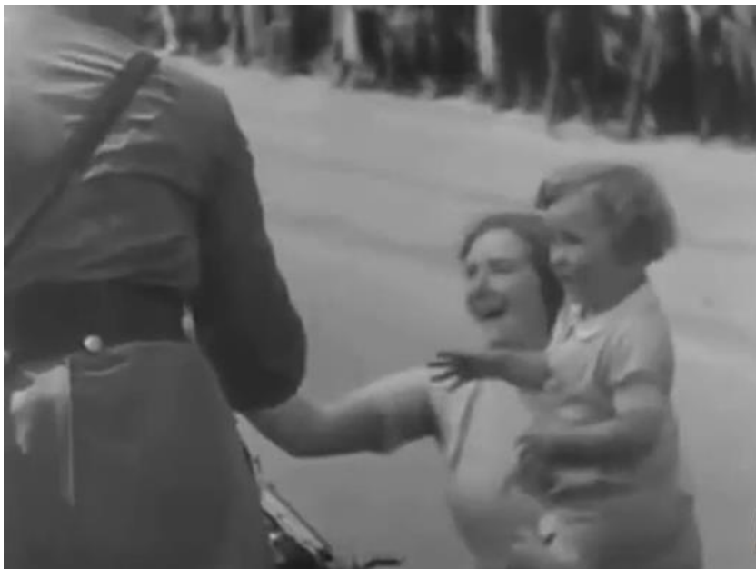
Slika 4. Ovacije iz publike, a jedna od poruka scene može biti: Hitler je obožavan, poželjan i slavjen od strane mlađih i starijih naraštaja.

Film ima dvije razine sadržaja filma: manifestnu i latentnu. Na manifestnoj se prikazuju zbivanja u filmu i političke poruke koje film zastupa a na latentnoj se opisuje način na koji se poruke prenose točnije filmski jezik kojim se nastoji „očarati publiku“. Cijela radnja može se podijeliti na četiri cjeline: večer uoči kongresa kad se pokazuje mjesto radnje i prati dolazak Hitlera, prvi dan vrijeme otvaranja i nastup radnih odreda koji završava noćnim skupom, drugi dan kada nastupa Hitlerova mladež, te svršava mimohodom odreda SA i SS-a. Sve završava Hitlerovim govorom (Cipek, 2009:104).