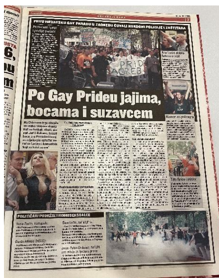
Slika 8. Jutarnji list 30. lipnja 2002. godine