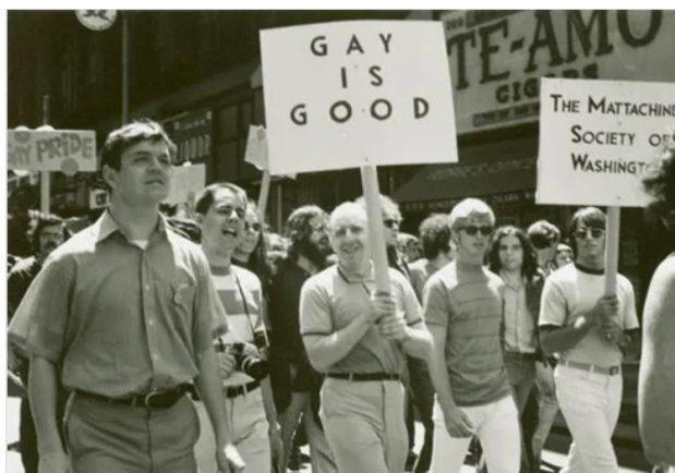
Slika 1. Prva parada ponosa u New Yorku, 27. lipnja 1970.