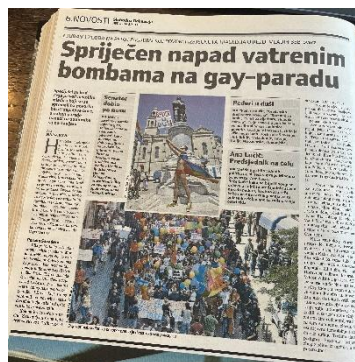
Slika 12. Slobodna Dalmacija, 8. srpnja 2007. godine