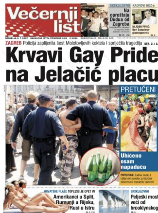
Slika 13. Naslovnica Večernjeg lista, 8. srpnja 2007. godine