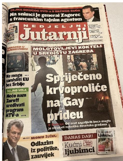
Slika 14. Naslovnica Jutarnjeg lista, 8. srpnja 2007. godine