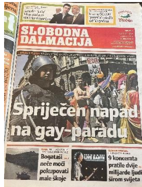
Slika 11. Slobodna Dalmacija, 8. srpnja 2007. godine