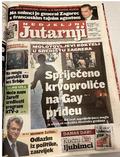
Slika 14. Naslovnica Jutarnjeg lista, 8. srpnja 2007. godine