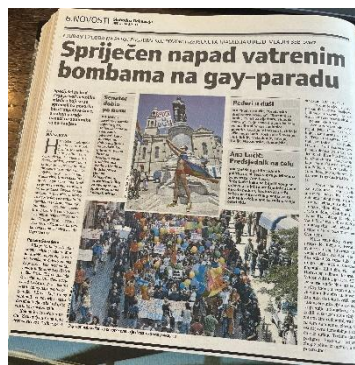
Slika 12. Slobodna Dalmacija, 8. srpnja 2007. godine