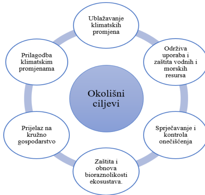
Slika 1: Okolišni ciljevi EU Taksonomije

dugoročnu štetu za okoliš, dovodi do znatnog povećanja emisija onečišćujućih tvari, šteti dobrom stanju i otpornosti ekosustava te očuvanju staništa i vrsta (v. Sliku 2 ).