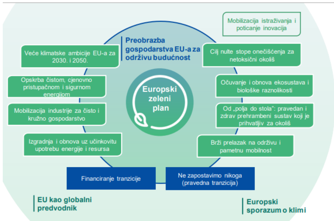
Slika 2. Ciljevi Europskog zelenog plana (COM/2019/640 final).