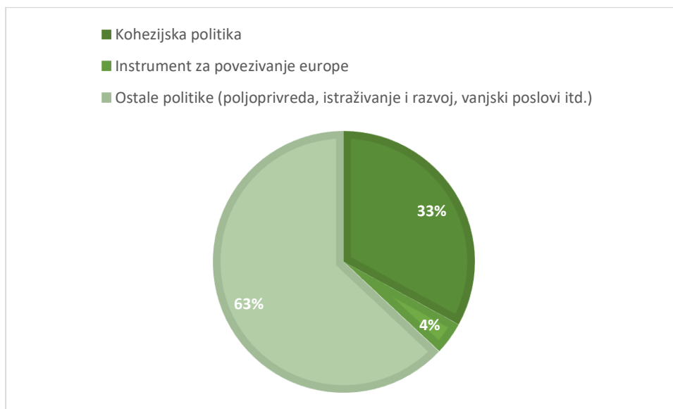
Slika 1. Udio instrumenata kohezijske politike u proračunu EU-a za razdoblje od 2014. do 2020.