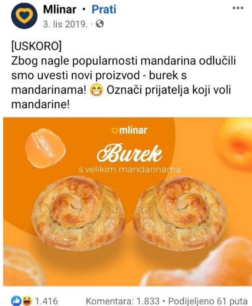
Slika 9: Primjer korištenja newsjackinga kod brenda Mlinar

U cijelu priču se uključio i Mlinar, vodeća pekarska industrija u Hrvatskoj koja je na svom Facebook profilu objavila da će uskoro u svojoj ponudi imati i burek s mandarinama (v. Sliku 9 ).