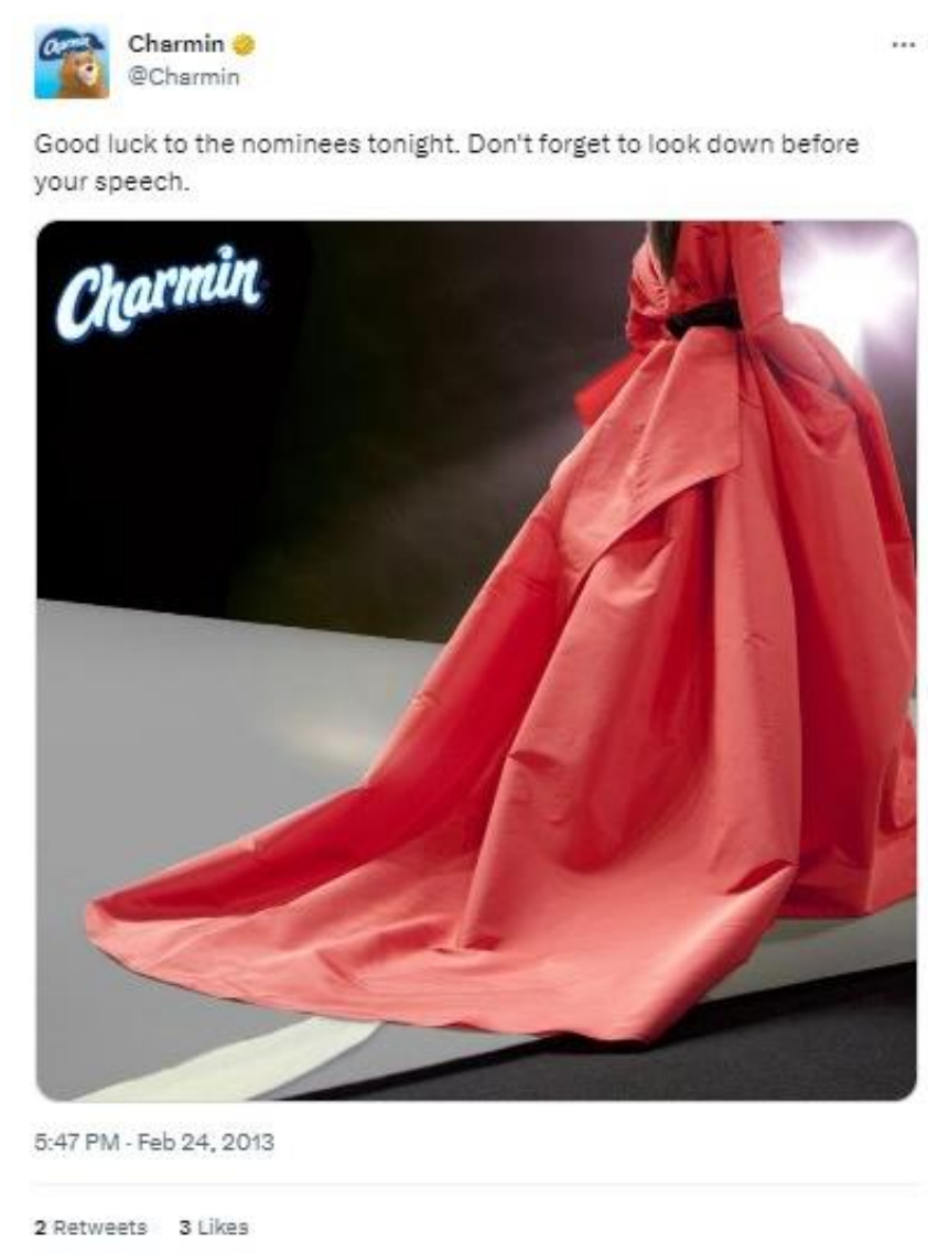
Slika 3: Primjer korištenja newsjackinga kod brenda Charmin

Uz Oakley , u svijetu se mogu naći brojni pozitivni primjeri korištenja newsjackinga . Jedan od njih je Charmin , američki brend toaletnog papira koji je dodjelu Oscara 2013. iskoristio za promoviranje svog brenda (v. Sliku 3 ). Naime, na Twitter profilu Charmin je objavio fotografiju na kojoj osoba u svečanoj crvenoj haljini za sobom vuče komad toaletnog papira, a u opisu fotografije je pisalo: „Sretno večeras nominiranima. Ne zaboravite pogledati prema dolje prije svog govora.“ U ovom slučaju newsjacking se koristio na temelju unaprijed zakazanog događaja za razliku od najčešće prakse korištenja newsjackinga koja se odvija kao reakcija na nepredvidiv događaj. Za razliku od klasičnih socioekonomskih i političkih događaja, ovdje je pop kultura poslužila kao temelj za newsjacking .