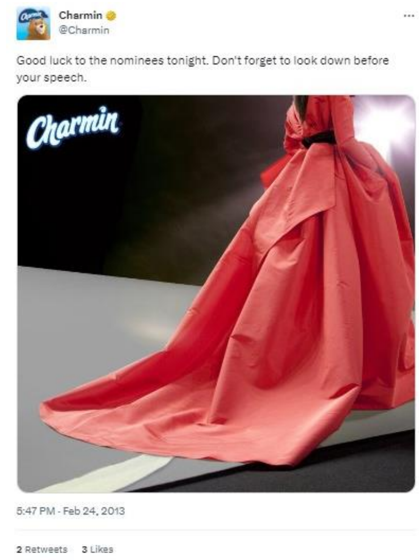
Slika 3: Primjer korištenja newsjackinga kod brenda Charmin

Uz Oakley , u svijetu se mogu naći brojni pozitivni primjeri korištenja newsjackinga . Jedan od njih je Charmin , američki brend toaletnog papira koji je dodjelu Oscara 2013. iskoristio za promoviranje svog brenda (v. Sliku 3 ). Naime, na Twitter profilu Charmin je objavio fotografiju na kojoj osoba u svečanoj crvenoj haljini za sobom vuče komad toaletnog papira, a u opisu fotografije je pisalo: „Sretno večeras nominiranima. Ne zaboravite pogledati prema dolje prije svog govora.“ U ovom slučaju newsjacking se koristio na temelju unaprijed zakazanog događaja za razliku od najčešće prakse korištenja newsjackinga koja se odvija kao reakcija na nepredvidiv događaj. Za razliku od klasičnih socioekonomskih i političkih događaja, ovdje je pop kultura poslužila kao temelj za newsjacking .