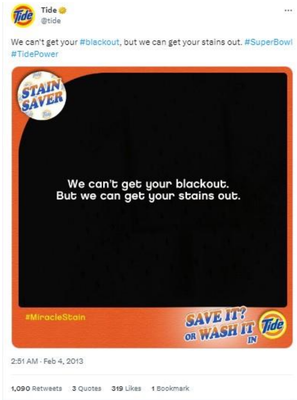
Slika 4: Primjer korištenja newsjackinga kod brenda Tide

Drugi primjer je Tweet objava američkog brenda deterdženta za pranje rublja Tide koji je iskoristio nestanak struje na stadionu na kojem se igrao Super Bowl 3 u veljači 2013. godine za vlastitu promociju. Nestanak struje doveo je do potpunog zamračenja stadiona na 34 minute, a događaj je upamćen kao Super Bowl Blackout . Tweet objava spomenutog brenda glasila je: „Ne možemo ukloniti vaš #blackout, ali možemo ukloniti vaše mrlje“ (v. Sliku 4 ).