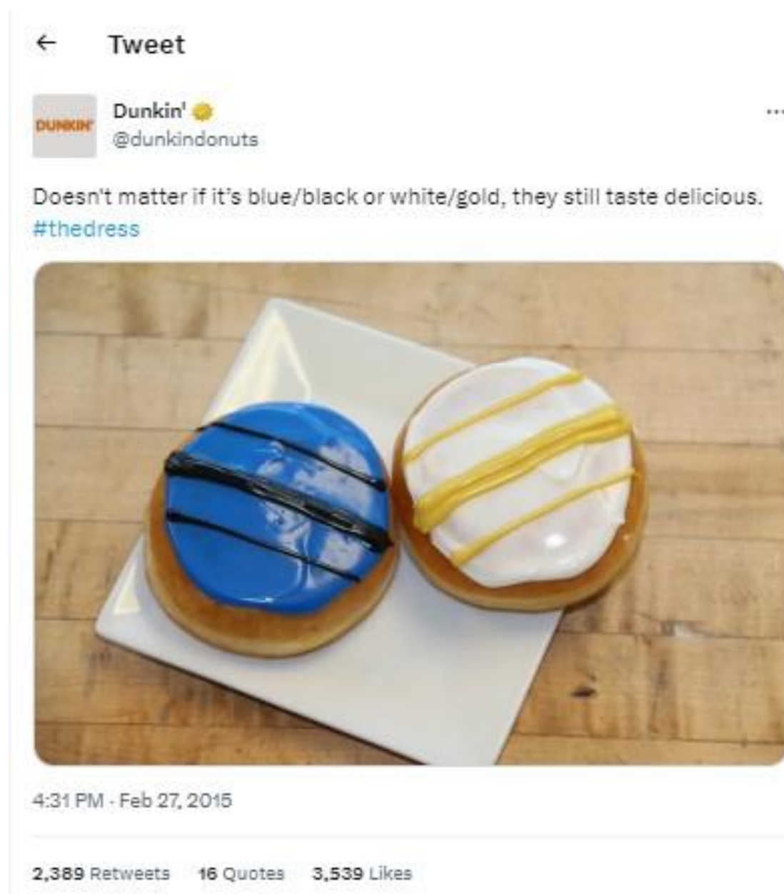
Slika 5: Primjer korištenja newsjackinga kod brenda Dunkin Donuts

Još jedan pozitivni primjer korištenja newsjackinga je primjer američkog brenda kave i krafni Dunkin Donuts koji je viralnu fotografiju zlatno-bijele, odnosno plavo-crne haljine iz 2015. iskoristio za promociju svojih proizvoda. Prvo je potrebno objasniti kontekst u kojem je fotografija nastala. Naime, na Tumblr , kao i ostalim društvenim mrežama odvijala se rasprava o boji haljine jer su je neki pratitelji vidjeli zlatno-bijelom, a neki plavo-crnom. Stvarna boja haljine za Dunkin Donuts nije predstavljala problem, budući da je raspravu okrenula u svoju korist. Na svom Twitter profilu Dunkin Donuts je objavio fotografiju (v. Sliku 5 ) dviju krafni s plavo-crnim i bijelo-zlatnim preljevom iznad koje je pisalo: „Nije bitno jesu li plavo/crne ili bijelo/zlatne, i dalje su ukusne“.