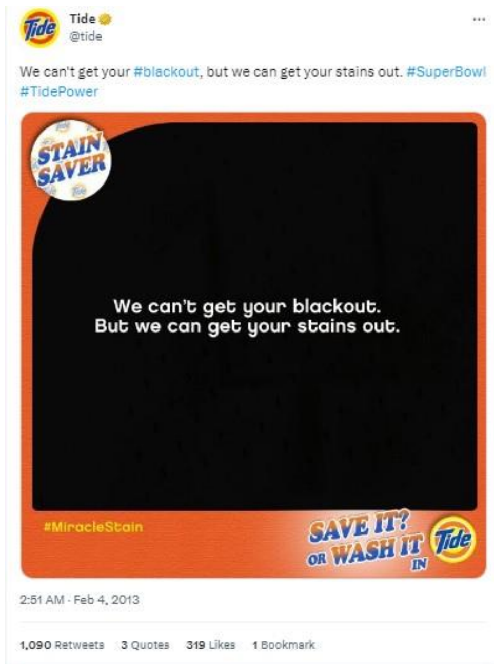
Slika 4: Primjer korištenja newsjackinga kod brenda Tide

Drugi primjer je Tweet objava američkog brenda deterdženta za pranje rublja Tide koji je iskoristio nestanak struje na stadionu na kojem se igrao Super Bowl 3 u veljači 2013. godine za vlastitu promociju. Nestanak struje doveo je do potpunog zamračenja stadiona na 34 minute, a događaj je upamćen kao Super Bowl Blackout . Tweet objava spomenutog brenda glasila je: „Ne možemo ukloniti vaš #blackout, ali možemo ukloniti vaše mrlje“ (v. Sliku 4 ).