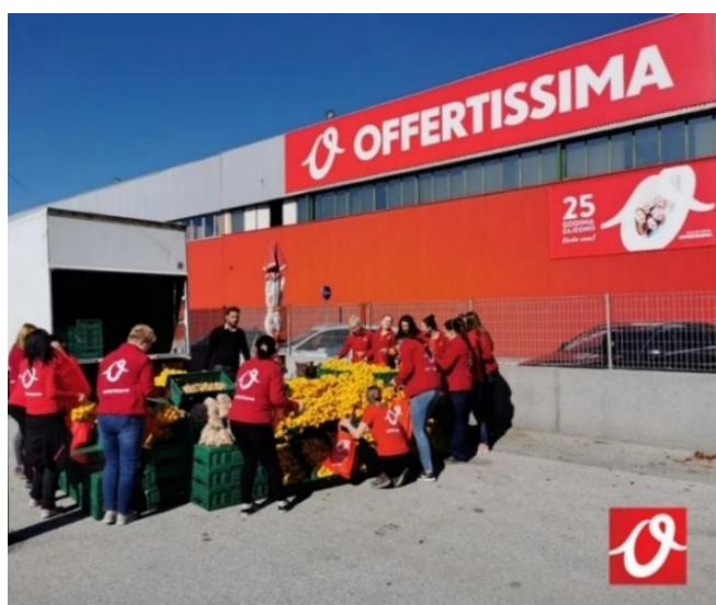
Slika 8: Primjer korištenja newsjackinga kod brenda Offertissima

U Hrvatskoj se tek malo brendova služilo ovom tehnikom, a primjeri iz medija svjedoče da su se tek Offertissima, Mlinar i Husqvarna koristili time. U listopadu 2019. godine hrvatskim medijima se proširila vijest o Kristini Mandarini. Djevojka pravog imena Kristina Penava je u mjestu Bestovje u Zagrebačkoj županiji prodavala mandarine na štandu, a u medijima je postala poznata zahvaljujući objavljivanju fotografija na svojim društvenim mrežama kojima je pozivala ljude da kod nje dođu kupiti domaće proizvode. Nedugo nakon toga, u Facebook grupi „Gajnice – jučer, danas, sutra“ je objavljena fotografija muškarca koji je također prodavao mandarine, no u blizini trgovine Offertissima 4 , a muškarac je dobio i nadimak 'gospodin Mandarinko'. S pričom je nastavila i sama Offertissima koja je na svom Facebook profilu objavila fotografiju svojih prodavačica koje muškarcu pomažu složiti mandarine ispred trgovine uz opis „Po najbolje mandarine kod gospodina Mandarinka, a po sve ostalo u Offertissimu! Označi prijateljicu koju vodiš u shopping“ (v. Sliku 8 ).