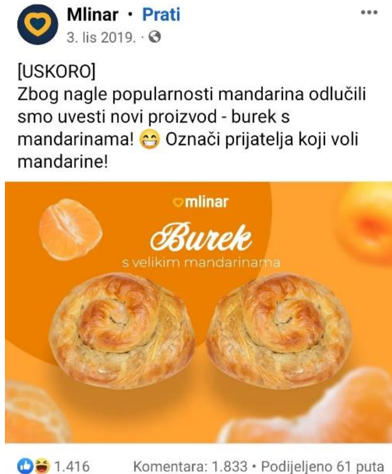
Slika 9: Primjer korištenja newsjackinga kod brenda Mlinar

U cijelu priču se uključio i Mlinar, vodeća pekarska industrija u Hrvatskoj koja je na svom Facebook profilu objavila da će uskoro u svojoj ponudi imati i burek s mandarinama (v. Sliku 9).