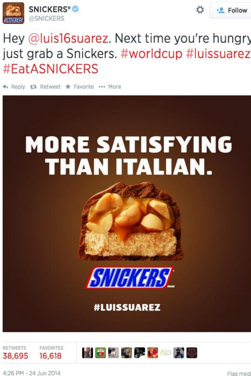
Slika 6: Primjer korištenja newsjackinga kod brenda Snickers, Izvor: Twitter

Urugvajski nogometaš Luis Suárez je svojedobno bio poznat po ugrizima protivničkih igrača. Tako je u utakmici Urugvaja i Italije na Svjetskom nogometnom prvenstvu 2014. godine Suárez za rame ugrizao talijanskog igrača Giorgija Chiellinija. Američki brend čokoladica Snickers dugi niz godina prati slogan „Kad si gladan, nisi svoj“ pa je tako ovom prilikom Suárezov ugriz iskoristio za promociju svog brenda (v. Sliku 6).