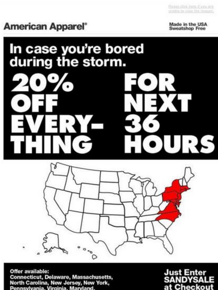
Slika 7: Primjer korištenja newsjackinga kod brenda American Apparel

kojem su se dijeli uzorci baterija za pogođeno stanovništvo. Osim baterija, kamion naziva Rapid Responder je bio opremljen i punionicama za pametne telefone pa su građani besplatno mogli napuniti svoje uređaje. Ovaj čin je Duracellu donio pozitivan imidž i porast profita. S druge strane, trgovina odjećom American Apparel je nudila 20% popusta na svoju kolekciju odjeće za sve stradale u uraganu. Apparel je to učinio tako što je, netom prije nego li je uragan razorio sjeveroistočnu i srednjoatlantsku regiju, korisnicima koji se nalaze na području kojima je harao uragan slao mail poruku: „U slučaju da vam je dosadno tijekom oluje, 20% popusta na sve u idućih 36 sati“ (v. Sliku 7 ). Na dnu poruke stajalo je da je ponuda dostupna u idućim područjima: Connecticut, Delaware, Massachusetts, North Carolina, New Jersey, New York, Pennsylvania, Virginia, Maryland.