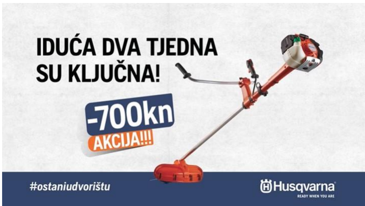
Slika 10: Primjer korištenja newsjackinga kod brenda Husqvarna

U svibnju 2020.godine kada je vladala pandemija koronavirusa, švedski brend motornih pila i kosilica Husqvarna je odlučila iskoristiti tada aktualnu uzrečicu Nacionalnog stožera civilne zaštite „iduća dva tjedna su ključna“ u promotivne svrhe svog brenda na području Hrvatske. Husqvarna je to učinila tako što je na promotivnim plakatima uzrečicu iskoristila kao najavu za popust od 700kn na jedan od proizvoda, a na dnu reklame stajao je i hashtag #ostaniudvorištu pritom aludirajući na poznati hashtag #ostanidoma (v. Sliku 10).