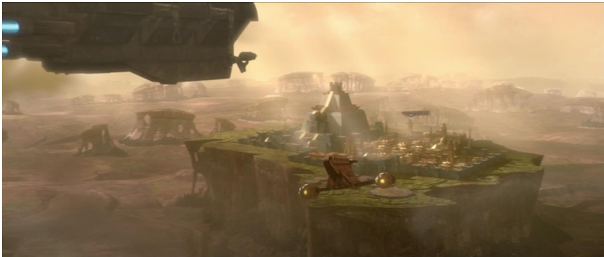
Slika 1: Planet Zygerria