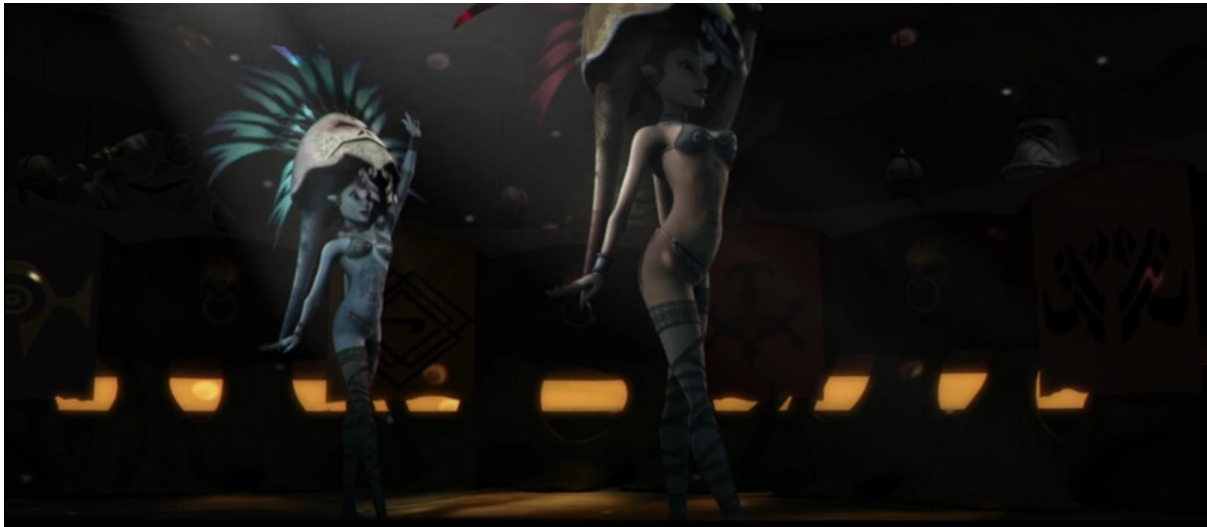
Slika 7: Razodjevene plesačice koje plešu pred Vijećem Hutta