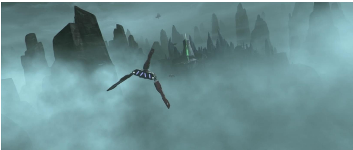
Slika 4: Planet Oba Diah