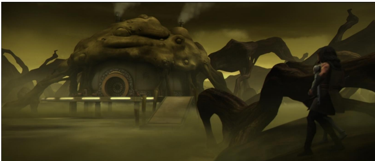
Slika 6: Planet Nal Hutta