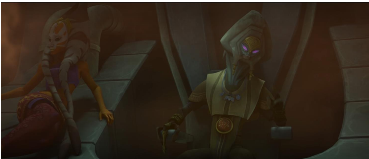
Slika 5: Lom Pyke u svojoj utvrđi okružen dimom spicea