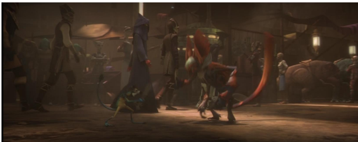
Slika 2: Zygerrian tržnica kojom glavni protagonisti prolaze na početku epizode