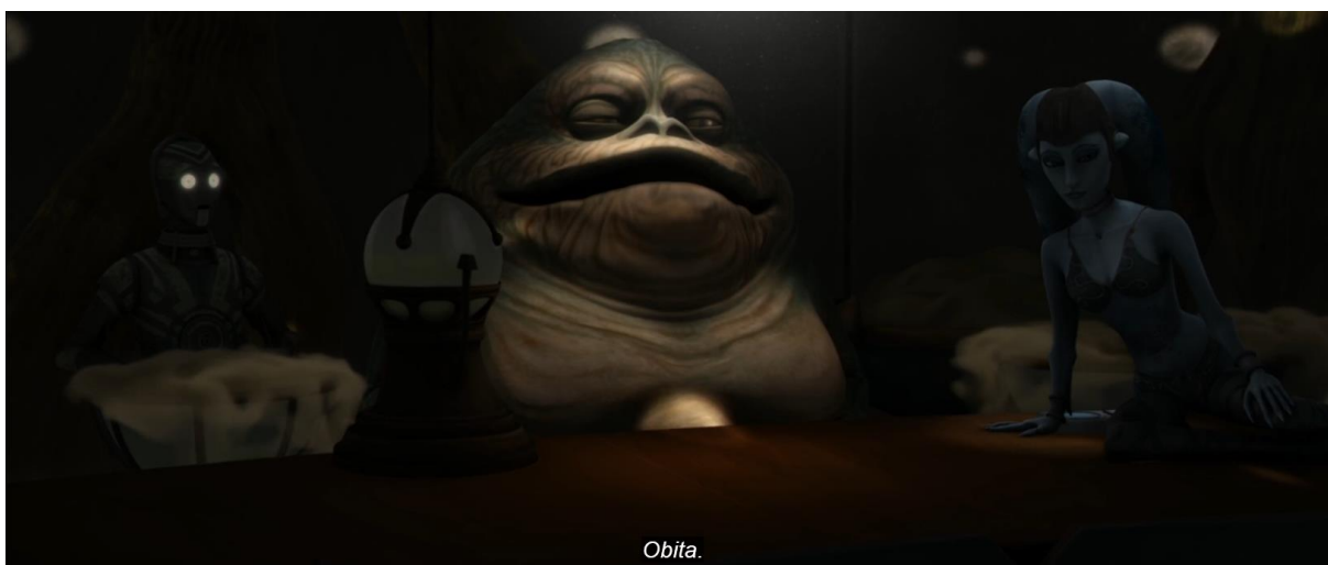
Slika 8: Jedan od pripadnika Vijeća Hutt u razgovoru s Obi-Wan Kenobijem

U epizodi razodjevene plesačice isključivo služe kao zanimacija za Hutte koji su članovi vijeća. Primjećujemo da i nose maske koje prikazuju lica Hutta povrh glave što indicira samobitnost samih Hutta.