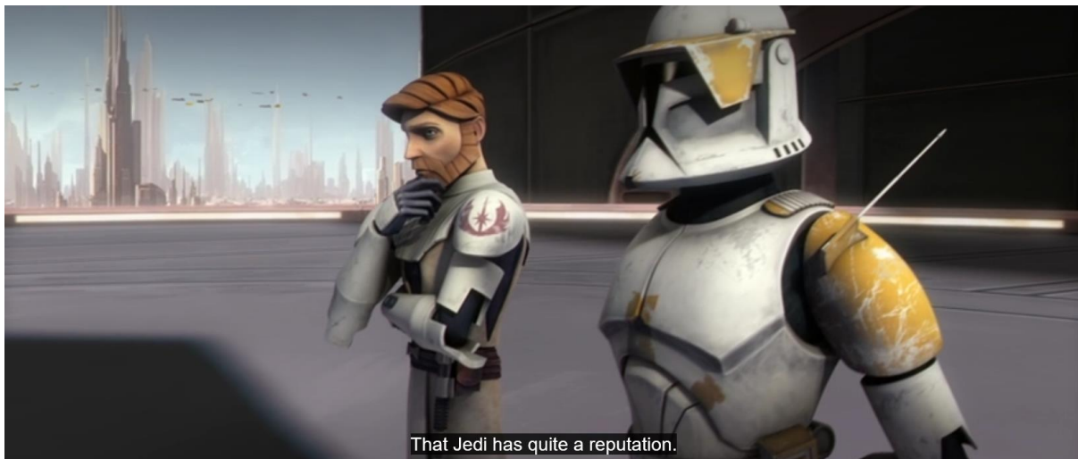
Slika 11: Obi-Wan u razgovoru s klonom Codyjem na planetu Corusant