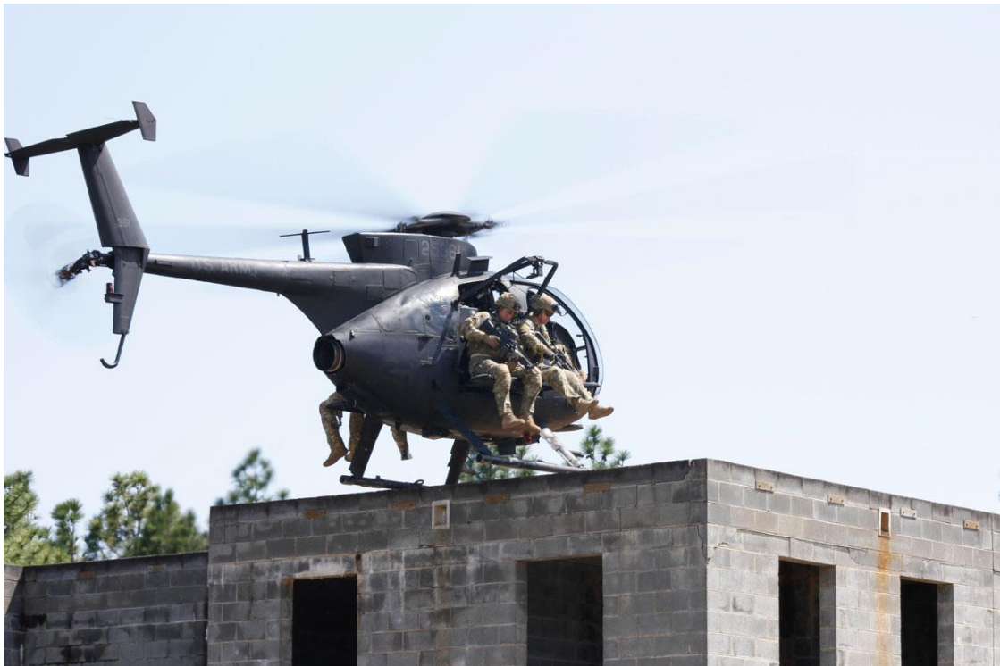
Slika 5. MH-6 Little bird

Naoružanje i oprema - iako primarno dizajniran za prijevoz vojnika, MH-6 može biti opremljen s raznim vrstama naoružanja za samozaštitu ili podršku tijekom specijalnih operacija.