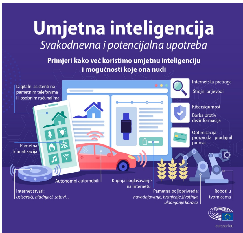
Slika 1 Primjena umjetne inteligencije

Slijedi Slika 1 koja prikazuje svakodnevnu primjenu umjetne inteligencije.