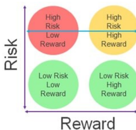
Slika 2. Matrica rizika i nagrada.

skriva ništa ilegalno. Međutim, paralelno se postavlja pitanje – je li to zaista opravdan, ispravan način?