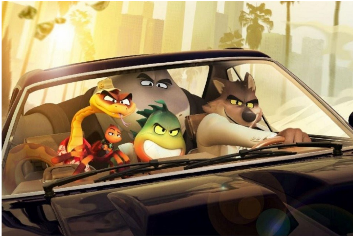
Slika 9.: Glavni likovi u filmu Loši momci