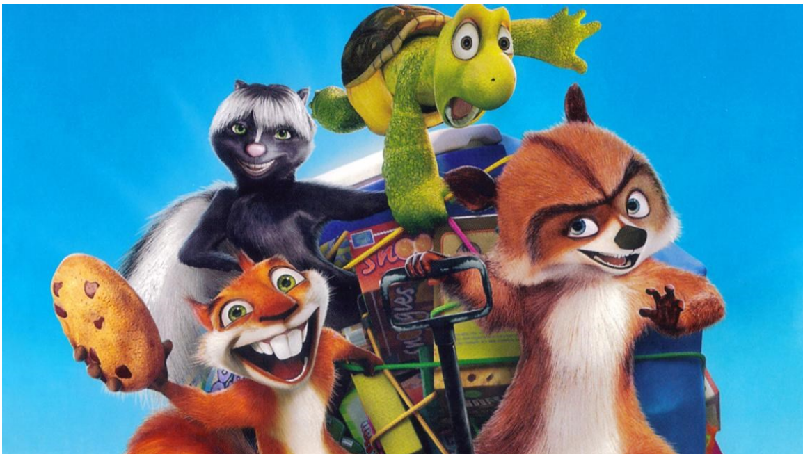
Slika 4.: Glavni likovi u filmu Preko ograde