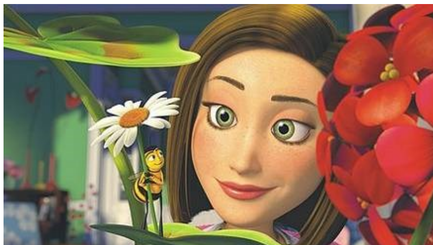
Slika 5.: Barry B. Benson i Vanessa Bloome