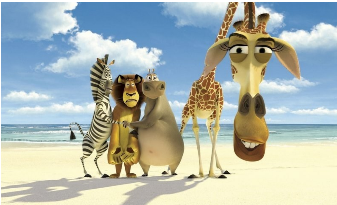
Slika 3.: Glavni likovi u filmu Madagaskar