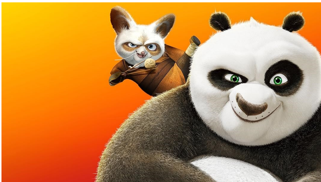
Slika 6.: Po i majstor Shifu

Tai Lung, kojeg je također trenirao Shifu, ali je s vremenom odabrao stranu zla, uspije pobjeći iz zatvora i sada je na Pou da ga zaustavi i spasi sve sugrađane.