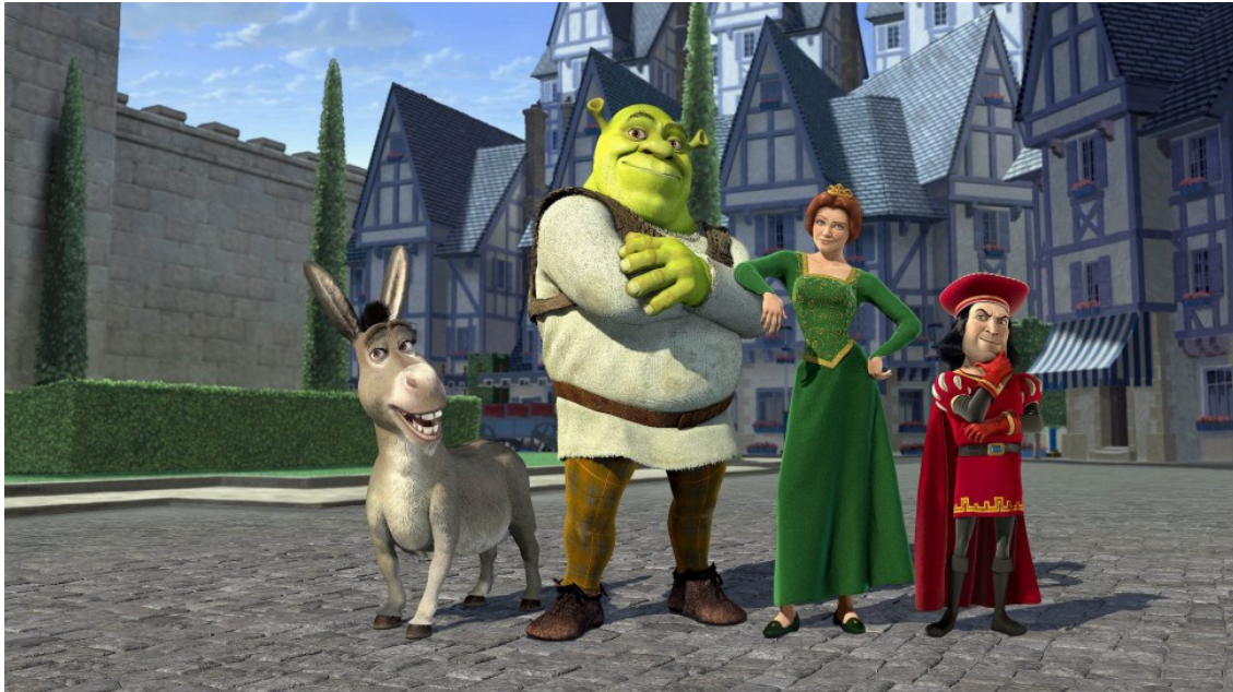
Slika 1.: Glavni likovi u filmu Shrek 1

Ubrzo mu počinje dosađivati Magarac koji je pričljive prirode te ga slijedi i uporno s njime želi razgovarati. Shrek ga ne uspijeva otjerati, već uvidi sve njegove pozitivne karakteristike i na kraju postaju prijatelji koji se zajedno bore za spas princeze Fione.