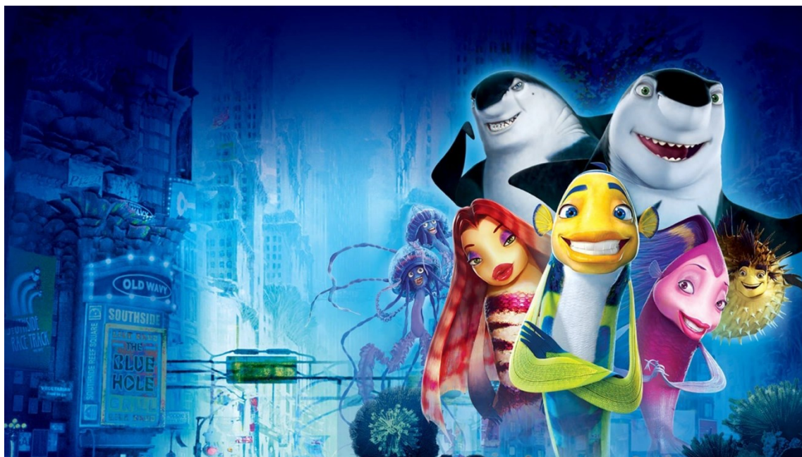
Slika 2.: Glavni likovi u filmu Riba ribi grize rep

Radnja filma odvija se u podmorju. Na samom početku radnje upoznajemo Oskara, ribu “frajera” koji žudi za slavom i novcem jer smatra da, ako će imati materijalno, da će ga ostale ribe u podmorju više cijeniti. Upoznajemo i ribu Angie koja simpatizira Oskara, morskog psa Lenija koji je vegetarijanac i njegovu obitelj koja ga u tome ne podržava. Spletom okolnosti, upoznaju se Leni i Oskar i shvate da jedan od drugoga mogu imati koristi. Oskar postaje popularan, počinje se sviđati ribi “ljepotici” Loli, a Leni ostaje skriven u Oskarovoj garaži. Radnja se raspliće tako da Leni i Oskar shvaćaju svoje greške, Don Lino (Lenijev otac) ga počinje prihvaćati, a Oskar ulazi u ljubavnu vezu s Angie.