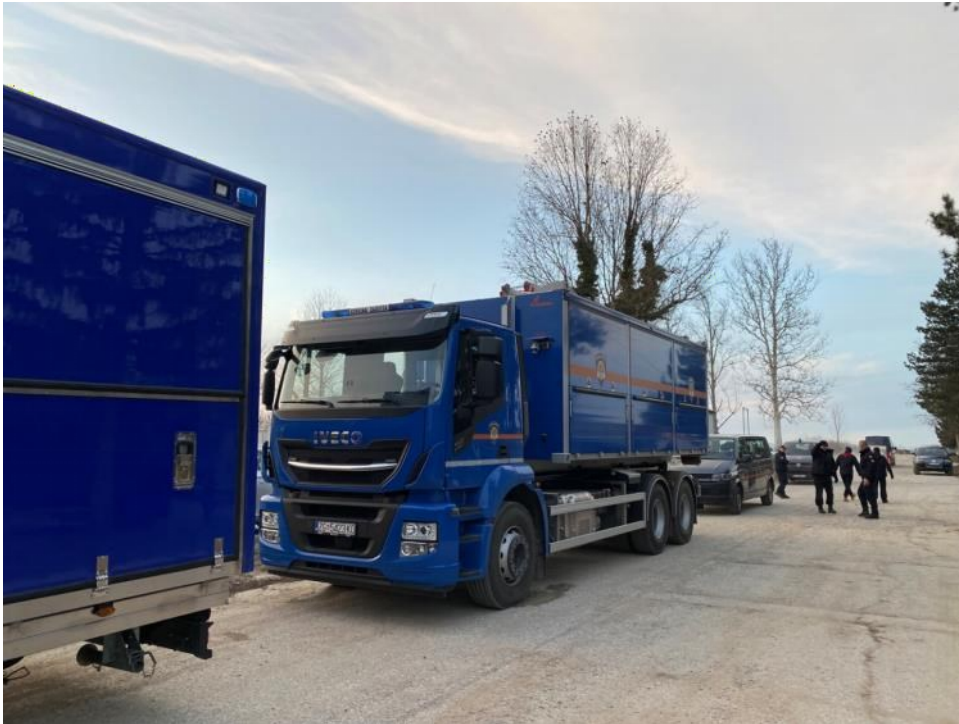
Slika 5: Hrvatski tim koji je sudjelovao u akcijama spašavanja u Turskoj

Izvor podataka: Ministarstvo unutarnjih poslova Republike Hrvatske, Ravnateljstvo civilne zaštite. (2024). Razoran potres u Turskoj: Hrvatska poslala tim za spašavanje https://civilna-zastita.gov.hr/vijesti/razoran-potres-u-turskoj-hrvatska-poslala-tim-za-spasavanje/6722 (Pristupljeno 11.7.2024.)