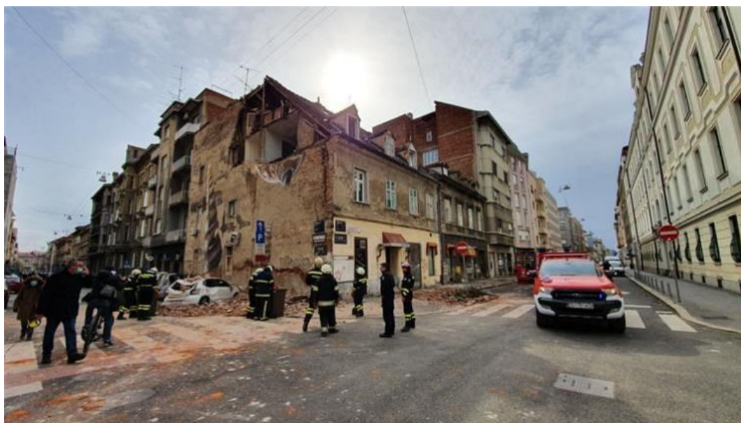
Slika 2: Zagrebački potres 2020.

Izvor podataka: Republika Hrvatska, Hrvatska vatrogasna zajednica (2024.) Zagrebački potres 2020. https://hvz.gov.hr/vijesti/zagrebacki-potres-2020/2868 (Pristupljeno 13.6.2024).