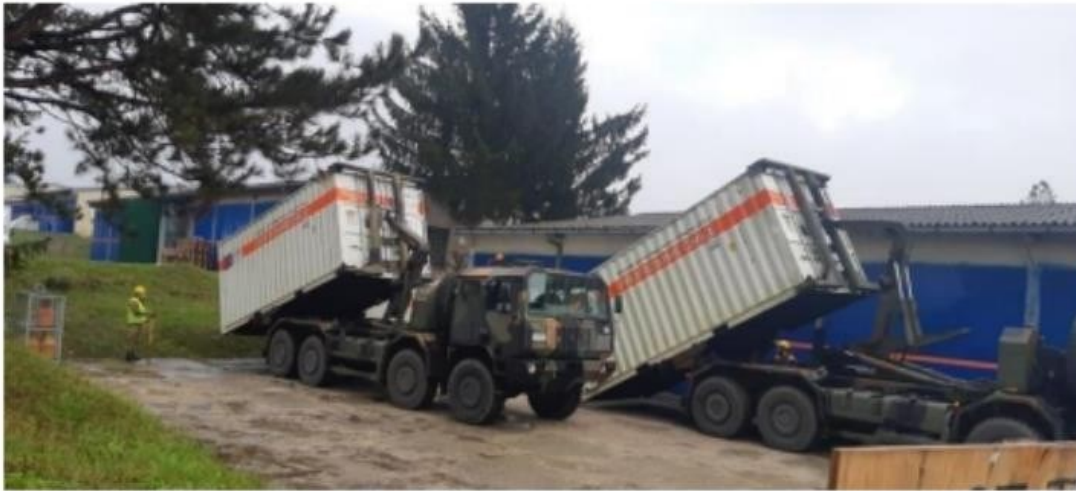
Slika 3: Prihvat međunarodne pomoći u Logističkom centru Ravnateljstva civilne zaštite u Jastrebarskom

Izvor podataka: Ministarstvo unutarnjih poslova Republike Hrvatske, Ravnateljstvo civilne zaštite. (2024.) Odgovor sustava civilne zaštite na razorne potrese u Sisačko-moslavačkoj županiji. https://civilna-zastita.gov.hr/UserDocsImages/CIVILNA%20ZA%C5%A0TITA/PDF_ZA%20WEB/Bro%C5%A1ura_potres%20SM%C5%BD%2023.12.%20zadnje.pdf (Pristupljeno 9.7.2024.)