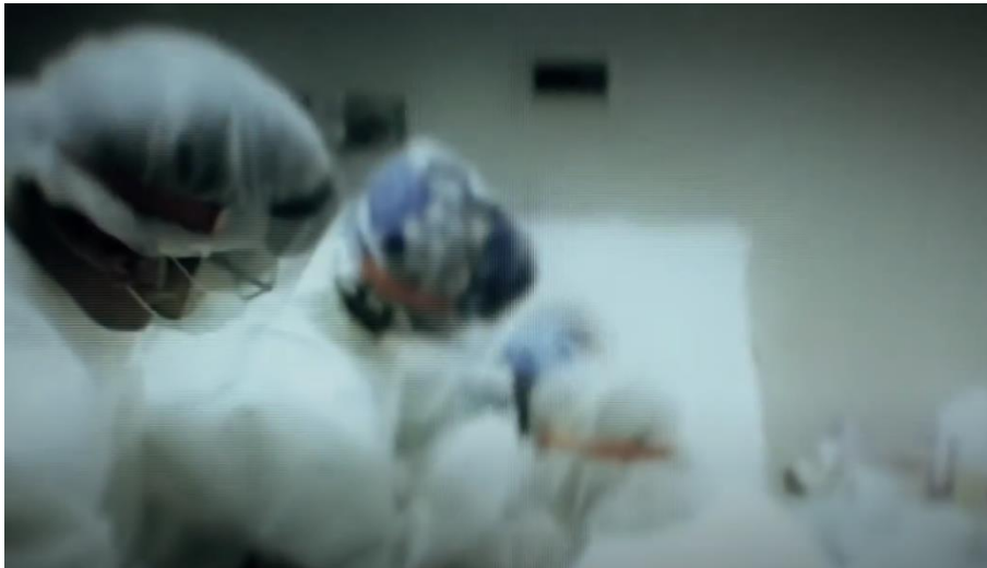
Slika 7. Hitna operacija, izvor: YouTube, Joe Biden

Dvije političke teme koje su najzastupljenije u Bidenovim spotovima su zdravstvo i ekonomija. U videu Real Plans napominje da su spomenute teme usko povezane („da bismo dobili kontrolu nad gospodarstvom, moramo kontrolirati virus“). Ističe da ima plan za spašavanje ljudskih života. Povećat će broj testiranja, forsirati nošenje maski na otvorenom, ali i pomoći starijima koji su najugroženiji. Više puta je prikazan s maskom na licu. Slično govori i u spotu Ready to Lead gdje nabraja da je za borbu protiv virusa i ponovnu izgradnju ekonomije potreban predsjednik koji je „spreman voditi“ te da će uvesti obavezno testiranje, nošenje maski i povećati proizvodnju opreme za zdravstvene radnike. U narativnoj ekspoziciji spomenutog videa prevladavaju još dramatičniji kadrovi koji prikazuju hitnu operaciju pacijenta. Time je dodatno pojašnjena ozbiljnost pandemije.