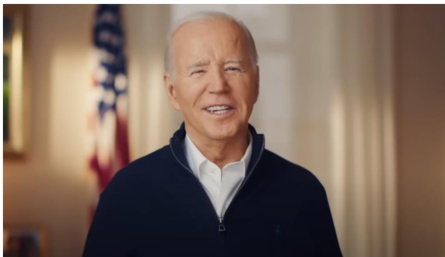
Slika 17. Šaljivi Joe Biden