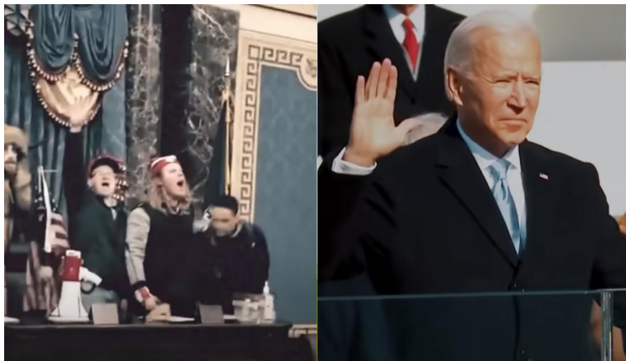
Slika 10. Promjena osvjetljenja

se stvara osjećaj tmurnosti i sivila. Primjer koji dobro prikazuje moć osvjetljenja je Long Way . U narativnoj ekspoziciji, koja govori o stanju SAD-a prije izbora 2020., javljaju se kadrovi sa slabim osvjetljenjem. Kada dolazi do narativnog poremećaja, odnosno trenutka u kojem se remeti početno stanje, kadar, koji prikazuje Bidenu prisegu, postaje svjetliji.