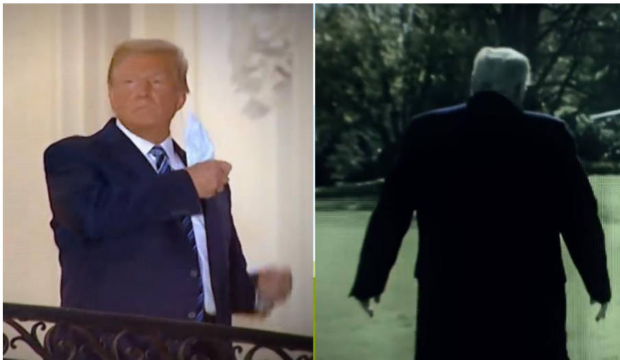
Slika 3. Trump skida masku i okreće leđa

u ulogu negativca i neprijatelja. U čak devet od deset analiziranih videa označen kao negativac. Osim što se konstantno naglašava da loše vodi državu, zanemaruje radničku klasu i ne mari za pandemiju, u videima se također koristi moć mizanscene kako bi se istaknula njegova uloga negativca. Kada se Trump pojavljuje u kadru, u većini slučajeva ga prati smeđe osvjetljenje, čime slika izgleda mračnije i tamnije. Nakon što se u kadru nakon toga pojavi Biden, slika je ponovno čista. Planovi su pomno birani, pa je tako Trump nerijetko sniman u krupnom ili bližem planu, a gotovo uvijek radi grimasu ili se smije. Posebno značajna su dva kadra u kojima Trump okreće leđa gledatelju ( Ready to Lead ) i skida masku ( My Mom ).