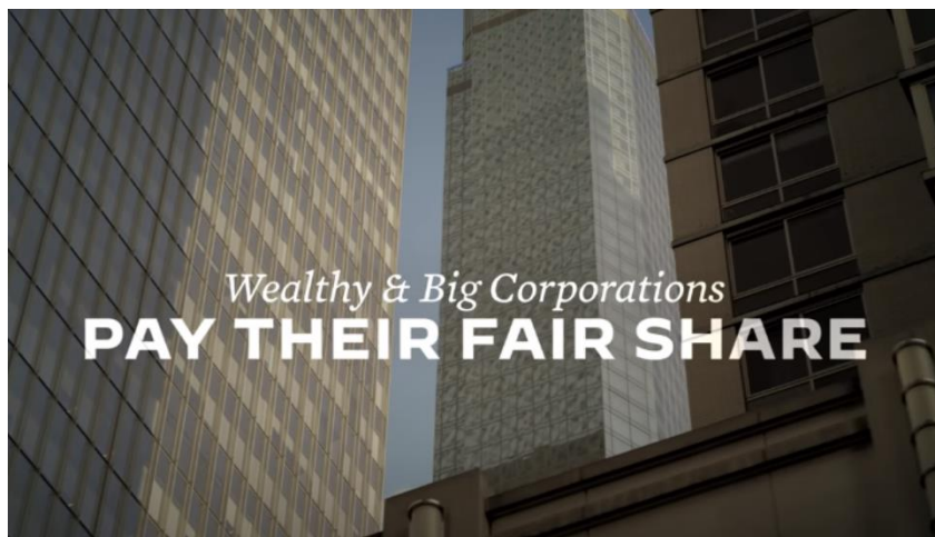
Slika 4. Neboder kao simbol velikih korporacija, izvor: YouTube, Joe Biden

biračima uz poruku da se više mora napraviti za radnike, umjesto za već imućne. Kadrovi nebudera prikazani su i u videu Fair gdje Biden daje do znanja da će velike korporacije natjerati da „pošteno plate svoj dio“.