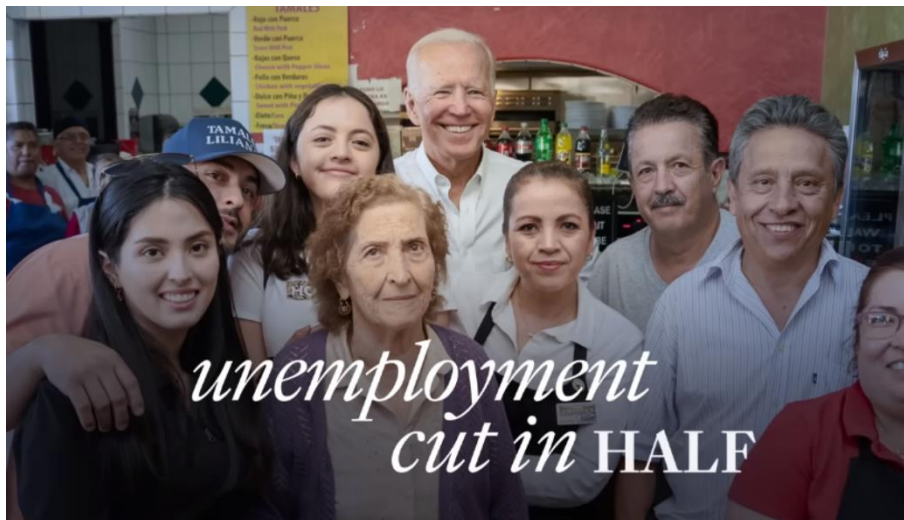
Slika 13. Biden i Latinoamerikanci

Taktike odobravanja, kojima Biden ističe svoje prednosti, dominiraju kampanjom iz 2024. godine. Prisutne su u čak devet videozapisa, iako treba napomenuti da su ponekad pomiješane s napadima. Ipak postoje i videa koja su snimana isključivo u pozitivnom svjetlu. Primjer čistog političkog odobravanja može se vidjeti u videu It's Us . Negativnost nije prisutna, već se spot fokusira na hvaljenje i isticanje Bidenovih pozitivnih strana. Pripovijeda Latinoamerikanka koja govori da je Biden u njihovoj zajednici smanjio nezaposlenost za 50 posto, da su njihova poduzeća najbrže rastuća u državi te da pomaže u ekonomskoj obnovi SAD-a. Na početku su prikazani kadrovi Bidena koji se smije i potpisuje dokument, a zatim se slika s Latinoamerikancima.