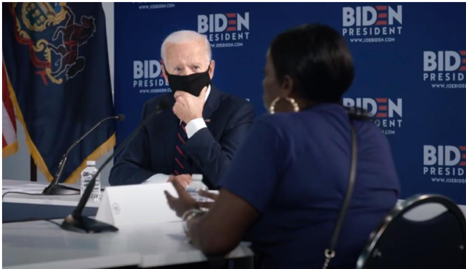
Slika 1. Biden u odijelu s maskom

Često se nalazi za govornicom gdje je sniman u bližem planu, a također je puno puta prikazan u interakciji s ljudima koji simboliziraju njegove birače. Rukuje se s njima ili ih jednostavno sluša. U nekim videozapisima Biden nije junak po Proppovoj sistematizaciji, već ima ulogu darovatelja. Primjeri za to su A Healthy Life i Crossroads . Otac bolesnog dječaka i bivši Trumpov glasač su junaci tih videa, no Biden, iako ima drugačiju ulogu, ipak sebe prikazuje u okviru mita heroja-spasitelja, odnosno kao osobu koja će riješiti njihove probleme.