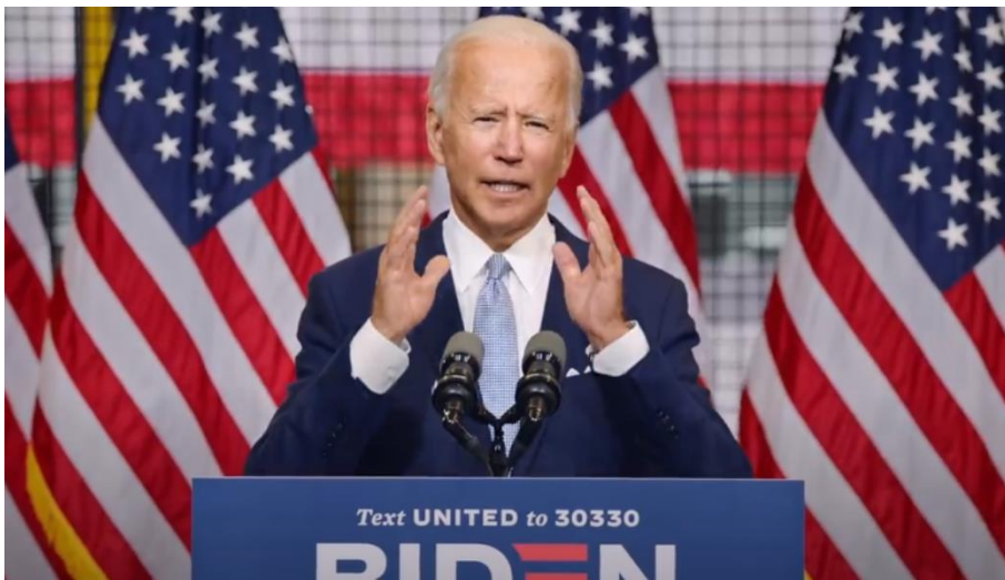
Slika 2. Biden za govornicom

Često se nalazi za govornicom gdje je sniman u bližem planu, a također je puno puta prikazan u interakciji s ljudima koji simboliziraju njegove birače. Rukuje se s njima ili ih jednostavno sluša. U nekim videozapisima Biden nije junak po Proppovoj sistematizaciji, već ima ulogu darovatelja. Primjeri za to su A Healthy Life i Crossroads . Otac bolesnog dječaka i bivši Trumpov glasač su junaci tih videa, no Biden, iako ima drugačiju ulogu, ipak sebe prikazuje u okviru mita heroja-spasitelja, odnosno kao osobu koja će riješiti njihove probleme.