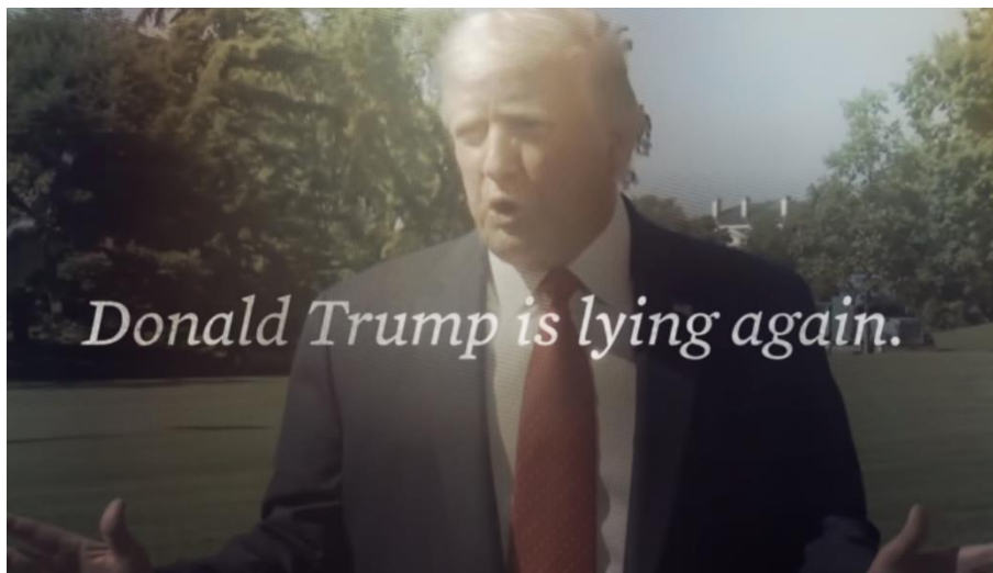
Slika 5. Trump s grimasom, izvor: YouTube, Joe Biden

Postoje i videa u kojima su napadi jači. Jedan od primjera je Fair , koji odmah započinje napadačkom tehnikom. Prvi kadar je prikaz Trumpa koji širi ruke i radi grimasu, a prati ga tmurno osvjetljenje. Biden ga optužuje da ponovno laže, a potom svojim biračima obećava da neće podignuti porez te da će maknuti rupe u zakonu za velike korporacije.