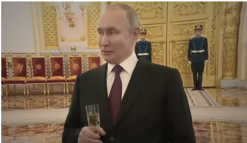
Slika 11. Vladimir Putin sa šampanjcem, izvor: YouTube, Joe Biden

Osim Trumpa, kao negativci prikazani su i drugi republikanci. U videu These Guys pojavljuju se republikanac Ron DeSantis i senator Tim Scott koji su također tmurno osvijetljeni. War Zone govori o ratu u Ukrajini, a u narativnoj komplikaciji spominje se ruski predsjednik Vladimir Putin. Biden ga naziva tiraninom. Također je prisutno smeđe osvjetljenje, a Putin u kadru pije šampanjac i smije se.