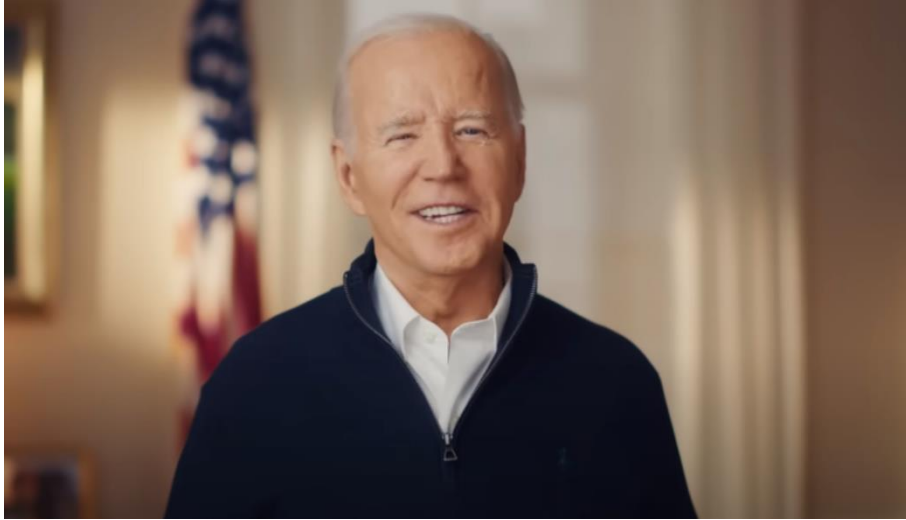
Slika 17. Šaljivi Joe Biden, izvor: YouTube, Joe Biden