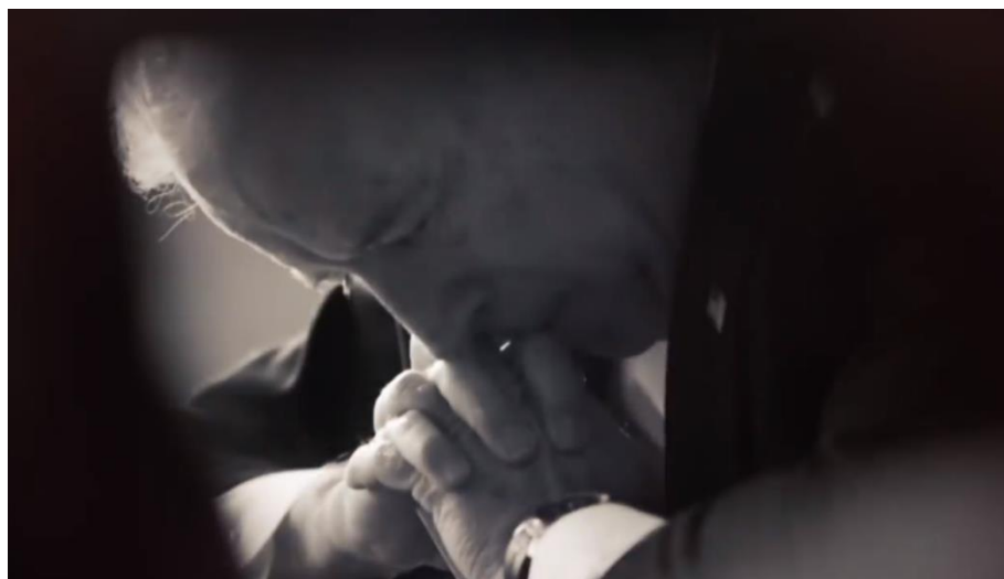
Slika 8. Ožalošćeni Biden

Iako je u prvom planu politika, Biden u pojedinim spotovima vodi računa o svojem imidžu. Najviše biografskih elemenata ima u videu Personal . Kao što i naslov („Osobno“) sugerira, Biden se prisjeća nekoliko ključnih trenutaka iz svojeg privatnog života. Govori da su mu prva žena i kćer poginuli u automobilskoj nesreći. Potom kaže da mu je 40 godina kasnije od raka preminuo sin. Sve prate crno-bijele fotografije Bidena s obitelji, među kojima se najviše ističe ona u bolnici, kao i krupni kadar ožalošćenog Bidena sa sklopljenim rukama. Cijeli video spot je crno-bijeli.