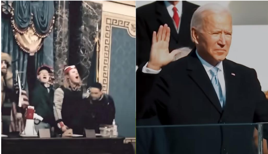
Slika 10. Promjena osvjetljenja, izvor: YouTube, Joe Biden

se stvara osjećaj tmurnosti i sivila. Primjer koji dobro prikazuje moć osvjetljenja je Long Way . U narativnoj ekspoziciji, koja govori o stanju SAD-a prije izbora 2020., javljaju se kadrovi sa slabim osvjetljenjem. Kada dolazi do narativnog poremećaja, odnosno trenutka u kojem se remeti početno stanje, kadar, koji prikazuje Bidenu prisegu, postaje svjetliji.