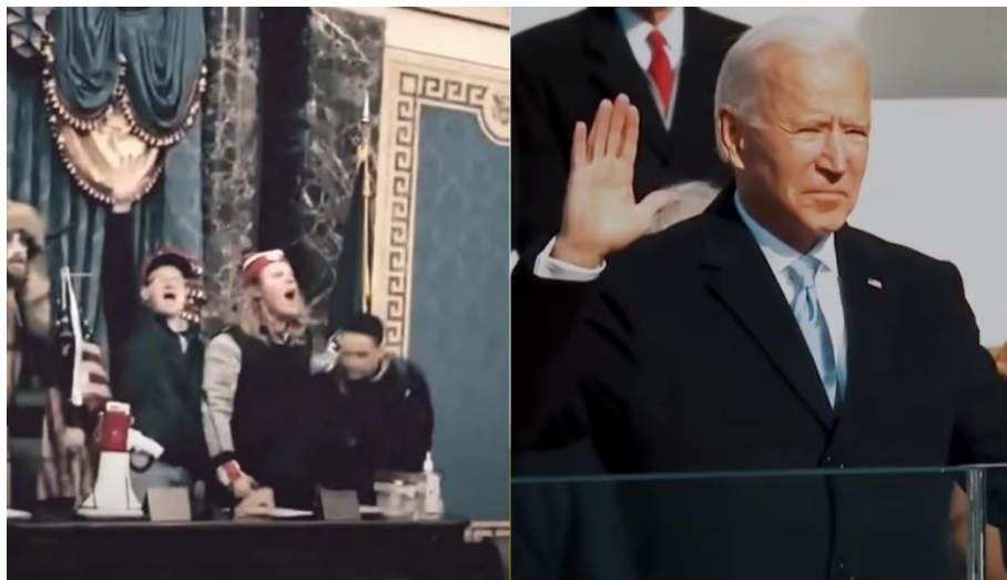
Slika 10. Promjena osvjetljenja, izvor: YouTube, Joe Biden

se stvara osjećaj tmurnosti i sivila. Primjer koji dobro prikazuje moć osvjetljenja je Long Way . U narativnoj ekspoziciji, koja govori o stanju SAD-a prije izbora 2020., javljaju se kadrovi sa slabim osvjetljenjem. Kada dolazi do narativnog poremećaja, odnosno trenutka u kojem se remeti početno stanje, kadar, koji prikazuje Bidenu prisegu, postaje svjetliji.