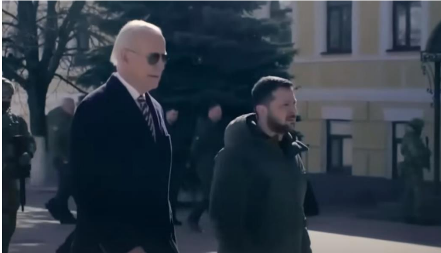
Slika 16. Bidenov susret s predsjednikom Zelenskim, izvor: YouTube, Joe Biden

Biden izjavljuje da se nije osjećao usamljeno, jer je sa sobom donio ideju Amerike: sve ono za što su se Amerikanci borili prije 250 godina, slobodu, samoodređenje i nezavisnost. U tom trenutku prikazan je krupni plan velike ukrajinske, a pored nje manje američke zastave. Video završava s Bidenom u uredu koji uperuje prst u gledatelja i kaže da je Amerika svjetionik svijetu. War Zone počinje još dramatičnije. Pojavljuju se pruga i ukrajinske zgrade, a kamera je dinamična i drma se. Biden još jednom naglašava da je prvi predsjednik od Lincolna koji je ušao u ratnu zonu, dok njegove riječi prate kadrovi razorenih gradova. U ovom videu također se vidi kadar rukovanja sa Zelenskim kojeg naziva saveznikom. Biden ističe da se zalaže za demokraciju u mjesto kojim vlada tiranin. U tom trenutku u kadru se pojavljuje Putin koji pije šampanjac i smije se. Kao kod Trumpa i ostalih republikanaca, Putin je također sniman u smeđem, tmurnom osvjetljenju. Za kraj, Biden kaže da je u ratnoj zoni pokazao svijetu od čega je napravljena Amerika, što je snaga tihog vođe koji se neće pokloniti diktatoru. U posljednjem kadru sniman je u bližem planu - nosi sunčane naočale i kaput. Sebe prikazuje kao neustrašivog, spremnog pomoći.