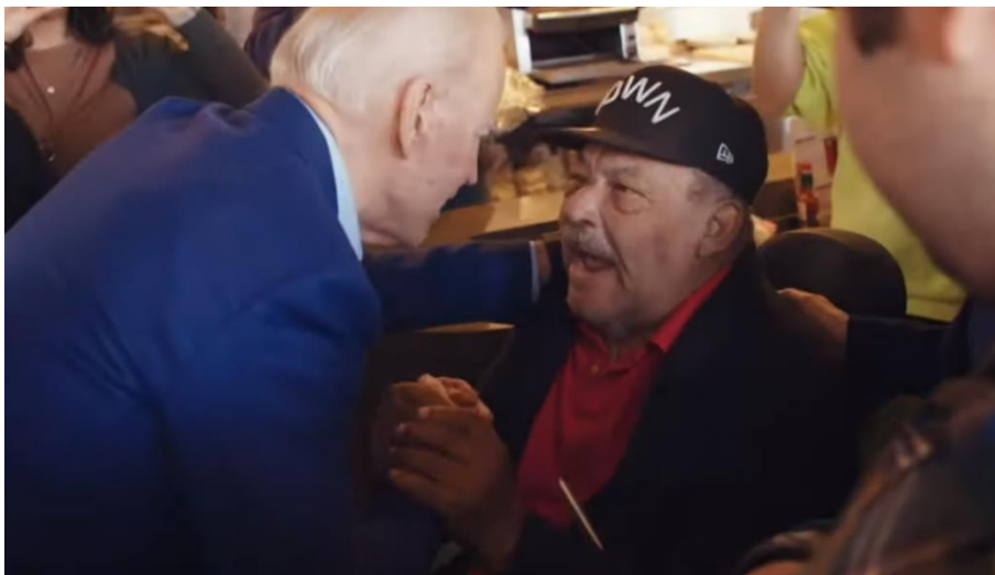
Slika 9. Biden sa starijim, bolesnim čovjekom