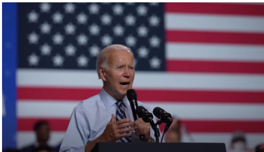
Slika 12. Biden i američka zastava

Mit o američkom snu prožet je cijelim spotom Flag . Na početku, gledatelj može vidjeti razne kadrove američke zastave: otac i kći je podižu, Afroamerikanka maše njome, prikazan je grad iz ptičje perspektive u kojem ona dominira. Biden za to vrijeme nabraja sve što zastava predstavlja - hrabrost, priliku, demokraciju i slobodu. Napominje da su te vrijednosti, koje su ujedno izgradile državu, napadnute. Pojavljuju se kadrovi juriša na Kapitol SAD-a uz tmurno osvjetljenje. Trump se ne spominje direktno, ali Biden do znanja daje da iza napada stoji „ekstremni pokret“ koji želi izbore iz 2020. godine proglasiti nevažećima, zabraniti pojedine knjige i ukinuti pravo odabira ženama. Potom se prikazuje Biden, sniman je u srednjem planu u uredu i u bližem planu za govornicom. U oba kadra u pozadini je prisutna zastava.