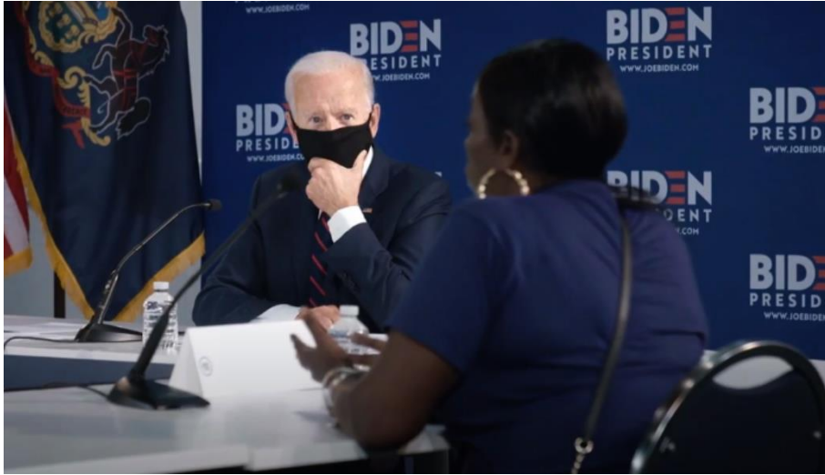
Slika 1. Biden u odijelu s maskom

Često se nalazi za govornicom gdje je sniman u bližem planu, a također je puno puta prikazan u interakciji s ljudima koji simboliziraju njegove birače. Rukuje se s njima ili ih jednostavno sluša. U nekim videozapisima Biden nije junak po Proppovoj sistematizaciji, već ima ulogu darovatelja. Primjeri za to su A Healthy Life i Crossroads . Otac bolesnog dječaka i bivši Trumpov glasač su junaci tih videa, no Biden, iako ima drugačiju ulogu, ipak sebe prikazuje u okviru mita heroja-spasitelja, odnosno kao osobu koja će riješiti njihove probleme.