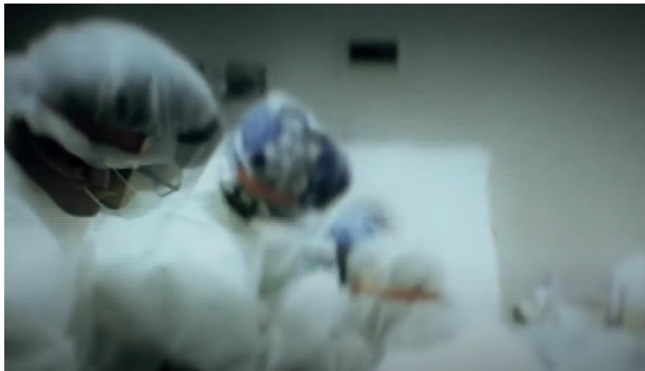
Slika 7. Hitna operacija

Dvije političke teme koje su najzastupljenije u Bidenovim spotovima su zdravstvo i ekonomija. U videu Real Plans napominje da su spomenute teme usko povezane („da bismo dobili kontrolu nad gospodarstvom, moramo kontrolirati virus“). Ističe da ima plan za spašavanje ljudskih života. Povećat će broj testiranja, forsirati nošenje maski na otvorenom, ali i pomoći starijima koji su najugroženiji. Više puta je prikazan s maskom na licu. Slično govori i u spotu Ready to Lead gdje nabraja da je za borbu protiv virusa i ponovnu izgradnju ekonomije potreban predsjednik koji je „spreman voditi“ te da će uvesti obavezno testiranje, nošenje maski i povećati proizvodnju opreme za zdravstvene radnike. U narativnoj ekspoziciji spomenutog videa prevladavaju još dramatičniji kadrovi koji prikazuju hitnu operaciju pacijenta. Time je dodatno pojašnjena ozbiljnost pandemije.