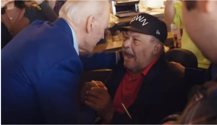
Slika 9. Biden sa starijim, bolesnim čovjekom