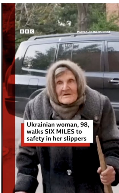
Slika 4: TikTok –@bbcnews, 04.05.2024.