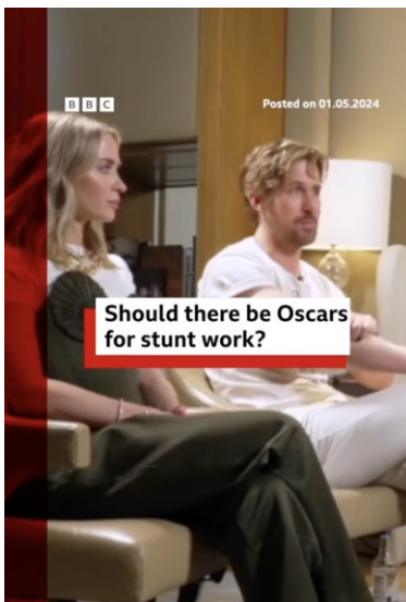
Slika 6: TikTok - @bbcnews, 01.05.2024.