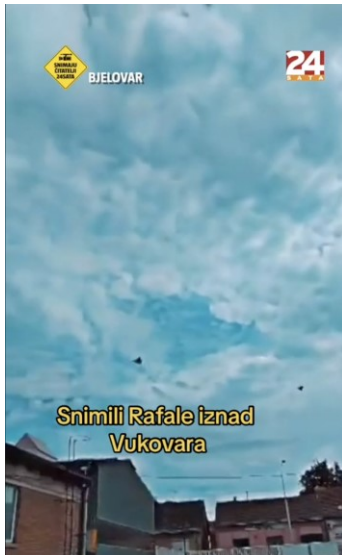
Slika 7: 01.05.2024.