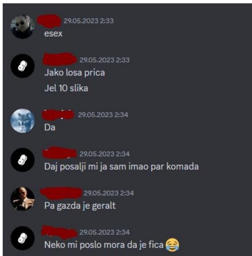
Slika 2: Prikaz nastavka elektronskog nasilja na platformi Discord

Leak kako je prikazano na slici označava termin curenje, a igrač u ovom kontekstu navodi da slike igračice X moraju procuriti, odnosno, postati dostupne. Nasilje je vršeno od gotovo svih korisnika City of Angels Discord zajednice.