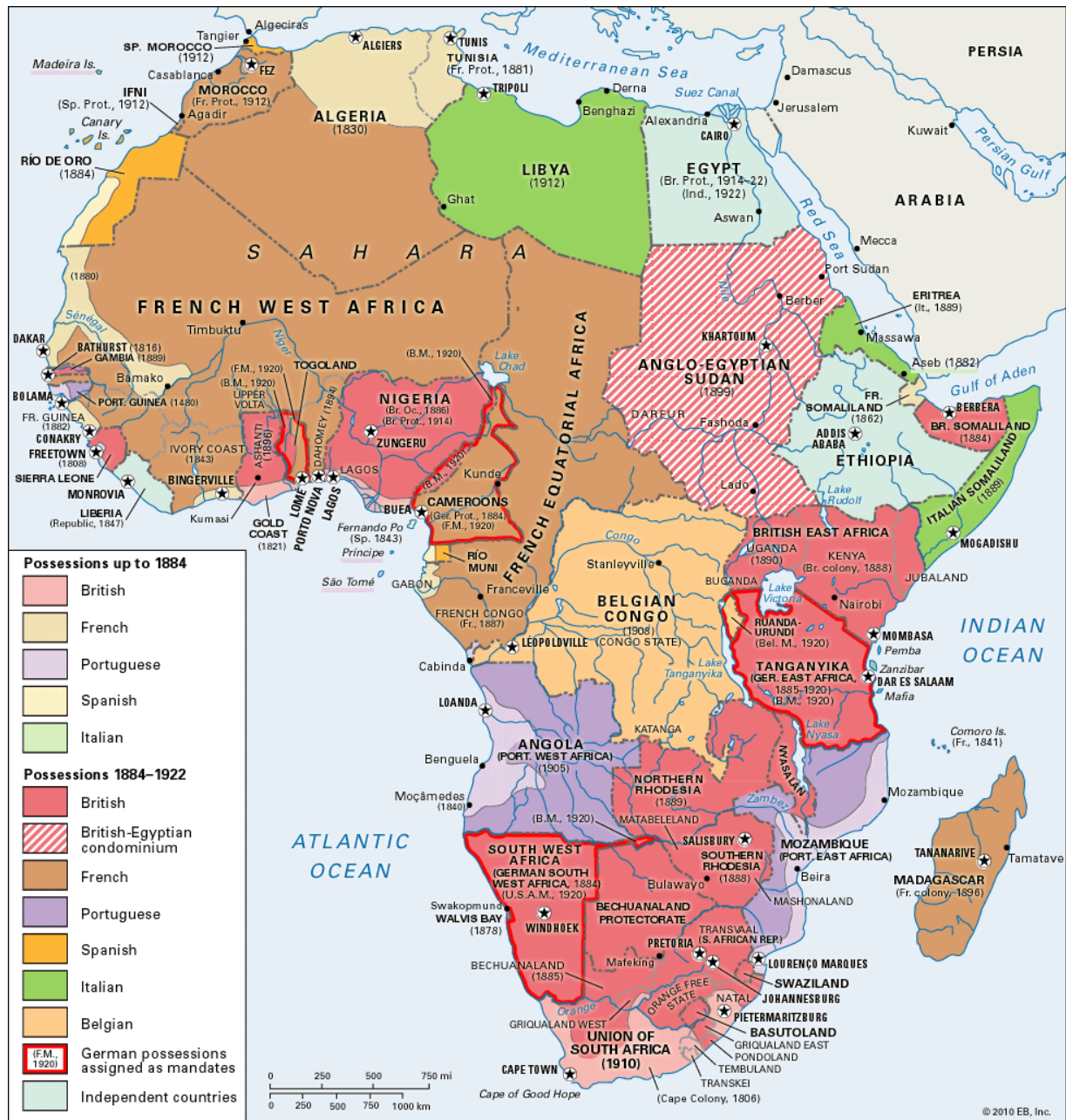
Slika 1: Kolonije u Africi

Asabu „spremajući se za nova osvajanja u istočnoj Africi a posebno na rogu Afrike, u Somaliji“ (Gavrilović, 1979: 53).