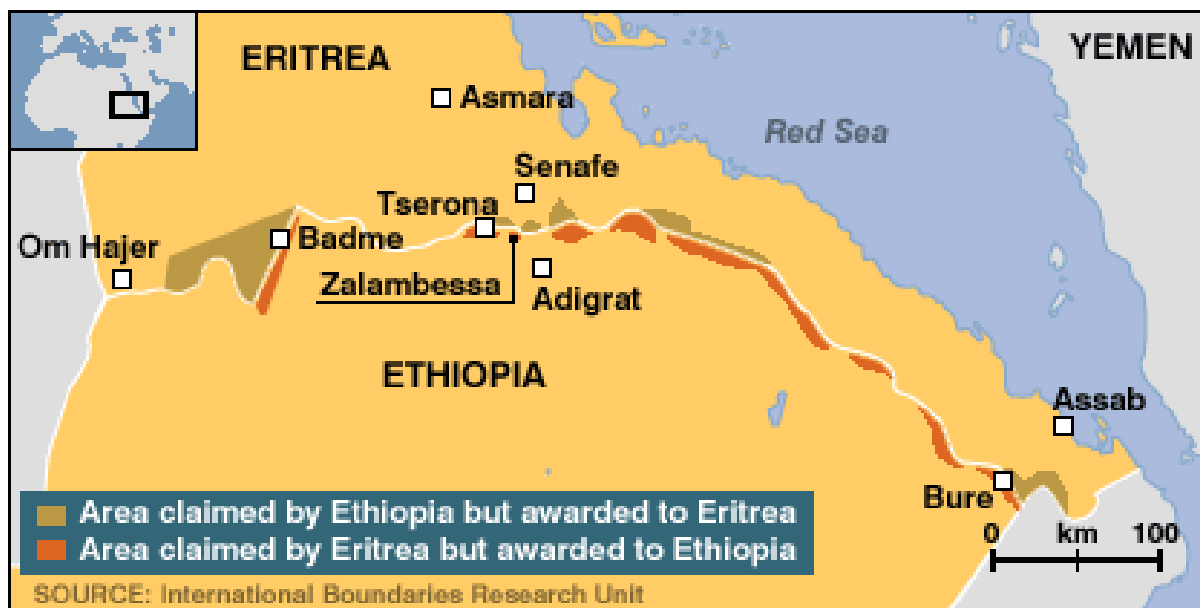
Slika 2: Sporna granična područja Etiopije i Eritreje

Afewerkia. Eritrejci su smatrali da treba poštivati kolonijalne granice, kao što je slučaj u ostalim afričkim zemljama, no Etiopija sama kreira novu granicu prema kojoj Badme pripada njezinom teritoriju. Komisija nije uspjela u rješavanju problema, te u listopadu 1997. etiopske snage ulaze na područje Badmea, zauzimaju pojedina sela, uspostavljaju svoju administraciju i protjeruju eritrejsko stanovništvo. Slika 2 prikazuje sporna granična područja dviju država s koje je vidljivo da svaka ima pretenzije na teritorij dodijeljen onoj drugoj, a najspornije je područje Badmea gdje se vodio najveći sukob.