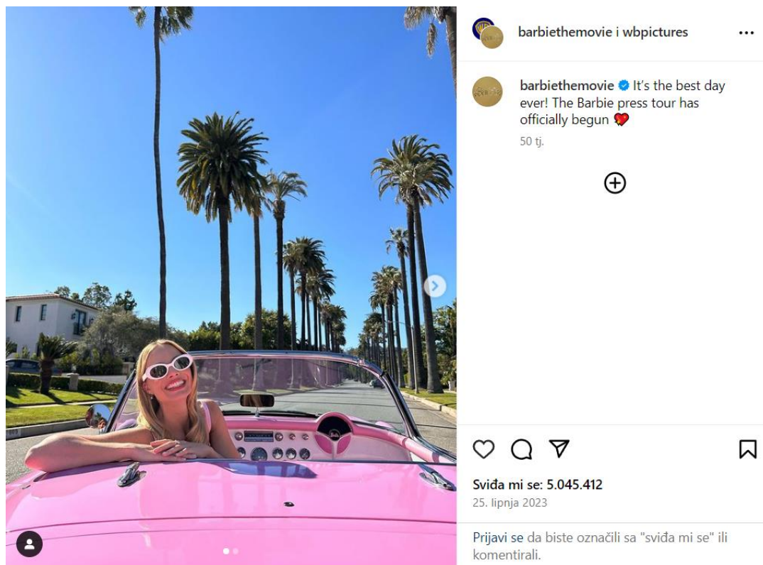
Slika 1: Najpopularnija Instagram objava