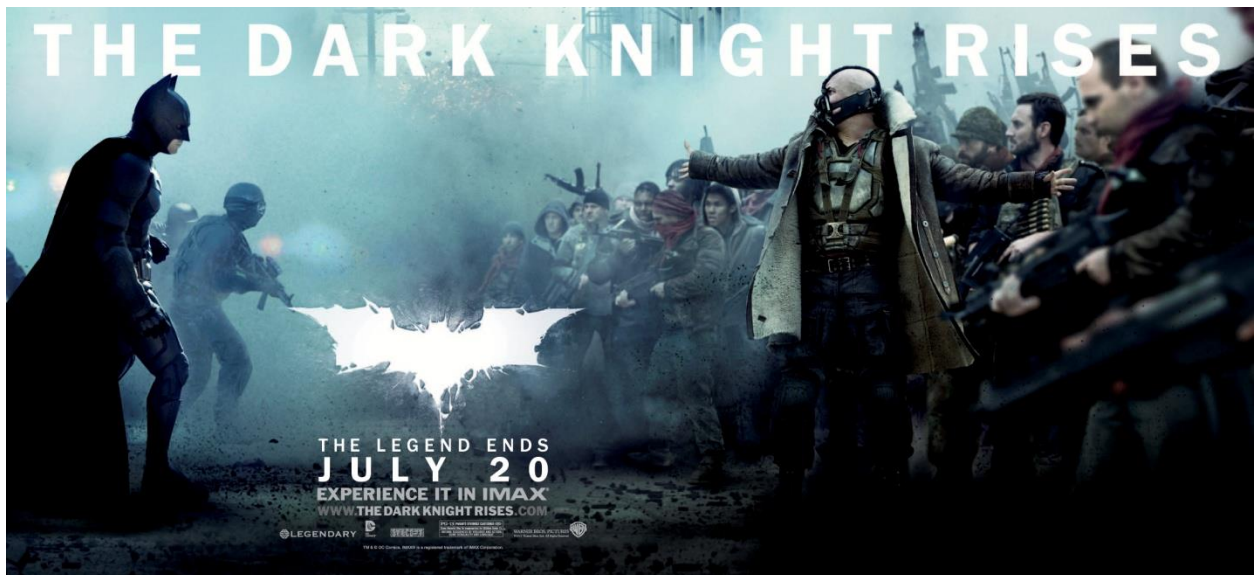
Slika 16.: Bane predvodi narod

No Nolan vidi Batmana i kao onog koji stoji nasuprot revolucionarnom zanosu Banea i njegovih poklonika te, sukladno tome, kao zaštitnika postojećeg poretka (Russell, 2022: 3-4).