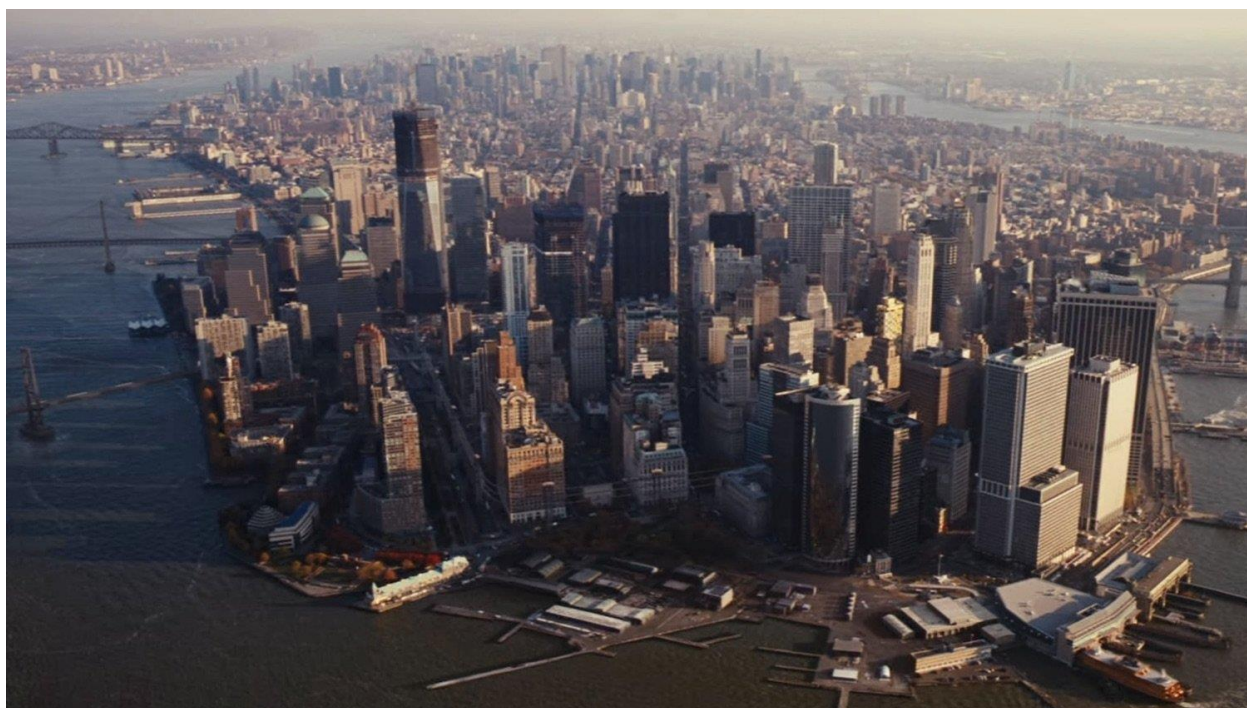
Slika 13.: Gotham iz zraka

Ako je Ra's Al Ghul bin Laden, može li se zaključiti da je njegov žestoki protivnik i smrtni neprijatelj simbol američkog predsjednika Georgea W. Busha?