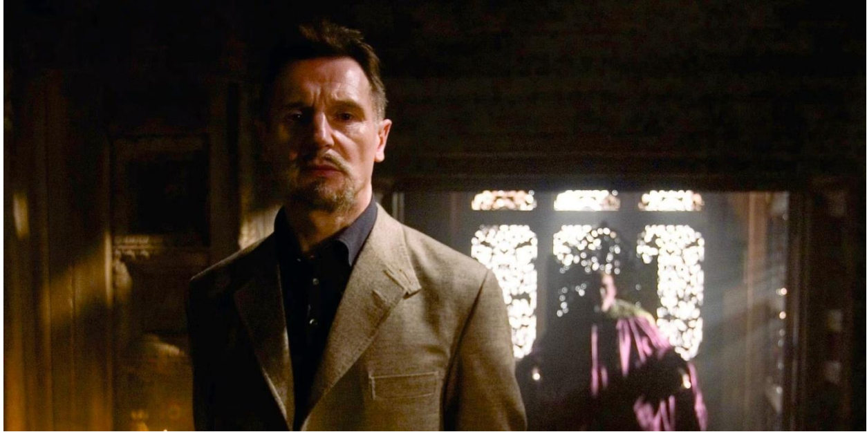
Slika 5.: Ducard i „Ra's Al Ghul“