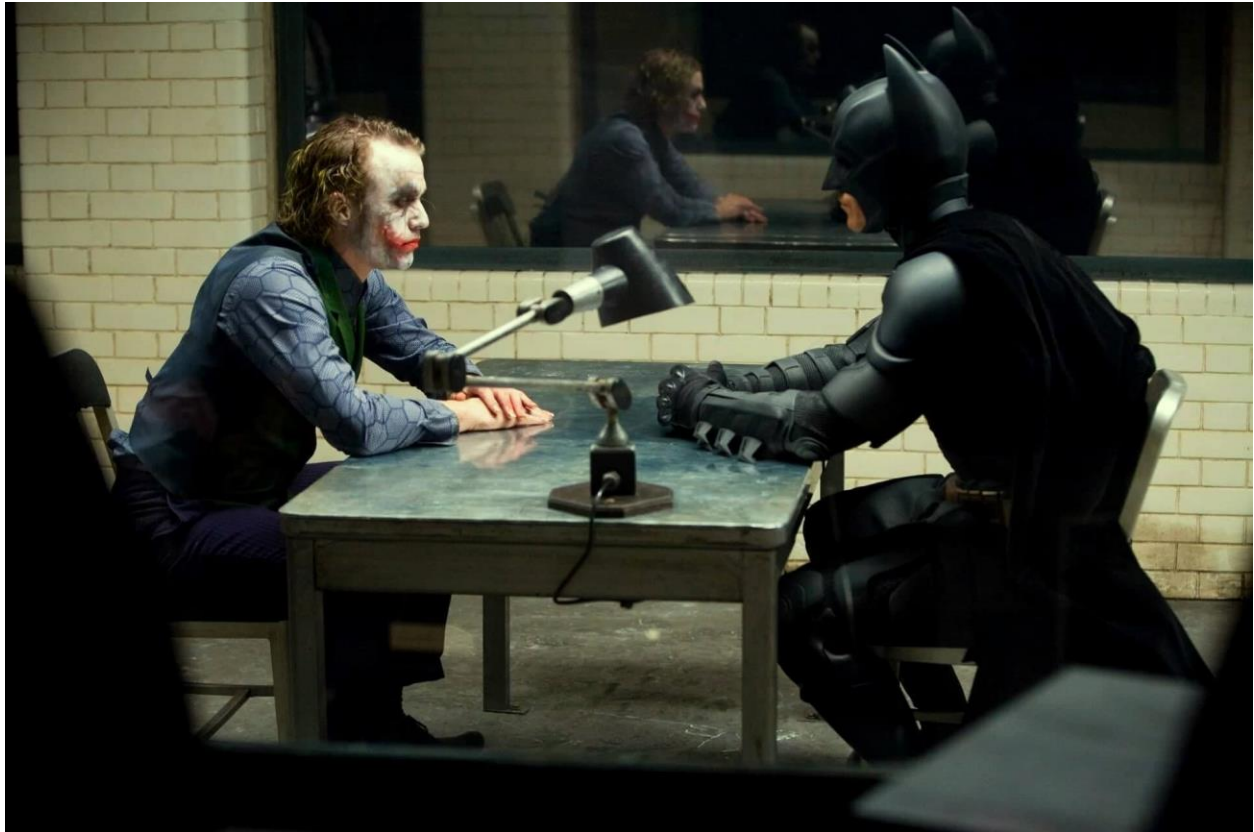
Slika 10.: Batman ispituje Jokera