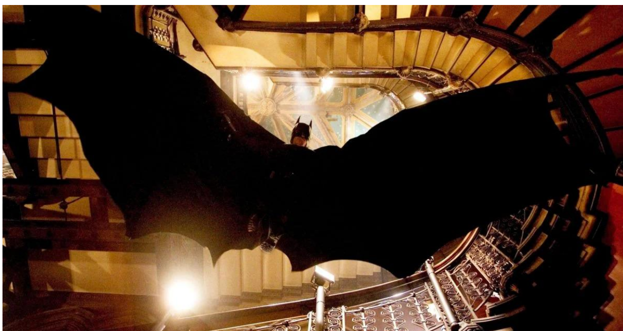
Slika 4.: Batman u letu