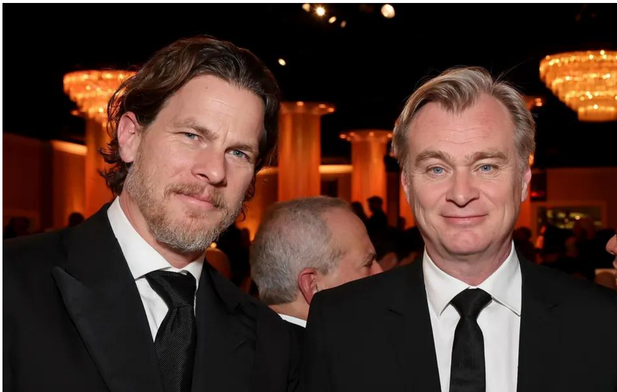
Slika 20.: Braća Jonathan i Christopher Nolan