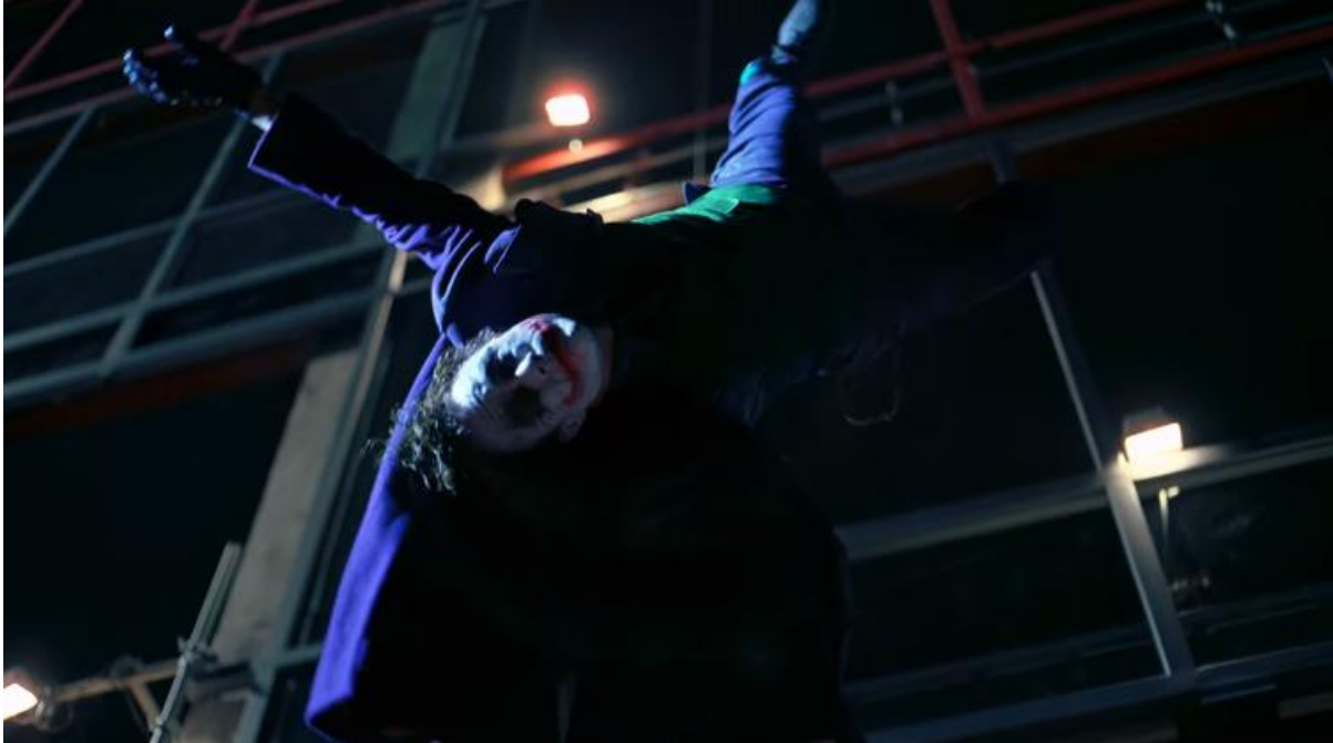
Slika 18.: Jokerovi posljednji trenutki

Neki autori, poput spomenutog Kolenica, vide Jokerovu antiracionalnost kao odgovor na Batmanovu racionalnost, kao što je i sam postmodernizam odgovor na strahote modernizma (Kolenic, 2009: 1031, cit. prema Yilmaz i Fundalar, 2022: 6). U sceni smještenoj u Općoj bolnici vidimo kako Joker uvjerava Denta da je kaos prirodan, pošten i lijep te mu nudi predokus kaosa koji jedini osigurava pravednost (Kolenic, 2009: 1031, cit. prema Yilmaz i Fundalar, 2022: 6).