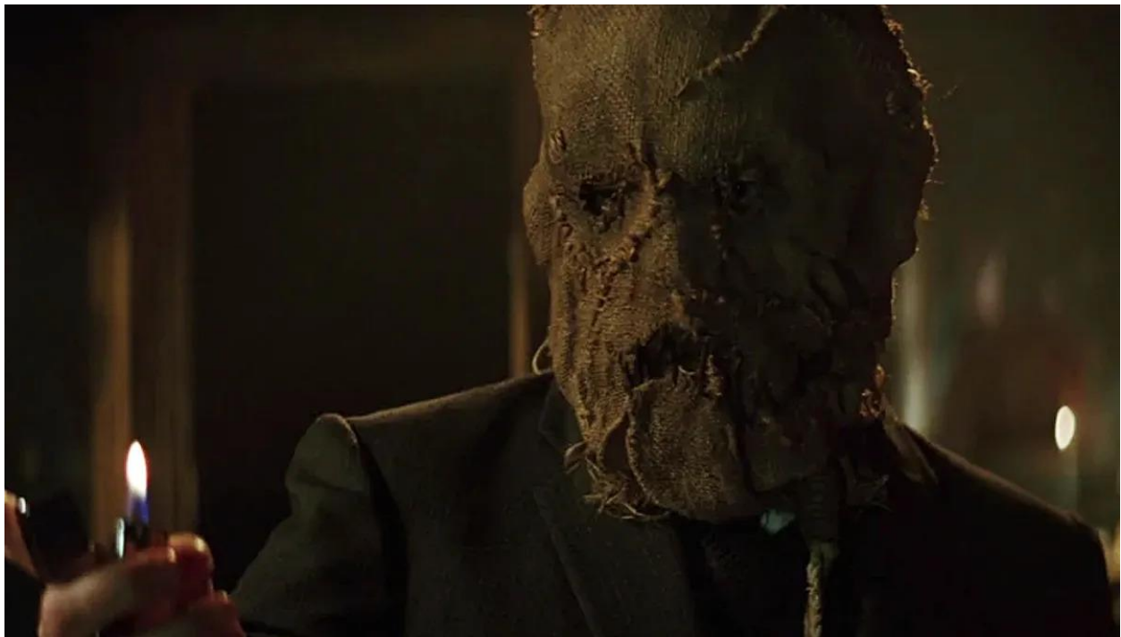
Slika 6.: Scarecrow