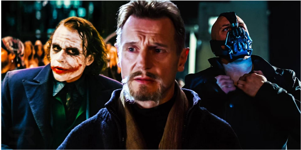
Slika 17.: Galerija zlikovaca

Korupcija je posebno raširena među onima koji bi trebali raditi na iskorjenjivanju iste – od Falconeovih ljudi u filmu „Batman: Početak“ pa do Maronijevih ljudi, detektiva Burkea i Ramirez u filmu „Vitez tame“ pa čak, na neki način, i do Jima Gordona koji je, kako bi učvrstio vjeru građana u dobro, ponudio im „ lažnog idola “ u obliku Harveyja Denta i zataškao njegovo pretvaranje u psihopata i ubojicu znanog kao Two-Face.