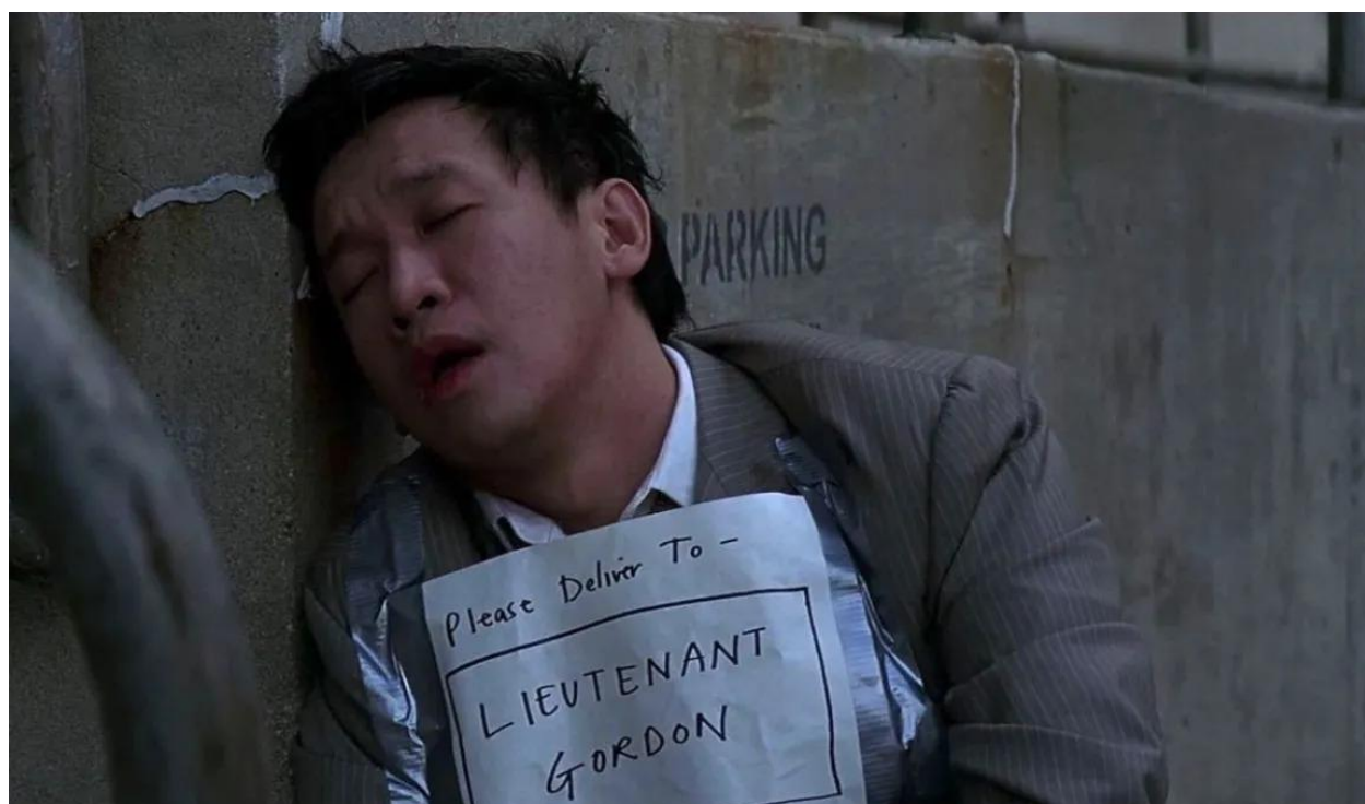
Slika 14.: Lau pred policijskom postajom

Upravo te odrednice – korištenje mučenja u ispitivanju zatvorenika i kršenje građanskih sloboda masovnom špijunažom – služe kako bi još bolje ilustrirale poveznicu između Batmana i Busha mlađeg koji je koristio tehnike mučenja vodom kako bi iznuđivao priznanja od islamističkih i drugih terorista u zaljevu Guantanamo (Brody, 2011) i koji je naredio špijunažu američkih građana unutar teritorija SAD-a kako bi se spriječili mogući teroristički napadi (Halperin, 2005).