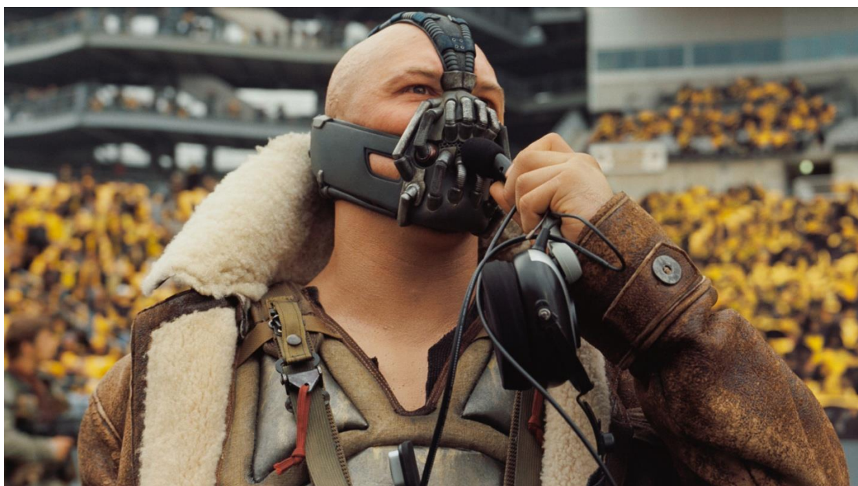
Slika 10.: Baneov govor na stadionu

Alfred, Bruceov batler i bliski suradnik, odlazi u Firencu gdje ugleda Brucea i Catwoman u restoranu.