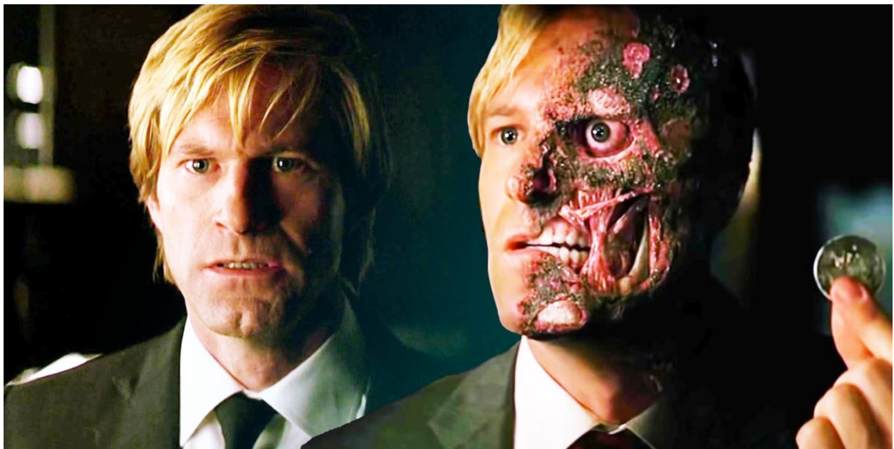
Slika 9.: Harvey Dent prije i poslije transformacije u Two-Facea