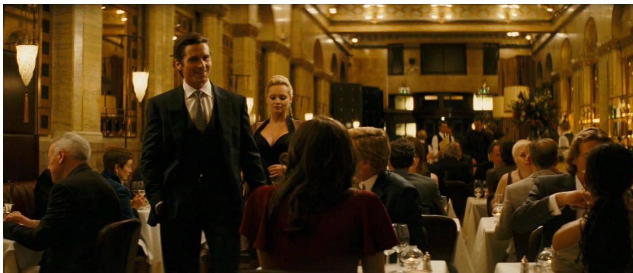
Slika 15.: Bruce Wayne, Nataša, Rachel Dawes i Harvey Dent

U prvom stripovskom serijalu Batman u svojoj prvoj godini djelovanja mora spriječiti izabranog gradonačelnika i njegovu kabalu potpomognutu korumpiranim policajcima od potpune prevlasti nad Gothamom, dok u drugom serijalu Batman mora spasiti grad od stanja u kojem bande efektivno upravljaju gradom dok je vlast nemoćna (Spanakos, 2019: 96-99).