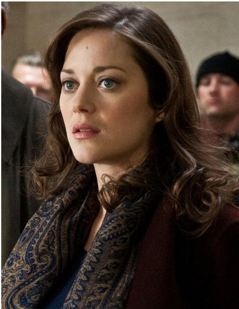
Slika 11.: Miranda Tate/Talia Al Ghul