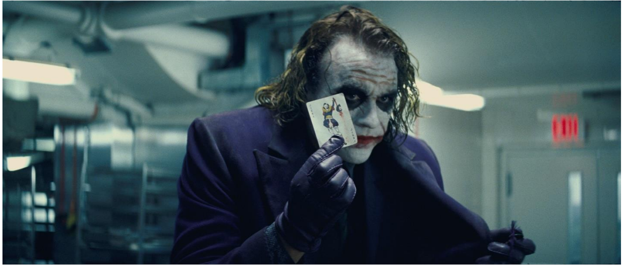
Slika 8.: Joker i njegova posjetnica