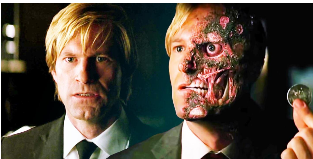
Slika 9.: Harvey Dent prije i poslije transformacije u Two-Facea