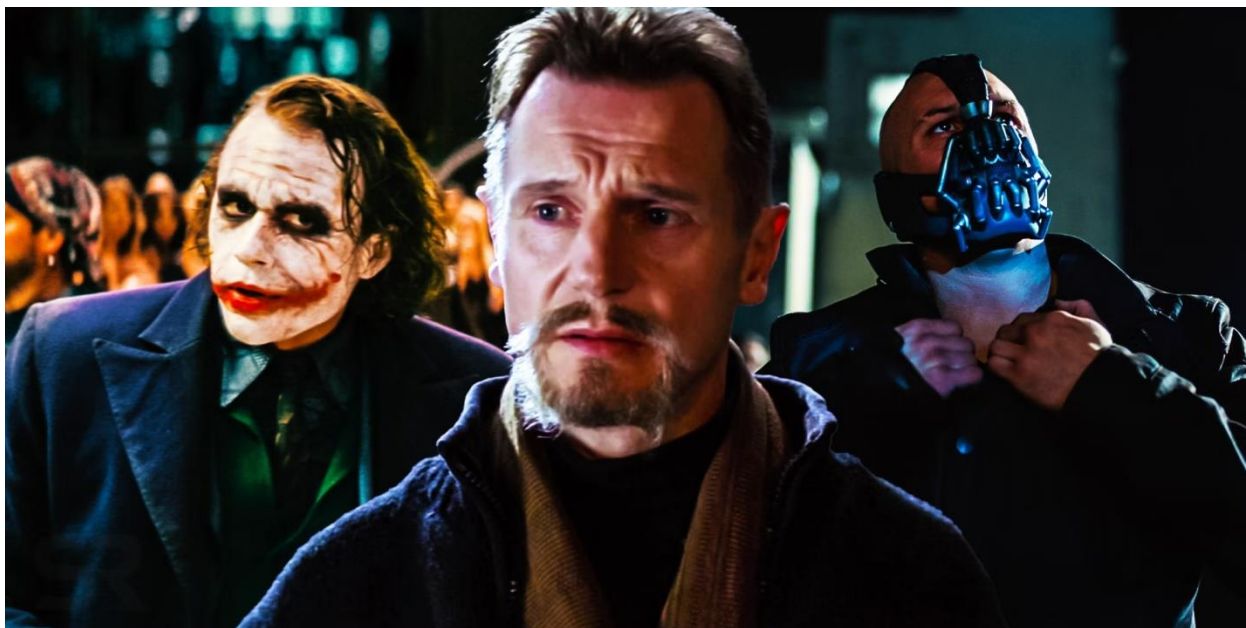
Slika 17.: Galerija zlikovaca

Korupcija je posebno raširena među onima koji bi trebali raditi na iskorjenjivanju iste – od Falconeovih ljudi u filmu „Batman: Početak“ pa do Maronijevih ljudi, detektiva Burkea i Ramirez u filmu „Vitez tame“ pa čak, na neki način, i do Jima Gordona koji je, kako bi učvrstio vjeru građana u dobro, ponudio im „ lažnog idola “ u obliku Harveyja Denta i zataškao njegovo pretvaranje u psihopata i ubojicu znanog kao Two-Face.