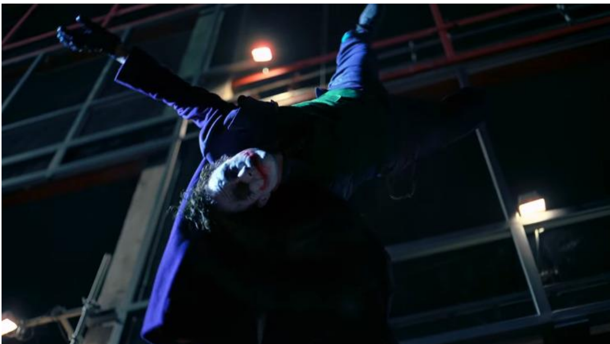
Slika 18.: Jokerovi posljednji trenutki

Neki autori, poput spomenutog Kolenica, vide Jokerovu antiracionalnost kao odgovor na Batmanovu racionalnost, kao što je i sam postmodernizam odgovor na strahote modernizma (Kolenic, 2009: 1031, cit. prema Yilmaz i Fundalar, 2022: 6). U sceni smještenoj u Općoj bolnici vidimo kako Joker uvjerava Denta da je kaos prirodan, pošten i lijep te mu nudi predokus kaosa koji jedini osigurava pravednost (Kolenic, 2009: 1031, cit. prema Yilmaz i Fundalar, 2022: 6).