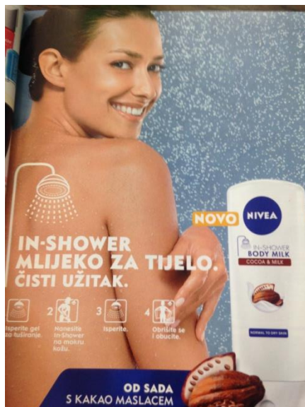
Slika 3 Fotografski primjer mita Ženstvena ljepota

Izvor: Cosmopolitan Hrvatska, srpanj 2014.