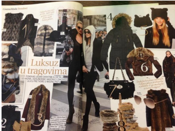
Slika 4 Fotografski primjer mita Dostupni luksuz