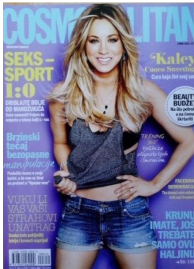
Slika 2 Fotografski primjer mita Lice s naslovnice