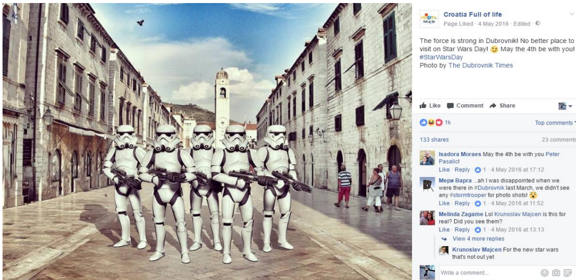
Slika 1: Croatia Full Of Life, Facebook 1

to se najčešće odnosi na lajkanje, komentiranje i dijeljenje sadržaja na Facebook stranici, praćenje njihovog Instagram profila i lajkanje fotografija te promoviranje i najava različitih evenata diljem Hrvatske za vrijeme turističke predsezone. Također odnosi se i na pitanja poput: „Tko će posjetiti Hrvatsku ove godine?“. U ovu kategoriju spadaju i foto albumi koje Hrvatska turistička zajednica kreira na svom Facebook profilu svakog petka. Albumi se sastoje od fotografija korisnika koji su koristili hashtagove #Croati ili #CroatiaFullOfLife prilikom objave svojih fotografija na društvenim mrežama. Fotografije se prate putem hashtagove te se prikupljaju na svim društvenim mrežama te na kraju objavljuju u jednom foto albumu. Prilikom objave foto albuma obavezno zahvale korisnicima na njihovim fotografijama te ponovno koriste CTA u kojem ih pozivaju na lajkanje i dijeljenje fotografija.