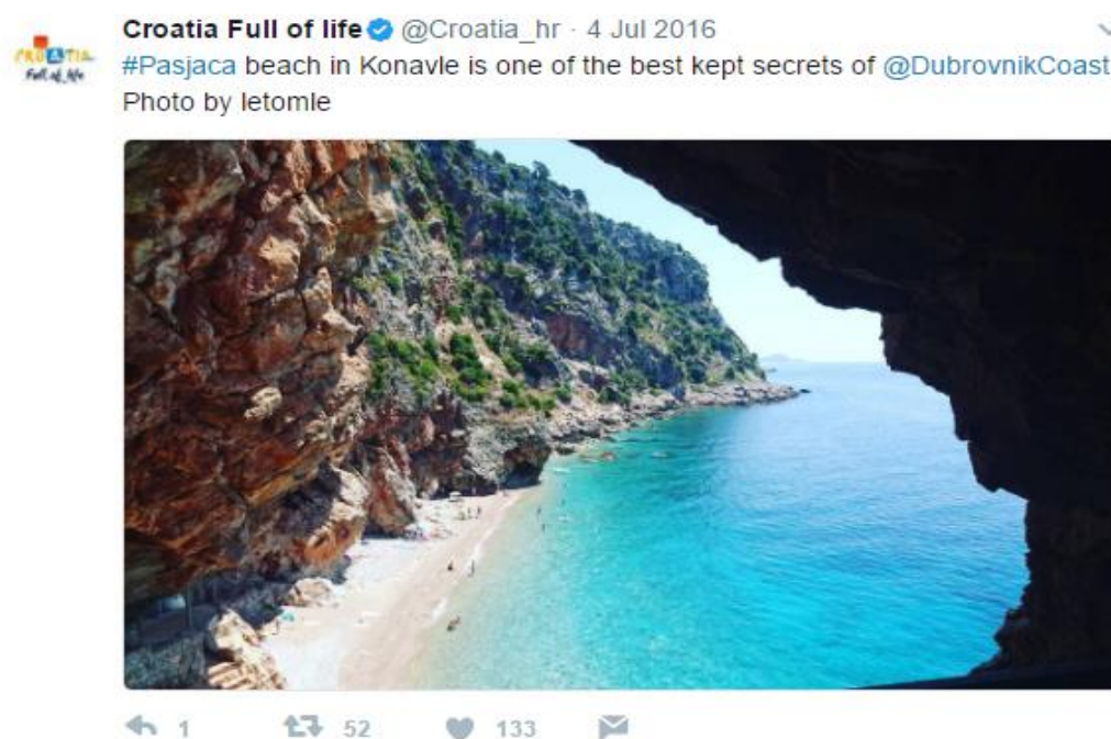
Slika7: Korištenje mentiona i hashtaga, Twitter 7

Za razliku od Instagrama koji također funkcionira na principu pretraživanja i sortiranja sadržaja pomoću hashtagova, na Twitteru službeni hashtagovi #CroatiaFullOfLife i #Croatia nisu konstantni u svakoj objavi. Za fotografije različitih mjesta diljem Hrvatske koriste hashtag mjesta koji je prikazan na slici naprimjer: #Brač, #Hvar ili #Trogir. Osim hashtaga, za Twitter je karakterističan i takozvani „Mention“ koji započinje oznakom @ i korisničkim imenom na Twitter profilu tako uz sadržaj koriste (osim hashtagova) i mogućnost „spominjanja“ pa često tagiraju turističke zajednice pojedinih mjesta naprimjer @LikeZadar ili @NPKrka. Svi postovi su pisani isključivo na engleskom jeziku.