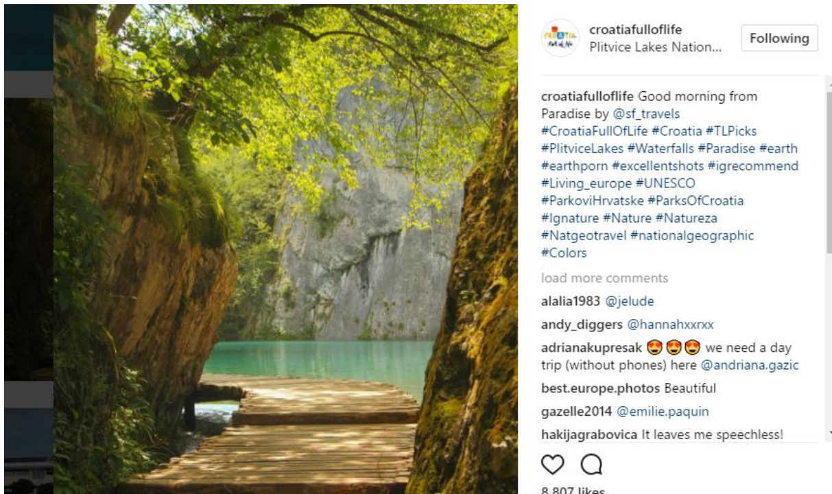
Slika 5: Korištenje hashtagova, Instagram 5

Hrvatska turistička zajednica na svom Instagram profilu oznaku lokacije koristi gotovo u svakoj objavi. Lokacije su uglavnom općenite (Hvar, Brač, Trogir), ali ponekad koriste i uže oznake lokacije kao što su lokacije plaže, Stiniva, (Vis) ili znamenitosti kao što je Fortica (Hvar). Ukoliko ne koriste lokaciju, obavezno je naznače kroz hashtag mjesta koji je prikazan na fotografiji, a ukoliko objavljuju informativne fotografije koje se tiču primjerice Europskog preventva u nogometu koriste i vlastitu lokaciju – Croatia Full Of Life. Sve objave pisane su isključivo engleskim jezikom.