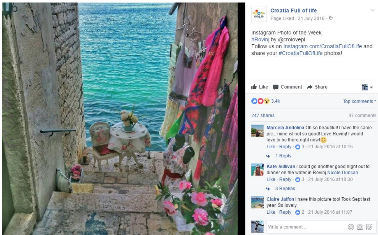
Slika 4: Instagram fotografija tjedna, Facebook 4

Uz svaku objavu na društvenim mrežama koja se odnosi na promociju društvene mreže Instagrama na Facebooku, neizostavan je i službeni hashtag Hrvatske turističke zajednice #Croatiafulloflife s obzirom da upravo putem tog hashtaga pregledavaju fotografije različiti korisnika Instagrama te odabiru jednu koja je proglašena fotografijom tjedna te je objavljuju i na Facebooku i na Instagramu i na Twitteru. Za kraj tjedna Hrvatska turistička zajednica obavezno objavi „Fan foto album“. To je kompilacija najboljih fotografija po njihovom izboru koju su objavili korisnici društvenih mreža na svim platformama koristeći hashtag #Croatiafulloflife ili samo #Croatia ili koje su dobili od korisnika u inbox ili na zid. Također u ovim objavama obavezno koriste CTA u kojem pozivaju korisnike da lajkaju njihovu stranicu i sheraju fotografije.