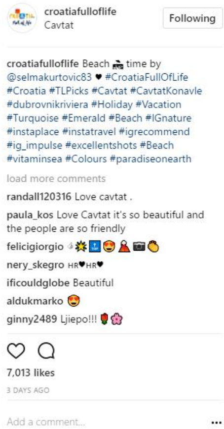
Slika 6: Korištenje oznake lokacije, Instagram 6

CTA koriste za neobaveznu komunikaciju s korisnicima i postavljaju jednostavna pitanja na koje korisnici mogu jednostavno i kratko odgovoriti kao što su: „Jeste li spremni za put?“ „Jeste li spremni za plažu?“ ili koriste mogućnost označavanja prijatelja u komentarima ispod slike kako vi što veći broj ljudi vidio sliku i kako bi doseg fotografije, ali i samog profila bio veći kao naprimjer: „Označi prijatelja kako bi mu poželio sretan ponedjeljak!“ Također, za veći broj komentara i bolji interakciju koriste „Pogodite gdje se nalazi!“ gdje namjerno izostave bilo kakvu lokacijsku oznaku nekog mjesta u Hrvatskoj, a korisnici moraju pogoditi i napisati u komentar gdje se to mjesto u Hrvatskoj nalazi.