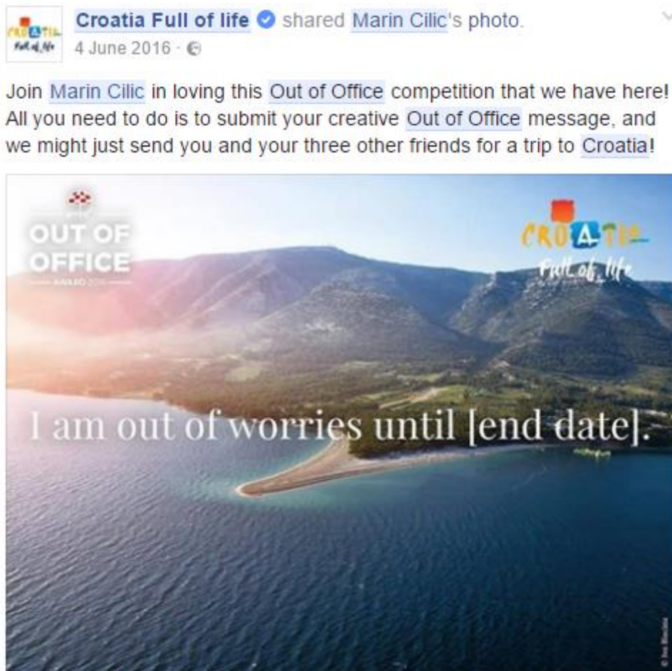
Slika 2: Out Of Office nagradna igra, Facebook 2

U ovoj kategoriji se koriste prigodni hashtagovi kao što su #Eurosong prilikom komunikacije o Eurosongu i Nini Kraljić te hashtagovi #CroatiaFullOfLife #BeProud #EURO2016 #CRO prilikom komunikacije o Europskom prvenstvu u nogometu.