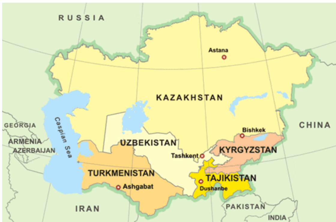
Slika 2.1. države Srednje Azije, Izvor: http://www.russia-ukraine-travel.com/maps-of-central-asia.html

Srednja Azija naziv je za političku i geografsku regiju na azijskom kontinentu. Njen naziv najbolje je razumijeti taksonomijski. Ova regija se svojom velikom površinom prostire od Kaspijskog jezera na zapadu, sa Ruskom Federacijom graniči na sjeveru, na istoku dopire do Kine, dok na jugu graniči sa Afganistanom i Iranom. Naziv ove regije, može se stoga tumačiti kao politički prije no geografski uvjetovan, shodno činjenici da se regija ne nalazi u fizičkoj sredini kontinenta. Jednako tako, zanimljiva je činjenica kako se naziv Srednja Azija u stručnoj politološkoj literaturi počeo upotrebljavati tek nakon raspada Sovjetskog Saveza. Nakon sedamdeset godina nametnute sovjetske vlasti disolucijom Sovjetskog Saveza 1991. godine kreiraju se nove samostalne države prema administrativnim granicama bivših federalnih jedinica. Novonastale države na ovom području su: Kazahstan, Turkmenistan, Uzbekistan, Tadžikistan te Kirgistan. Zbog zajedničkog nastavka „stan“ na kraju svakog od naziva ovih država, česta su referiranja na njih kao stanove .