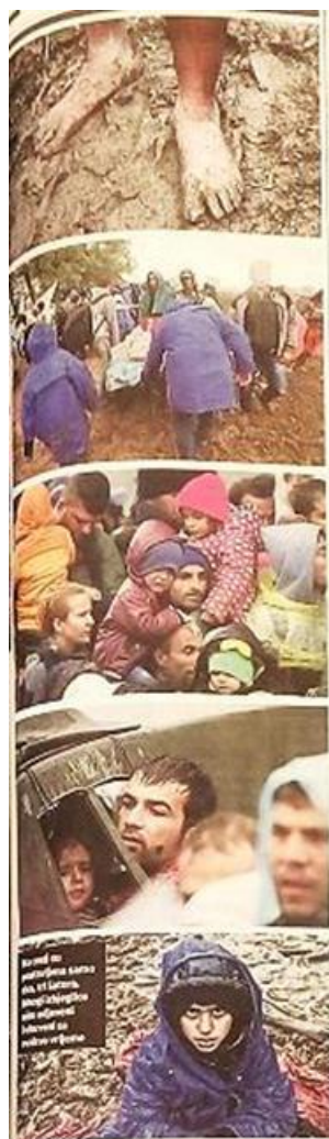
Slika 11. Večernji list, 20.10.2015, 5. str

Broj ljudi prikazanih na fotografijama također utječe na to kako će poruka koju nosi biti percipirana. Pojedinačne ili fotografije koje prikazuju manji broj ljudi (dvoje do četvero) primatelji poruke ne percipiraju kao prijetnju zato što su brojčano nadmoćni. Masovne fotografije bi mogle izazvati osjećaje ugroženosti, propitivanja motiva pa možda čak i straha.