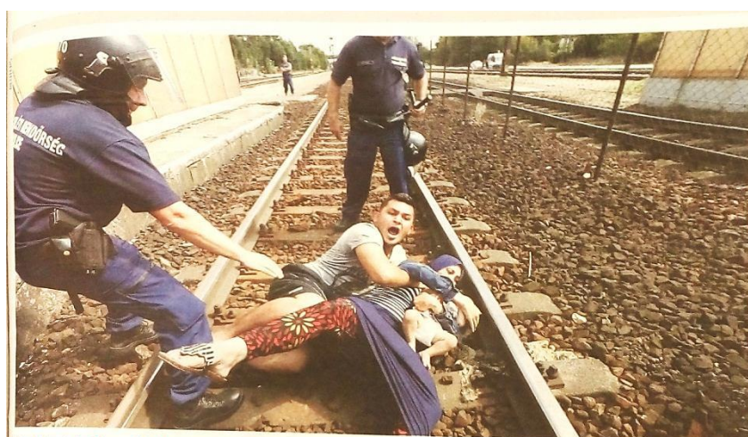
Slika 24. Večernji list, 09.12.2015., 5. str.

Slično je i sa Slikom 23 objavljenom u Večernjem listu koja prikazuje djevojčicu koja izgleda kao da od policajaca traži vodu ili ju je neznancima jednostavno privukla dječja radoznalost. U kontrast je stavljena nevinost na njenom licu i pendrek kojeg možemo razaznati na policajčevoj odori, a koji, u ovom kontekstu, simbolizira prijetnju. Policajac ponovno predstavlja prepreku na putu, a kada u širi kontekst stavimo i manje fotografije koje se nalaze unutar novina, vidimo da u nizu stoje tri policajca koji onda i doslovno predstavljaju prepreku. Kada se uoči kontrast uzrasta djevojčice i policijskih snaga koje su tu postavljene, situacija izgleda i pomalo apsurdno (iako shvaćamo oni tu nisu samo radi nje).