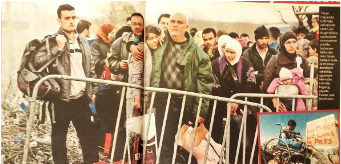
Slika 3. Jutarnji list, 29.02.2016., 8.-9. str.