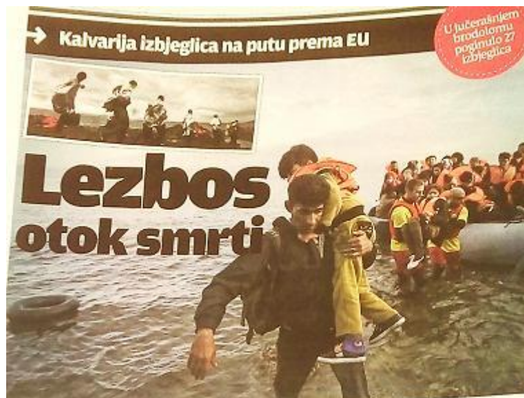
Slika 10. Večernji list, 12.11.2015, 12. str.

Slika 9 ide i dalje od toga zato što daje usporedni prikaz kako granica izgleda u Mađarskoj, a kako u Hrvatskoj. Na mađarskoj strani vidi se žilet žica kroz koju se provlače izbjeglice i migranti, dok, iako čuvani od strane policajaca, na hrvatskoj strani oni stoje slobodno. Tek iščitavanjem teksta koji prati sliku, saznaje se da se fotografijama želi dočarati stanje na granicama, no ostaje pitanje konotativnog značenja i onoga svega što se na slikama ne može vidjeti, a što se događalo i s hrvatske strane.