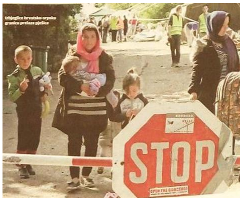
Slika 2. Večernji list, 2.10.2015., 10. str

sličnim prizorima posebno je potresno, no postoji svjesnost da je njihov najveći blagoslov u ovakvoj situaciji, barem kod onih mlađih, njihovo nerazumijevanje situacije. Posebno je to vidljivo na Slici 1 gdje se dječak bezbrižno igra na plastičnim štitovima policije, a na njegovom licu nazire se čak i osmijeh. Ta je fotografija i primjer da ograda može biti i ljudska u obliku policije koja ne propušta dalje. Vidljiv je i očiti kontrast – nevinost i, moglo bi se čak reći, blaženstvo dječaka, nasuprot reda policije s plastičnim štitovima koji u ovom slučaju predstavljaju nekakvu negativnost, protutežu dječjoj pozitivnosti. U pozadini se vide i snažne ruke koje dječaka drže, kao da simboliziraju snagu njegovih roditelja koji će ga po svaku cijenu dovesti u bolji svijet, a igra dječaka, unatoč uvjetima, simbolizira roditeljsku odlučnost da njihovo dijete što bezbolnije prođe kroz taj proces tranzicije. To je prikazano i na Slici 2, gdje djeca imaju igračke koje simboliziraju njihovo djetinjstvo na putu. U to su vrijeme, novine bile pune fotografija koje prikazuju djecu s igračkama koji gledaju u daljinu kroz kordone policije, kroz ograde, kroz plastične štitove policajaca i druge raznorazne barijere.