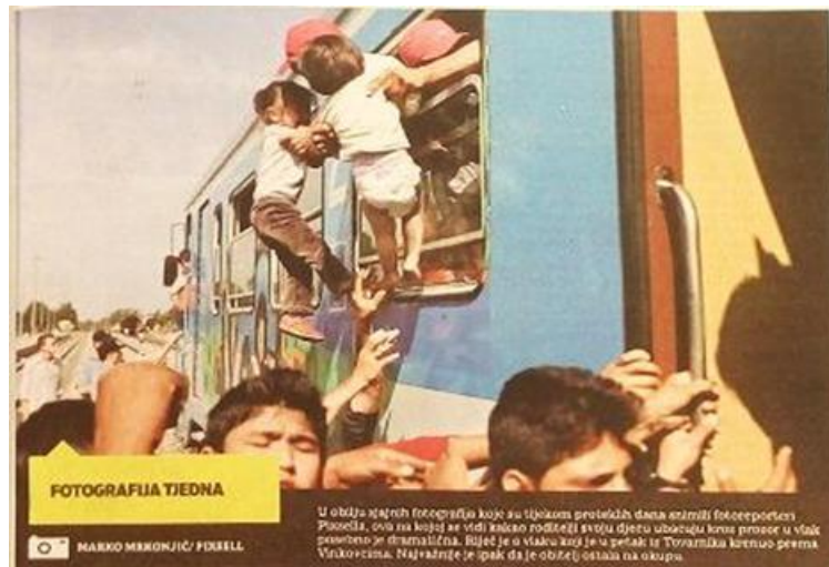
Slika 7. Večernji list, 20.09.2015., 7. str.

Potpuna suprotnost prethodnoj slici je Slika 7 koja itekako označava kretanje. Možda čak označava trenutke koji su obilježili cijelu jednu etapu priče o izbjeglicama i njihovom putovanju. Mediji su svako malo bili prepuni snimki i fotografija trenutaka ukrcavanja u vlak, trenutaka koji su (barem) dvostruko emocionalno obilježeni. S jedne strane tu je sreća onih koji su se uspjeli ukrcati zato što su uspješno prošli jedan dio svog puta i mogu prijeći na sljedeći, dok su s druge strane tuga i očaj onih koji to nisu uspjeli. Posebno su potresne sudbine onih koji su se uspjeli ukrcati i izboriti za svoje mjesto, ali su njihove obitelji ili djeca ostali za njima. Kaos pri ukrcavanju vidljiv je i na ovoj fotografiji. U dnu se vide ljudi, pretežno mladići, koji se bore za ulazak, može se pretpostaviti do kakvog je naguravanja došlo. Može se razaznati i da je ovo zadnji vagon, dakle posljednja prilika do sljedećeg puta koji je vremenski neizvjestan. Ono što promatrač odmah uoči, i ono što je subjekt ove fotografije, su djeca, bebe, koji se dodaju (vjerojatno roditeljima i obitelji) kroz prozor vagona. Nesvakidašnjost takvog događaja jasno dočarava bezizlaznost situacije.