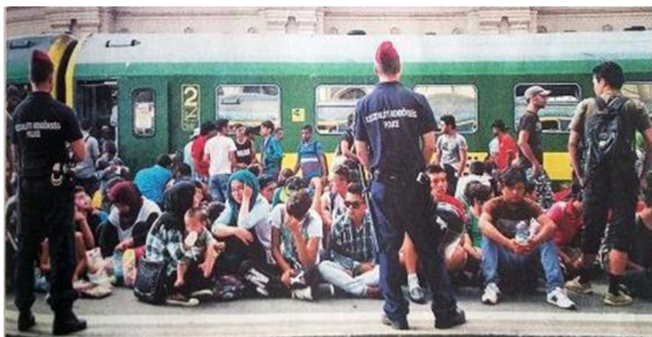
Slika 6. Globus, 09.10.2015., 55. str.

ostali sudionici u prometu, što još više naglašava izvanrednost situacije. I kompozicija fotografije ukazuje na podijeljenost – s jedne su strane izbjeglice, s druge strane pripadnik policijskih snaga, pripadnik naroda na čijoj se zemlji trenutno izbjeglice nalaze, pripadnik nečega čemu oni ne pripadaju. Kompozicijom je posebno naglašen i očigledni kontrast – policajac koji u svom tamnom odijelu označava negativnu stranu i djeca u šarenim skafanderima na drugoj, pozitivnoj strani. Kontrast u bojama toliko je izražen da je odmah jasno da je to središnja točka na koju se fotograf oslonio kod snimanja ove fotografije. Kao i u prethodnom poglavlju, moglo bi se reći da policajac označava određenu barijeru, ogradu, prepreku za izbjeglice. Omjer na fotografiji gdje policajac, unatoč tome što je u brojčanoj manjini. Izgleda viši i moćniji od kolone, također je jedan od pokazatelja kojim možemo iščitati što se otprilike događa i bez nekakvog prethodnog znanja.