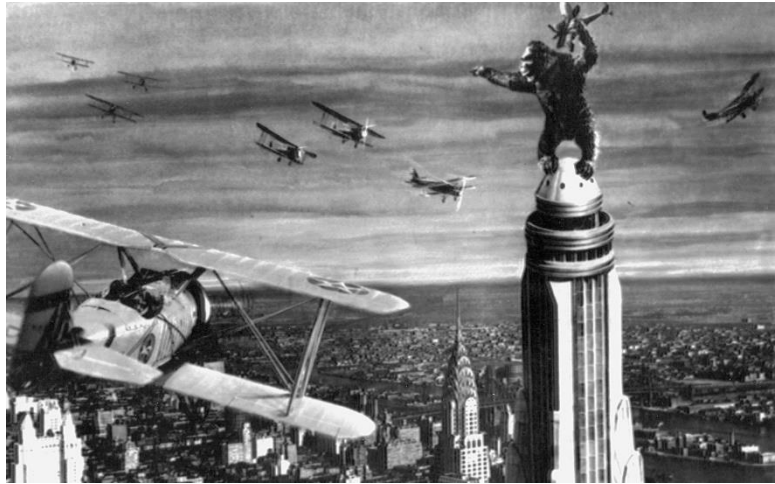
Slika 7 Scena iz filma King Kong

Prva verzija ovog filma snimljena je 1933. godine, a od tada su snimljene još dvije, 1976. i 2005. godine. Sva tri filma su vezana tematski za New York i imaju sada već kultnu scenu golemog King Konga koji se uspinje na jedan od gradskih nebodera. U prvom i trećem filmu radi se o vjerojatno najpoznatijem neboderu u gradu, Empire State Building-u, dok se u drugom filmu iz 1976. uspinje na jedan od tornjeva World Trade Centra. Originalna verzija filma od gradskih lokacija uključuje samo Empire State Building, dok najnovija verzija prikazuje i druga mjesta poput Times Square-a, ulica na Manhattanu i Central Parka.