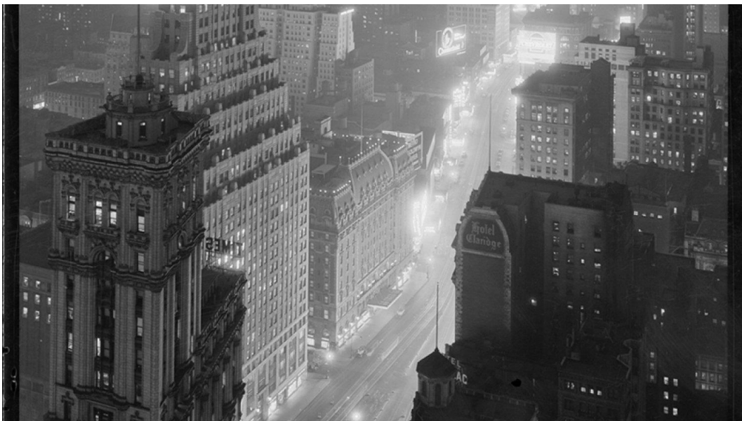
Slika 4. The Great White Way