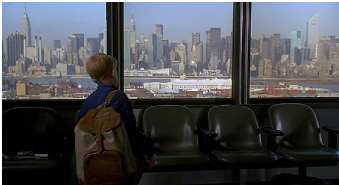
Slika 9 Scena iz filma Sam u kući 2 , aerodrom La Guardia

Ovaj sada već kultni obiteljski film koji se već 2 desetljeća emitira u božićno vrijeme postao je svojevrsna razglednica zimskog New Yorka. Film obiluje scenama na svim najpoznatijim lokacijama u božićno vrijeme i što se tiče kadrova s lokacije, smjestio se u sam vrh u odnosu na sve ostale koji su ranije navedeni. Avantura dječaka Kevina zaista je pokrila mnogo gradskih znamenitosti pa tako sam dolazak počinje s dolaskom na aerodrom La Guardia.