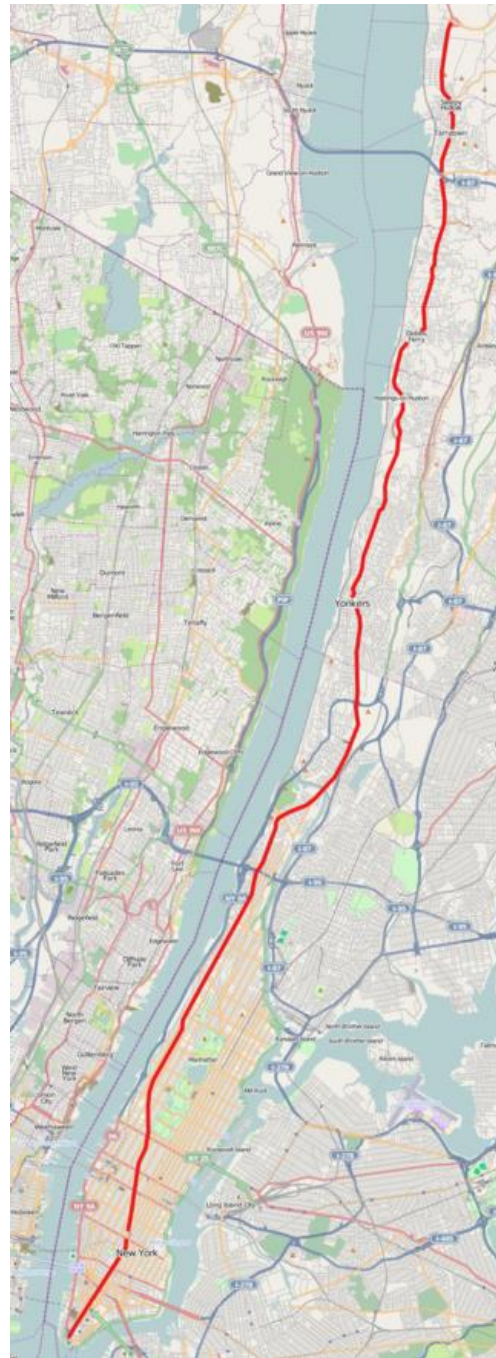
Slika 2. Broadway, (Izvor : Wikipedia)

Broadway je ulica u New Yorku koja se najčešće povezuje s cjelokupnom kazališnom scenom u gradu. Ulica se proteže kroz Manhattan u dužini dvadeset i jednog kilometra, te se nastavlja još tri kilometra kroz susjedni Bronx. Od tamo se nastavlja u susjedna naselja u okrugu Westchester. Jedna je od najstarijih ulica u gradu, a pretpostavlja se da je nastala za vrijeme nizozemske vladavine dok se grad još zvao Novi Amsterdam. Prije dolaska Nizozemaca zvala se Wicquasgeck i koristili su ju američki Indijanci kao prolaz kroz močvarne dijelove otoka. Dolaskom Nizozemaca put je postao glavna cesta kroz grad Novi Amsterdam. Po dolasku Nizozemaca put je ubrzo postao glavna cesta kroz jug Novog Amsterdama. Nizozemski istraživač i poduzetnik, David Pietersz de Vries ga ju prvi put spominje u svom dnevniku 1642 (cesta Wicquasgeck koju su stalno prolazili Indijanci).(…) Ulica je najstarija sjeverno – južna linija u gradu, datirajući do prvog Novog Amsterdama, iako većim dijelom