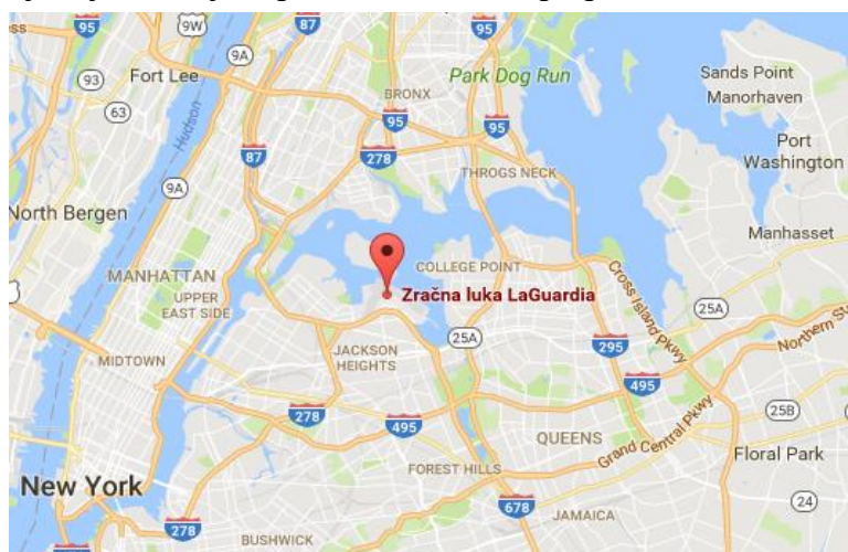
Slika 10 Karta New Yorka

Naime navedeni aerodrom se nalazi u Queensu i uopćen nije okrenut prema Manhattanu gdje se nalaze sve prepoznatljive zgrade s gornje slike. Aerodrom je zapravo okrenut prema četvrti Bronx. Daljnje lokacije koje se potom pojavljuju u filmu su most Queensboro i koncertna