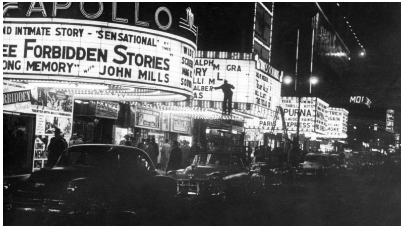
Slika 3 Broadway

„Počevši sa The Red Millom , brodvejske predstave su instalirale eklektične znakove izvan kazališta. S obzirom da su obojene žarulje gorjele prebrzo, koristili su bijela svijetla što je Broadwayu priskrbilo nadimak The