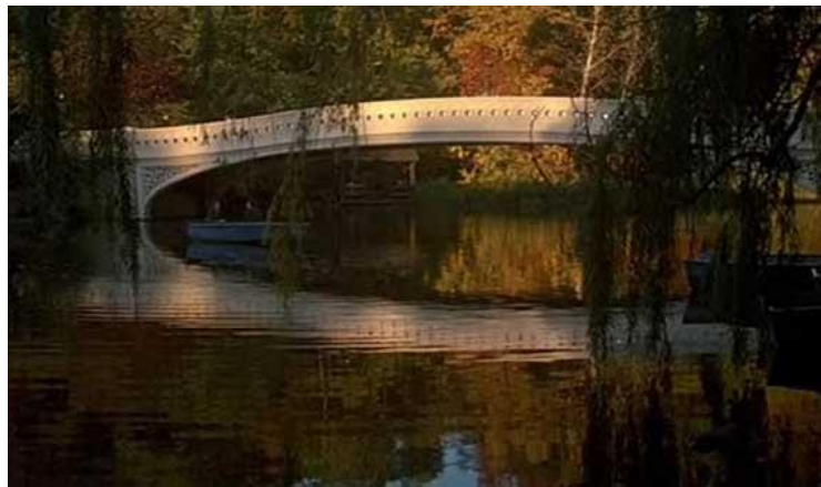
Slika 8. Scena iz filma Jesen u New Yorku

Jesen u New Yorku je ljubavna romantična drama u kojoj glavne uloge tumače Richard Gere i Wynona Ryder. Kao što i samo ime kaže, radnja se odvija na prijelazu iz jeseni u zimu, a film obiluje romantičnim i sjetnim scenama u New Yorku. Jedna od najpoznatijih lokacija koja se prikazuje u filmu je most Bow u