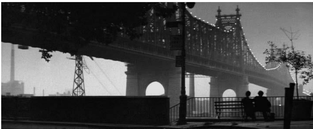
Slika 6 Scena iz filma Manhattan

Manhattan je djelo Woodyja Allena i kao i njegovi drugi filmovi, smješten je u New Yorku i odražava duh grada. Kao što i samo ime govori, tema filma je ljubavna priča smještena na Manhattanu, a poznat je postao po tome što u svojim kadrovima veliča grad i njegove stanovnike. Sniman je u crno bijeloj tehnici što je dodatno naglasilo vizuru grada. Na samom početku filma nekoliko privih rečenica opisuje koliko glavni junak kojeg glumi sam Woody Allen voli svoj grad : „Poglavlje prvo : Bio je žilav i romantičan kao i grad kojeg je volio. On je obožavao Manhattan. Idolizirao ga je preko svake granice.” (Timeout, 2017) Film je sniman na ulicama Manhattana, u Central Parku, a najpoznatija scena je prikaz osvijetljenog mosta Queensboro.