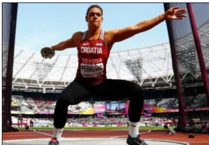
Slika 5: Sandra Perković (SP u atletici London, 2017.)