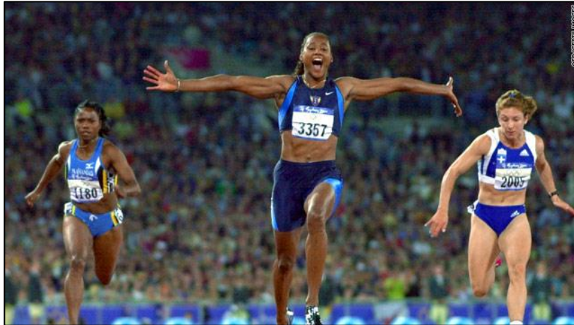
Slika 2: Marion Jones (OI u Sydneyju 2000. godine)