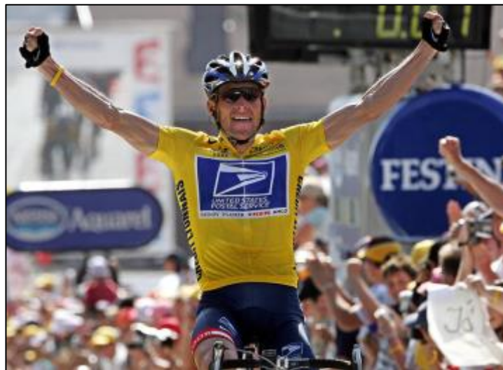
Slika 3: Lance Armstrong, Tour de France 2004. godine