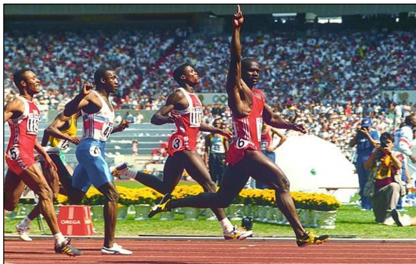
Slika 1: Ben Johnson (OI u Seulu 1988.)