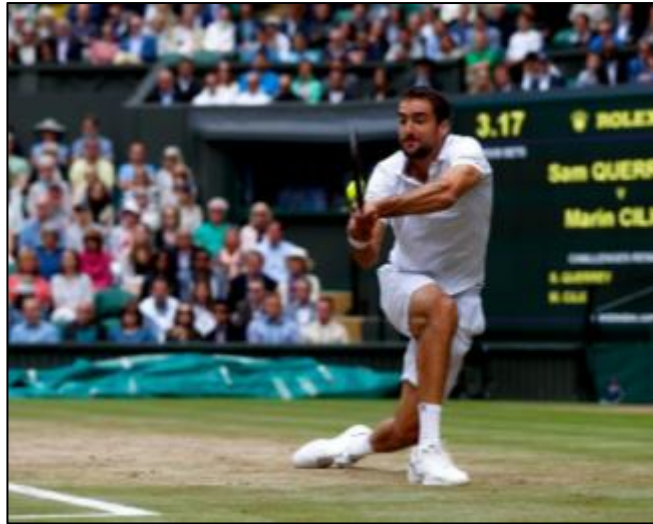
Slika 4: Marin Čilić (Wimbledon 2017.)