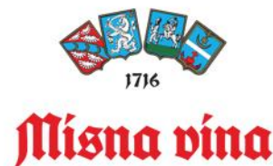
Slika 6: Misna vina Đakovačko-osječke nadbiskupije