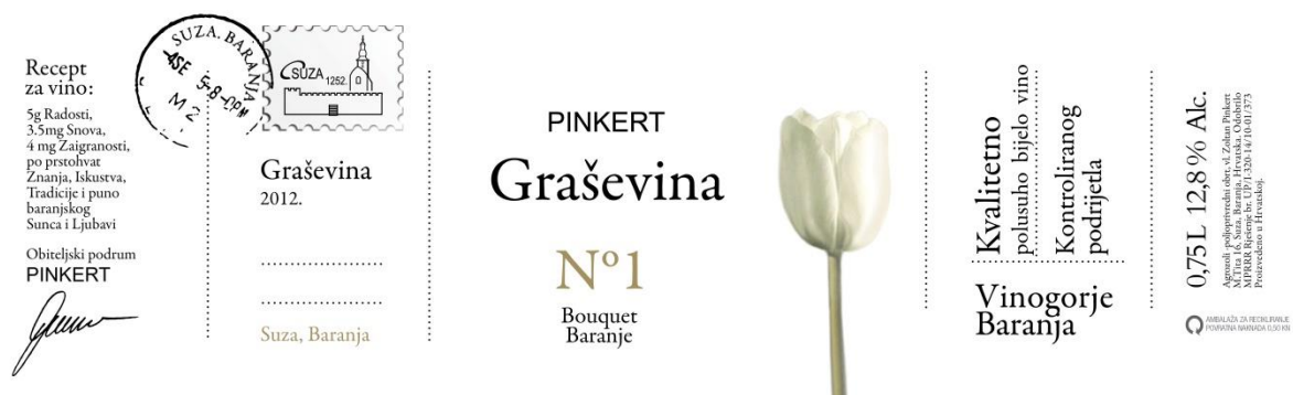
Slika 3: Etiketa Vina Pinkert

Vina Pinkert pokušavaju brend svojih vina kreirati naglašavanjem obiteljske atmosfere same vinarije. Ova vinarija svojim etiketama pokušava poslati razglednicu iz malog mjesta Suza u Baranji i na taj način prikazati bogatu vinsku raznolikost toga kraja. Također, ova vinarija uz svoja vina veže opis Iz Suze s ljubavlju što dodatno podupire njihova nastojanja da prikažu vinariju kao obiteljsku i da prezentiraju Baranju (Vina Pinkert, 2017).