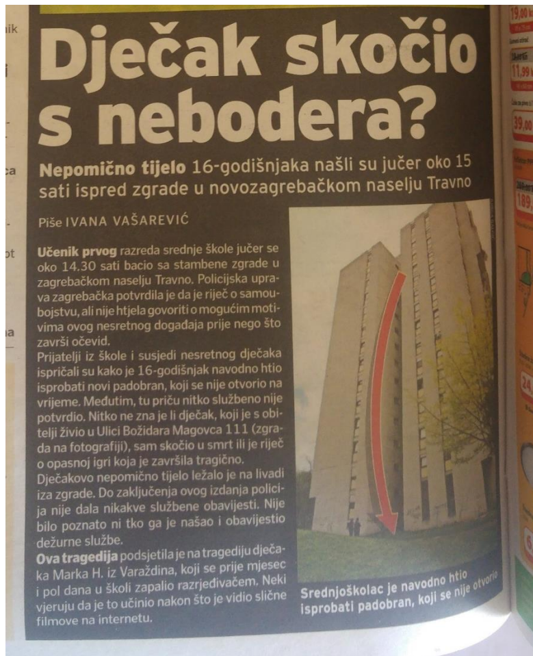
Fotografija 4. Tekst iz 24 sata (24.04.2008.) u kojem se navodi točna adresa stanovanja žrtve

Iako objava pojedinosti o nekoj osobi u tekstu mogu biti zanimljive, to je iznimno negativna praksa koja se može sresti i u našim dnevnim novinama, iako je u kodeksima upravo kategorija privatnih podataka posebno spomenuta. Objavom podataka kao što su škola ili razred žrtve, imena njihovih prijatelja ili profesora, čime se žrtva bavila u slobodno vrijeme, što ju je zanimalo, koliko djece ima obitelj žrtve, kakva im je obiteljska situacija i slično, novinari ostavljaju prostora da publika donosi zaključke o tome zašto je neka osoba suicidalna. Većina tekstova najčešće objavljuje u koju je školu žrtva išla, i iz kakve su obitelji došli. To može dovesti do potpuno pogrešnih zaključaka zbog kojih će publika imati krivu predodžbu o suicidalnom ponašanju, i možda neće znati prepoznati znakove suicidalnog ponašanja u svojoj okolini. Tek 37% objavljenih tekstova ne donosi nikakve privatne detalje o žrtvi.