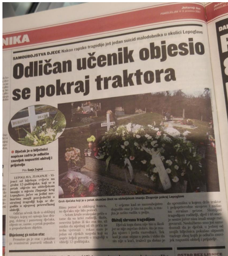
Fotografija 3. Tekst iz JL (03.12.2007.) u sklopu kojeg je fotografija groba žrtve s jasno istaknutim imenom i prezimenom