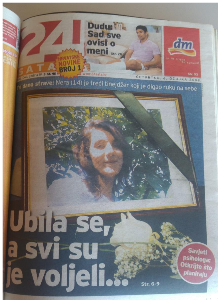
Fotografija 1. Naslovnica 24 sata (06.03.2008.) koja na senzacionalistički način prikazuje smrt maloljetnice, prikazujući i fotografiju njezinog lica, pri čemu njezin identitet nije zaštićen